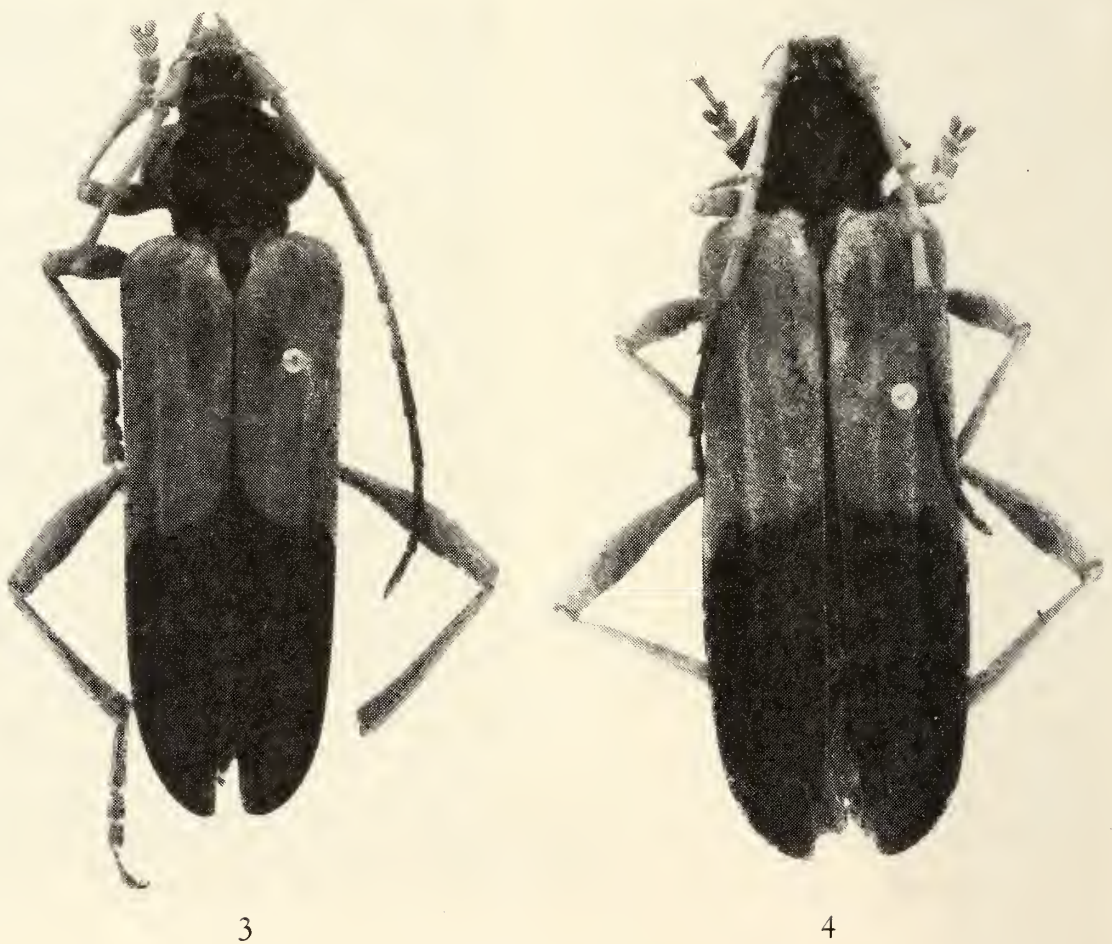
Abb. 3–4: 3 ♂, 4 ♀ von Schmidtiana gertrudis spec. nov.

Fühler (♂) knapp das letzte Drittel der Elytren erreichend, Schaft rund, zur Spitze etwas verdickt und oben außen zu einem scharfen Grat abgeflacht, fein und dicht punk-