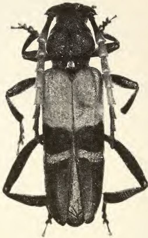
Abb. 5: Thompsoniana bogenbergeri spec. nov.

zu den kleinen, gegen die Scheibe oben deutlich abgesetzten Seitenhöckern leicht konvex erweitert, von diesen bis zur Apikalfurche kräftiger konvex verengt; Seiten des Pronotums glatt und glänzend; Prosternum in der Apikalfurche fein querverieft, dahinter fein punktiert; 5. Sternit apikal abgerundet und in der Mitte winkelig eingeschnitten. Gestalt breiter, Elytren nach hinten nicht verschmälert.