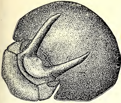
Abb. 1: O. caprai n. sp. ♂

ten ausgezeichnet, die zum großen Teil nabelförmig ausgebildet sind. Vorderer Seitenrand wenig geschweift, Vorderecken gut vorgezogen und spitz, hinterer Seitenrand ebenfalls etwas geschweift. Basis fein gerandet.