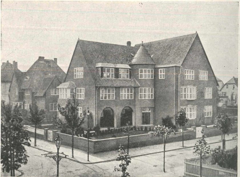
Das Deutsche Entomologische Institut der Kaiser-Wilhelm-Gesellschaft Berlin-Dahlem, Göljarstraße 20