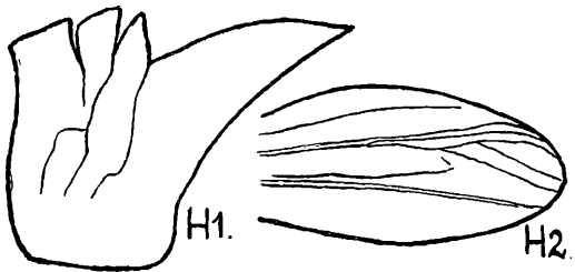
Tmethis heldreichi heldreichi Br. W., ♂.

Described from two males and three females, from Adalia, 15. 6. 27; one female from Köppeshan, 3. 6. 27 ( Tockhorn ). Type and paratypes in the Deutsches Entomologisches Institute; except one male and two female paratypes placed in the British Museum (Natural History).