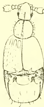
Fig. 3. Radamopsis bickmanni nov. gen. nov. spec.