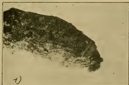
Fig. 1. Abdomen von Argynnis paphia L. ♀.