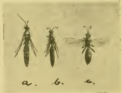
Fig. 3. a) ♂; b) ♀ Hermaphrodit psych; c) ♀.

Als typisches Beispiel von psychischem Hermaphroditismus fasse ich ein Exemplar von Ichn. suspiciosus W. auf, das ich auf Fig. 3 unter b abgebildet habe. Dieses Individuum läßt sich kurz diagnostizieren: Antennen weiblich (wahrscheinlich auch ganzer Kopf); Rest männlich. Das Abdomen ist länglich und schwäch- tig wie das der ♂♂; es fehlt auch die weiße Spitze am Abdomen- ende, wie sie für die ♀♀ charakteristisch ist; der Hinterleib ist somit auch um ein Segment ärmer als es die weiblichen Hinterleiber sind. Wir konnten auch keinen ovipositor entdecken.