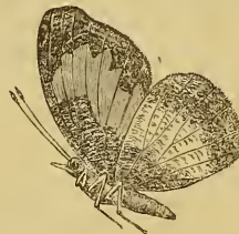
Vanessula Buchneri Dew. ♂.

doch zeigt sich die Schlussader in der Mitte sehr dünn und schwach. Der Ursprung der Ader 11 des Vorderflügels liegt über der Schlussader der Discoidalzelle nach der Flügelspitze zugerückt, so dass an Ader 7 des Vorderflügels zwischen Flügelspitze und Discoidalzelle 4 Adern (8, 9, 10 und 11) einmünden. Ader 11 des Vorderflügels tritt so