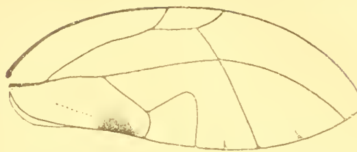
Fig. 3. Udamostigma tessmanni n. sp. Vorderflügel.

den Apex schwach verbreitert, Ende schief abgeschwitten. Tibia an der Basis mit einem kräftigen Zahn, am Apex mit 5 schwarzen Dornen. Erstes Tarsalglied lang mit einem Dorn am Apex.