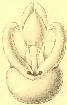
Fig. 6. Udamostigma tessmanni n. sp. ♂ Genitalen von hinten.

tessmanni : 4. und 5. gleich lang, doppelt so lang wie 2.; 6. und 7. gleich lang, 1\frac{1}{2} mal so lang wie 2.