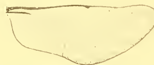
Fig. 4. Udamostigma tessmanni n. sp. Hinterflügel.

Vorderflügel lang, gestreckt, Ende spitz gerundet. Geäder wie bei Ud. hibisci Froggatt (Proc. Linn. Soc. N. S. W. XXVI, p. 287, pl. XV fig. 8; XVI, fig. 18). Radius noch kürzer als bei Ud. hibisci . Obere Zinke des Cubitus sehr viel stärker nach oben ausgebogen als bei Ud. hibisci .