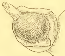
Fig. 2. Udamostigma tessmanni n. sp. Kopf v. d. Seite.

gefärbt. Die Ocellen klein, am hinteren Teile des Augeninnenrandes stehend und auf diesen schwach übergreifend. Stirnkegel fehlen. Augen stark halbkugelig vorspringend. Die Fühler sehr lang, sitzen auf den stark vorgezogenen Vorderecken des Kopfes. Erstes Fühlerglied plump, kurz, zweites zylindrisch, Drittes am längsten, schlank, 3mal so lang wie das