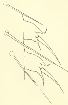
Fig. 3. Paryphocomus angustipennis Enderl. 2 Ctenidiobothrien vom 1. Hintertarsenglied. Vergr. 700 : 1.

Thorax rostgelb bis bräunlich rostgelb, Rückenschild an den Seiten mehr oder weniger breit geschwächt; Scutellum rostbraun, Hinterrücken schwarz und etwas glänzend. Thorakalpubescenz mäßig lang, sehr fein, grau, von oben einige längere Haare. Beine sehr blaß rostgelb, Spitze der Hinterschene rostfarben, Endfüntel der Hinterschiene braun,