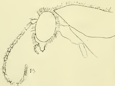
Fig. 1. Paryphoconus angustipennis Enderl. ♀. Kopf und Vorderende des Thorax. Vergr. 25: 1.

♀. Kopf glänzend schwarz, unterer Teil des Untergesichtes rostgelb, Mundteile hell rostgelb.