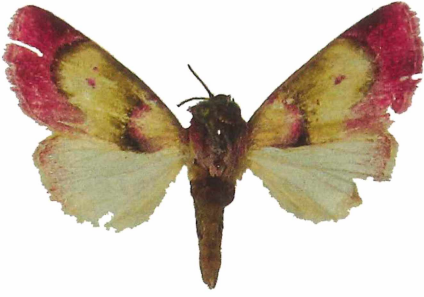
C. colleti HT