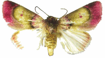
1 C. colleti PT