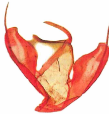
Männchen 4 & 5