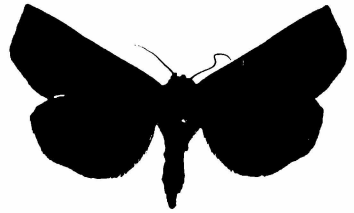
O. cidae Männchen 2