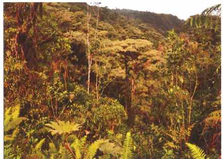
Biotop Bella Vista Lodge