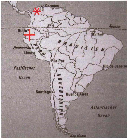
* Typusfundort + Fundorte in Ecuador