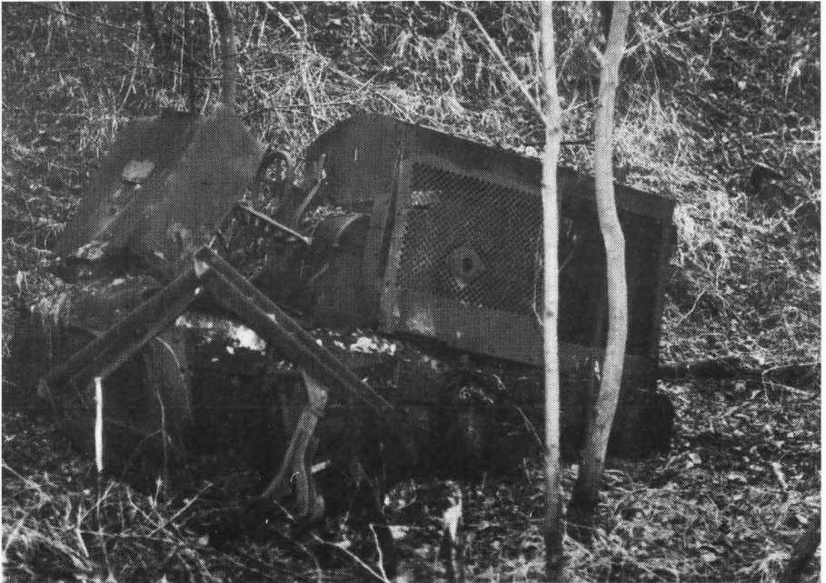
Abb. 2: Fundpunkt 3 von Bacidia inundata (FR.) KOERB. an einem verrosteten Wagen in einem offengelassenen Sandsteinbruch bei Breilfurt

Als ubiquitäre Kosmopoliten kommen Flechten auf fast allen Substraten und in allen Klimabereichen der Erde vor. Trotzdem sind die meisten Arten streng an ein bestimmtes Substrat gebunden (Silikatgestein, Kalkgestein, Baumrinde, Holz, usw.). Nur einige wenige, oft mehr oder weniger nitrophytische Arten, sind relativ substratvage.