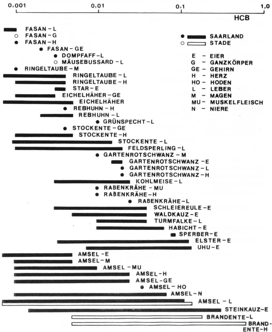
Abb. 2: HCB-Konzentrationen (mg/kg) in verschiedenen Vogelarten des Saarlandes und des Landkreises Stade (Niedersachsen). Endglieder von Nahrungsnetzen: die Eier von Greifvögeln und Arten im Einflußbereich mariner Ökosysteme weisen die höchsten Rückstandswerte auf.