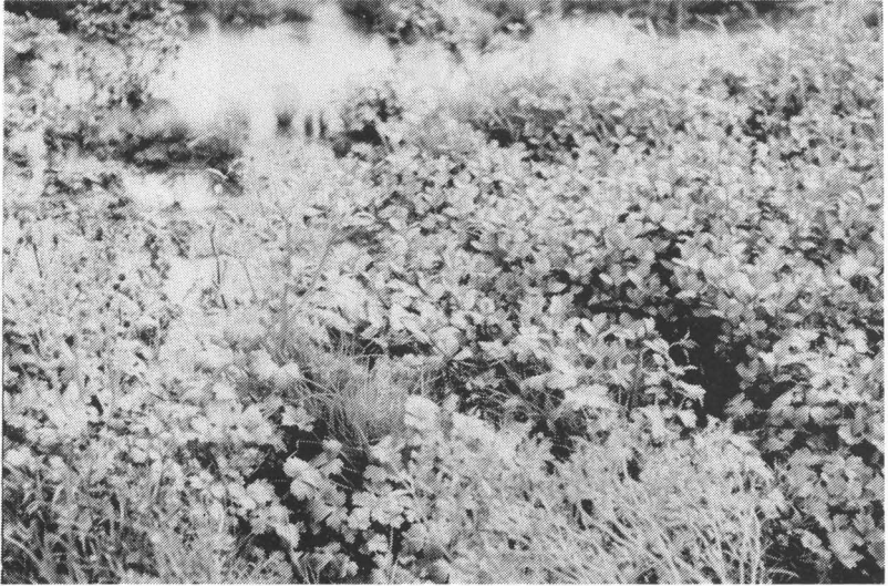
Abb.3: Lebensraum des Gift-Hahnenfußes in der Bliesau in Gesellschaft mit Dreiteiligem Zweizahn und Pfefferknöterich neben einem Bestand der Bachbunze