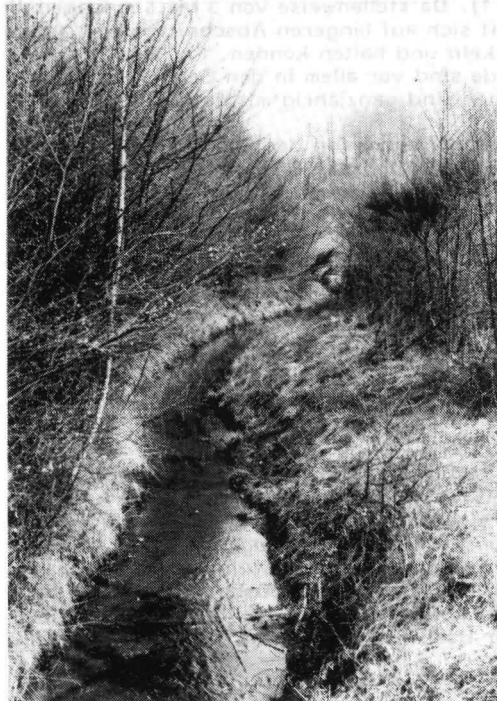
Abb. 3: Bachlauf im Binsental (Frühjahrsaspekt)