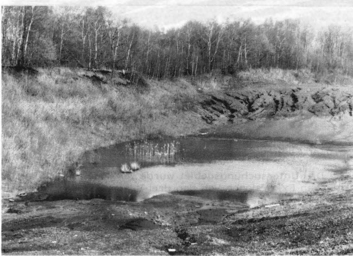
Abb. 4: Kleiner Kohleschlammweiher (Frühjahrsaspekt)

Gewässer Nr. 10: Kleiner Kohleschlammweiher: Wasserfläche 0 bis 1,0 ha, da im Sommer meist trocken fallend. Max. Wassertiefe 50 cm. Anteil der freien Wasserfläche 50 %. In der Ufervegetation sind Phragmites australis , Typha latifolia und Eleocharis palustris dominant. Potamogeton natans bildet eine größere zusammenhängende Schwimmblattzone. In der Umgebung ist Weidengebüsch und lagert vegetationsfreier Kohleschlamm. Stellenweise sind Müllablagerungen vorhanden. Es kommen keine Fische vor (s. Abb. 4).