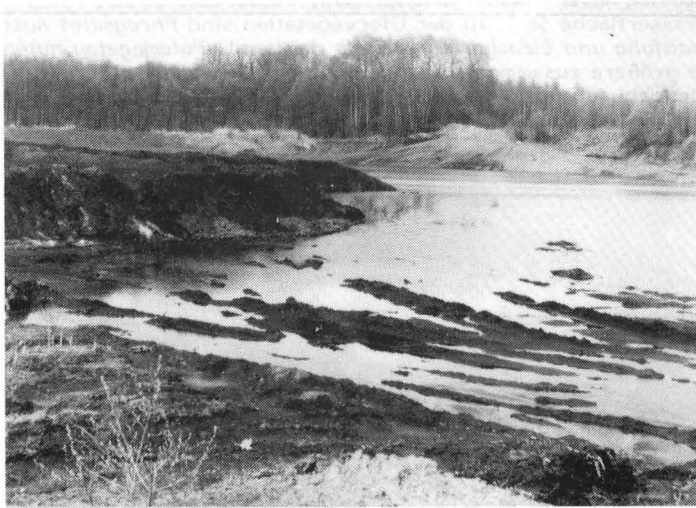
Abb. 5: Großer Kohleschlammweiher (Frühjahrsaspekt)

METHODIK: Das Untersuchungsgebiet wurde von 1982 bis 1986 auf jährlich 4 - 5 halbtägigen Exkursionen von den drei Verfassern und Herrn Uwe Handke besucht. Die Erfassungsmethode richtete sich nach SCHMIDT (1984): Sichtbeobachtung der fortpflanzungsaktiven Imagines bei optimalen Flugbedingungen und in der für die jeweilige Art geeigneten Flugzeit. Ergänzt wurden die Beobachtungen durch Registrierung frisch geschlüpfter oder schlüpfender Tiere und extensive Aufsammlung von Exuvien. Die Exuvien wurden nach CARCHINI (1983) bestimmt. Von folgenden seltenen Arten wurden Belegfotos angefertigt: Lestes dryas , Lestes virens , Ischnura pumilio , Coenagrion mercuriale , Libellula fulva , Orthetrum coerulescens und Sympetrum flaveolum . Arten, die nicht sicher mit dem Fernglas bestimmt werden konnten, wurden mit einem Insektennetz gefangen, nach BOYE et al. (1984) bestimmt und anschließend wieder freigelassen. Die Abundanzklassen (vgl. Tab. 1) richten sich nach SCHMIDT (1964).