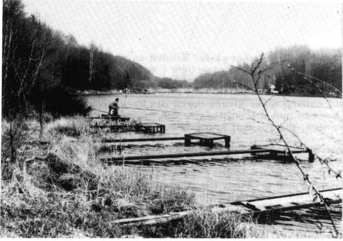
Abb. 2: Angelweiher "In der Geisheck" (Frühjahrsaspekt)