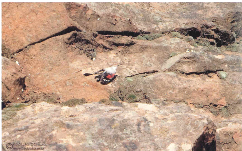
Abb. 4: Mauerläufer ( Tichodroma muraria ). Bad Dürkheim (Steinbruch hinter dem Pfalzmuseum), 22. Februar 2010.