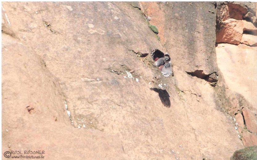
Abb. 3: Mauerläufer ( Tichodroma muraria ) im Flug, Unterseite. Bad Dürkheim (Steinbruch hinter dem Pfalzmuseum), 22. Februar 2010.