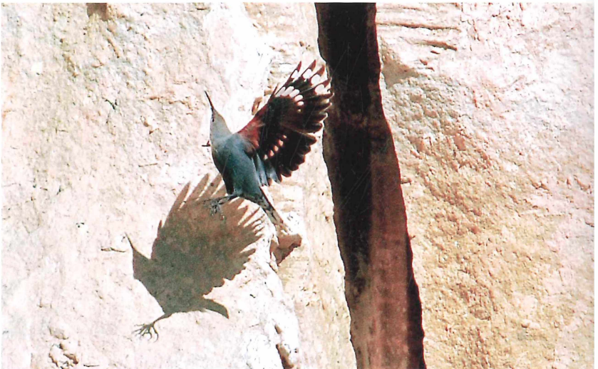
Abb. 9: Mauerläufer ( Tichodroma muraria ). Neustadt/Weinstraße (Gimmeldingen), 23.-26. Oktober 2009.