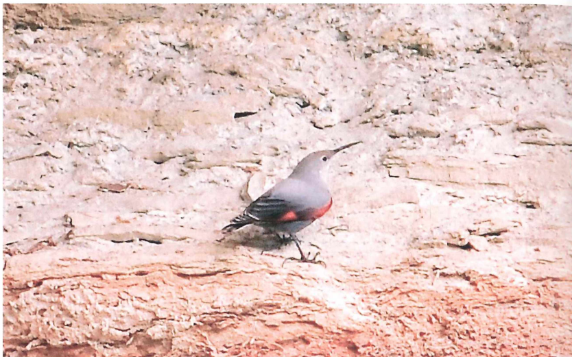
Abb. 10: Mauerläufer ( Tichodroma muraria ). Neustadt/Weinstraße (Gimmeldingen), 23.-26. Oktober 2009.