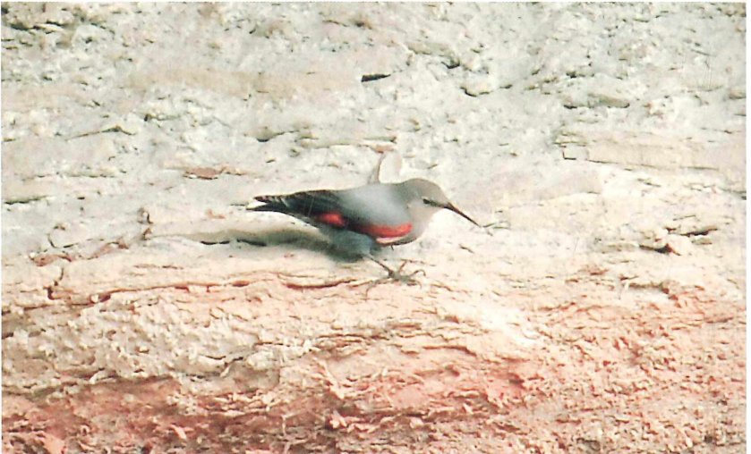
Abb. 7: Mauerläufer ( Tichodroma muraria ). Neustadt/Weinstraße (Gimmeldingen), 23.-26. Oktober 2009.