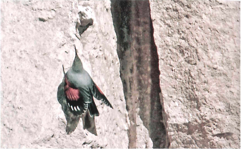
Abb. 8: Mauerläufer ( Tichodroma muraria ). Neustadt/Weinstraße (Gimmeldingen), 23.-26. Oktober 2009.