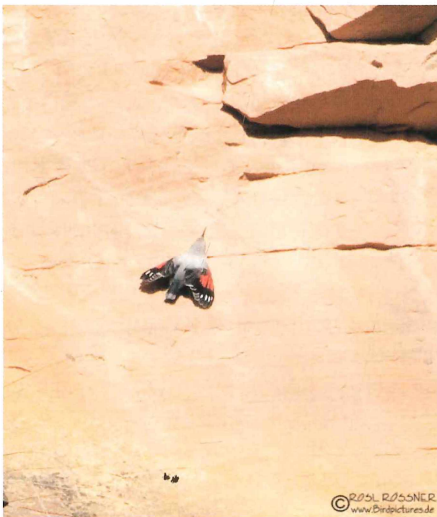
Abb. 2: Mauerläufer ( Tichodroma muraria ). Bad Dürkheim (Steinbruch hinter dem Pfalzmuseum), 22. Februar 2010.