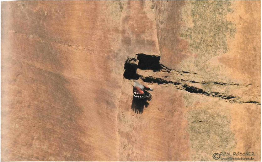
Abb. 1: Mauerläufer ( Tichodroma muraria ), Oberseite. Bad Dürkheim (Steinbruch hinter dem Pfalzmuseum), 22. Februar 2010.