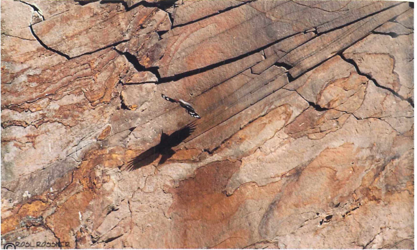
Abb. 6: Mauerläufer ( Tichodroma muraria ) vor der großartigen Kulisse des Sandsteinbruchs, Seitenansicht mit grandiosem Schatten. Bad Dürkheim (Steinbruch hinter dem Pfalz-museum), 22. Februar 2010.