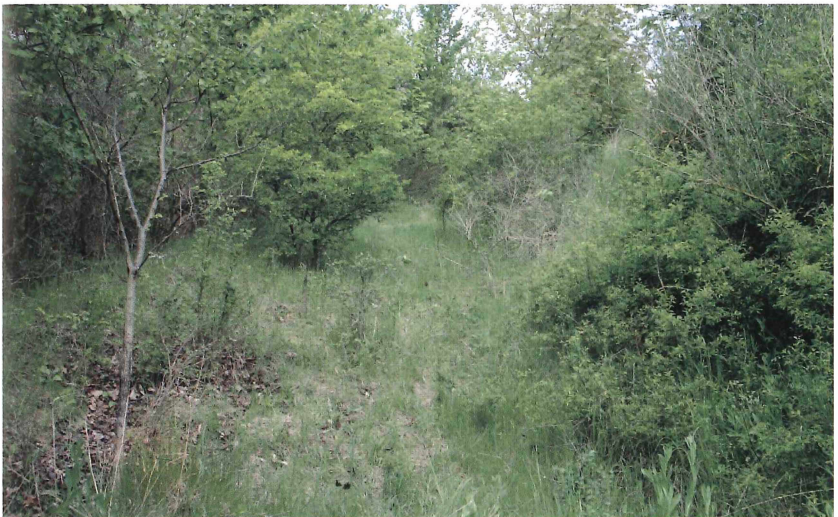
Abb. 2: Hohlweg zum Grubengelände mit lichtem Bewuchs. Lebensraum von Erax barbarus (SCOP.). Hier flogen zwei der beobachteten Exemplare.