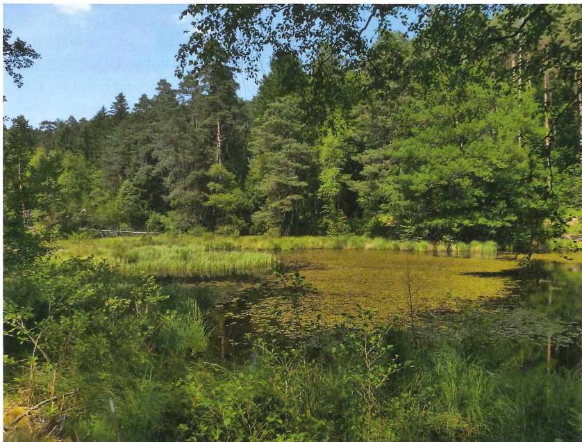
Abb. 2: Der obere Erlentalweiher mit ausgeprägter Wasservegetation und von Wald umgeben. 16. Juli 2013.

Bundesweit ist die Östliche Moosjungfer bisher als „vom Aussterben bedroht“ eingestuft (OTT & PIPER 1988), die neue Rote Liste stuft sie jedoch auf „stark gefährdet“ herab, da sie offensichtlich eine unter bundesweiten Aspekten positive Bestandsentwicklung zeigt (OTT et al. in prep.). Die Art ist auf der FFH-Liste als Anhang-IV-Art gelistet (streng zu schützende Tier- und Pflanzenarten von gemeinschaftlichem Interesse, siehe: SSYMACK et al. 1998) und gilt neben dem Bundesnaturschutzgesetz auch nach der Berner Konvention als „streng geschützt“. Für Europa führen sie KALKMAN et al.