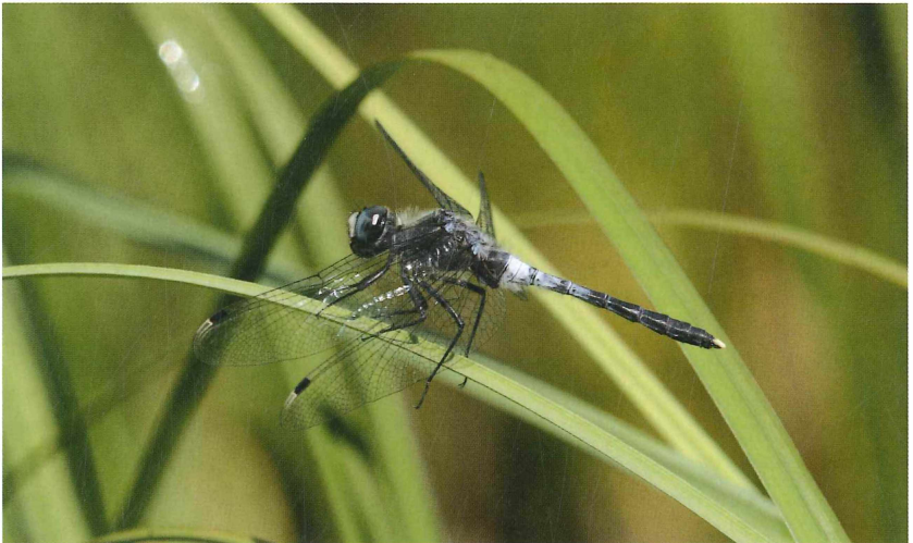
Abb. 1: Leucorrhinia albifrons -♂ – die weiße Stirn, die schwarzen Flügelmale und die weißen Cerci an dem nicht keulig verbreiterten Hinterleib sind unverwechselbare Kennzeichen der Art. 16. Juli 2013.