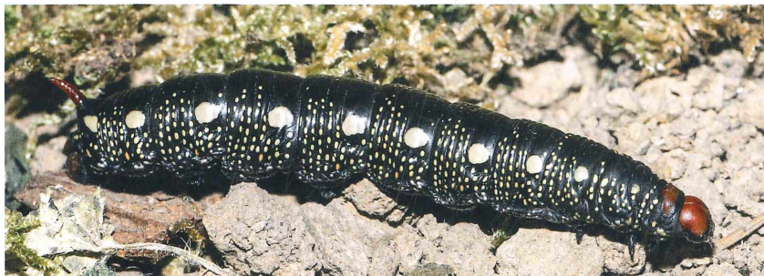
Abb. 3: Raupe des Labkrautschwärmers ( Hyles galii ) vom Fundort Cramberg (Umg. Gabelstein) unmittelbar vor der Verpuppung, 22. Oktober 2013.