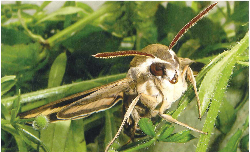
Abb. 5: Labkrautschwärmer ( Hyles galii ), Porträt. Nassau, 30. Mai 2014.