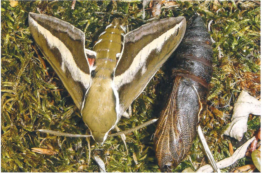
Abb. 4: Puppe (rechts) und daraus geschlüpfte Imago des Labkrautschwärmers ( Hyles galii ). Nassau, 30. Mai 2014.