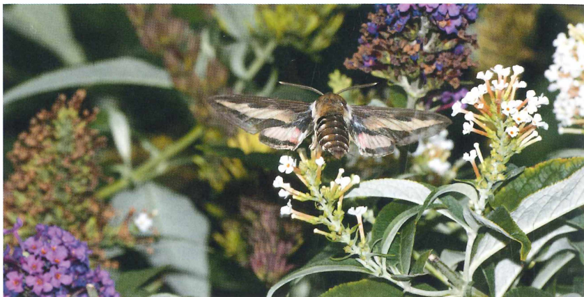
Abb. 2: Labkrautschwärmer ( Hyles galii ) im Flug über Schmetterlingsflieder ( Buddleja ). Nassau, 23. September 2013.