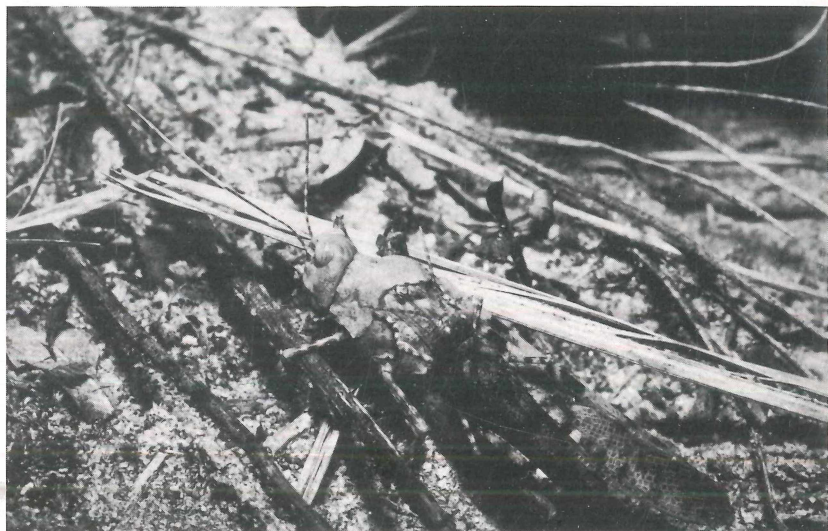
Abb. 2: Blauflügelige Sandschrecke ( Sphingonotus caerulans ) bei der Kopulation. Männchen deutlich kleiner als Weibchen.

Tiere auf Sand festgestellt; häufig wurden sie, teilweise bis zu 20 Exemplare, in der Nähe oder direkt auf Kieshaufen beobachtet.