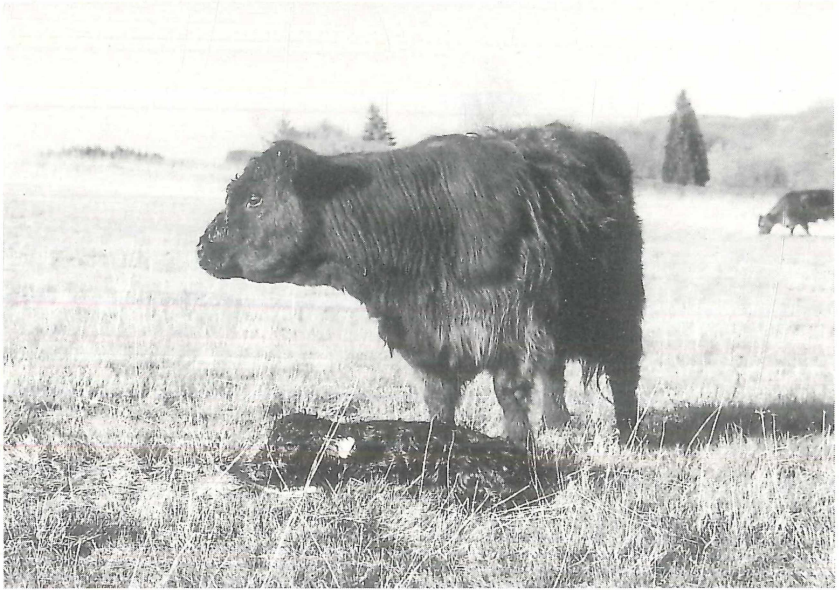
Abb. 3: Mutterkuh der Rasse Galloway mit neugeborenem Kalb. Sommer 1997.

Da für die Robustrinder keine Winterstallungen notwendig sind und auf den gepachteten Flächen ein Gebäude zur Unterbringung von Maschinen und Werkzeugen vorhanden war, beschränken sich die Kosten diesbezüglich auf kleinere Umbaumaßnahmen, die selbst getätigt werden konnten. Ein mit einfachen Mitteln aufgebaute Heuschober, der auf einer Winterweide als Futterstelle fungiert und den Tieren theoretisch als Unterstand dienen könnte, wird selbst an kalten Wintertagen nur sporadisch genutzt. Das als Rundballen gepreßte Winterfutter stammt ausschließlich von betriebseigenen Flächen aus eigener Heuwerbung. Zur Ermittlung der Winterfutterkosten wurde der Einfachheit halber der derzeitige Heupreis zugrundegelegt.