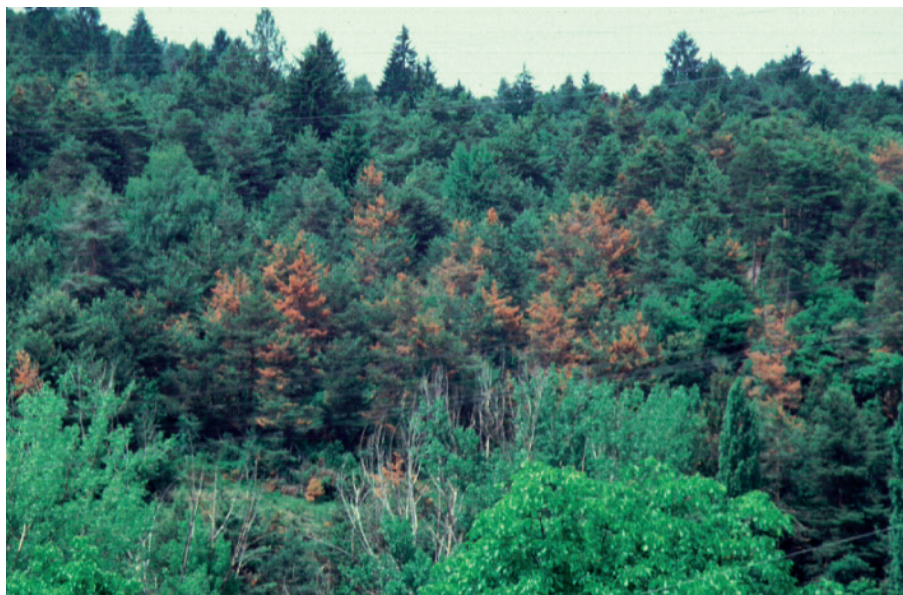
Pineta attaccata da Cenangium ferruginosum e Sphaeropsis sapinea in località Prissiano (BZ), 1998.