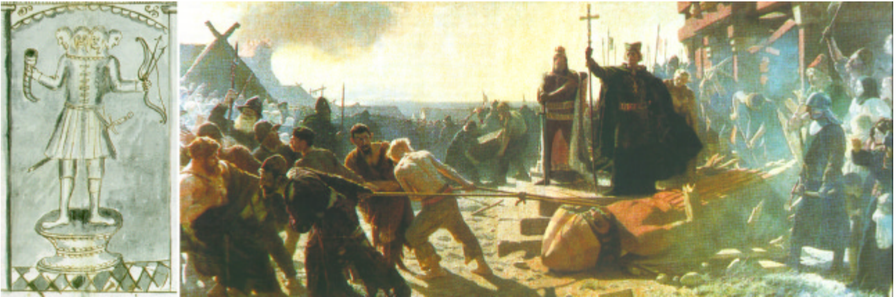
Abb. 3 Swantewit, die viergesichtige Gottheit der slawischen Ranen, der Urbevölkerung von Rügen. Im Jahr 1168 eroberten die Dänen unter Waldemar dem Großen und Bischof Absalon von Roskilde die Tempelburg der slawischen Ranen auf Kap Arkona und vernichteten die Statue von Swantewit. Links, aus einer Handschrift von 1670, rechts Gemälde von Laurits Tuxen (1853-1927).

Fig. 3 Swantewit the four-faced godnes of the Ranen, the indigenous slavic tribe of Rügen, was adored and celebrated in a temple located on Cape Arkona. The temple was destroyed in 1168 by the king of Denmark, Waldemar the Great, and his bishop Absalon of Roskilde. Left, a drawing from a manuscript of 1670, right, painting of Laurits Tuxen (1853-1927).