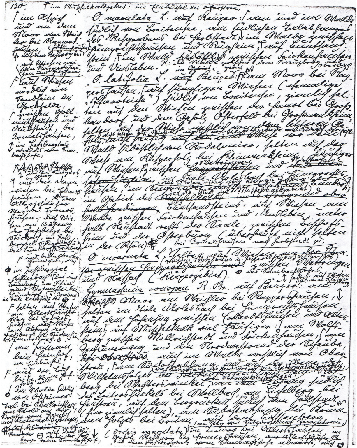
Abb. 5 Ernst Koch, Beispielseite aus dem Manuskript „Neue Fundorte von Pflanzen“ Fig. 5 Ernst Koch, sample page of his manuscript: “New Locations of Plants”