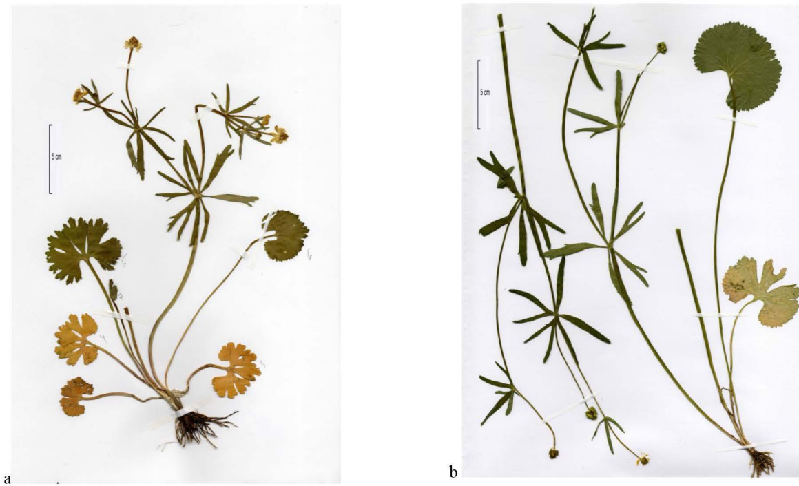
Abb. 4 Herbarbelege der Typuslokalität Du-10841-12 (a) und Du-30415-2 (b) Fig. 4 Specimen of the type locality Du-10841-12 (a) und Du-30415-2(b)