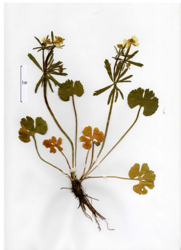
Abb.3 Herbarbeleg der Typuslokalität Du-10841-13 Fig. 3 Specimen of the type locality Du-10841-13

Im Gegensatz zur verbreiteten Meinung und der Auffassung Walo Kochs – „die Art scheint in Mitteleuropa weit verbreitet zu sein“ (Koch 1933: 745) – handelt es sich