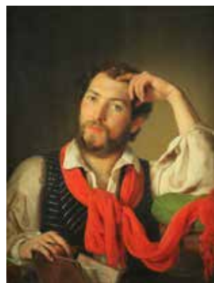
ABB. 50: Johann Baptist Reiter (*1813, †1890), Selbstbildnis mit rotem Schal Öl auf Leinwand, 71 x 55 cm, sign. u. dat. 1842, Inv. Nr. G 341