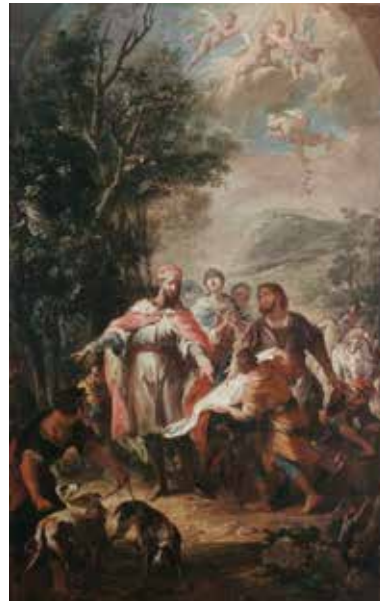
ABB. 49: Martino Altomonte (*1659, †1745), Die Gründung des Stiftes Klosterneuburg Öl auf Leinwand, 127,5 x 87,5 cm, Inv. Nr. G 478 (Legat Löwenfeld, 1901)