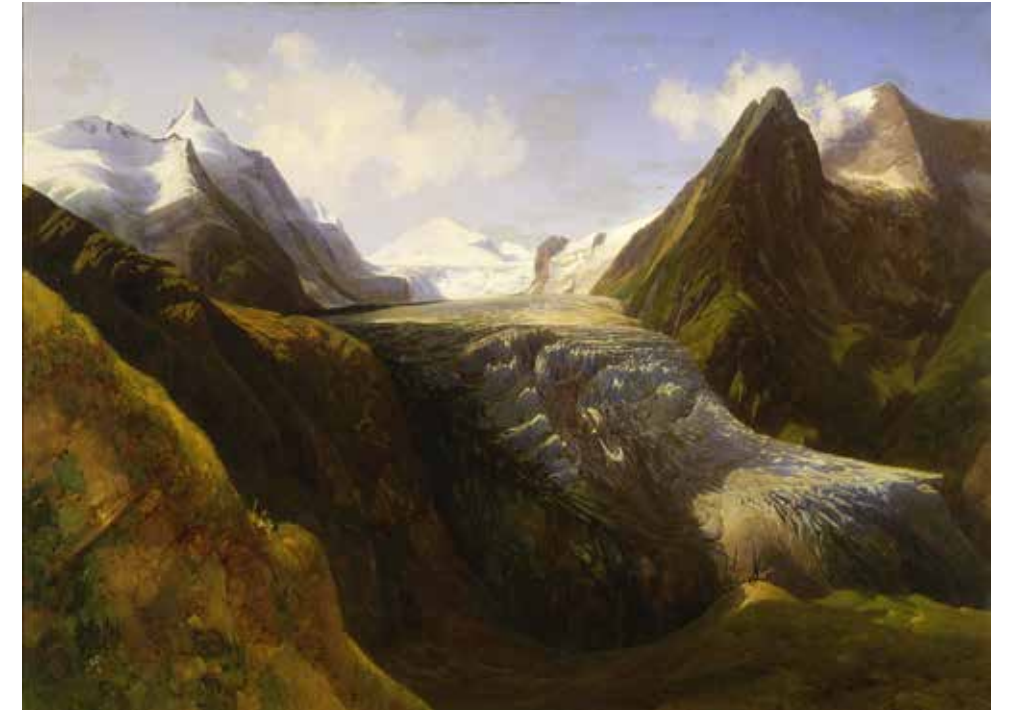
ABB. 51: Thomas Ender (*1793, †1875), Ansicht der oberen und unteren Pasterze mit dem Großglockner und dem Johannisberg bei Heiligenblut Öl auf Leinwand, 93 x 126 cm, sign. u. dat. 1834, Inv. Nr. G 650 (Geschenk Kaiser Franz Josephs, 1875)