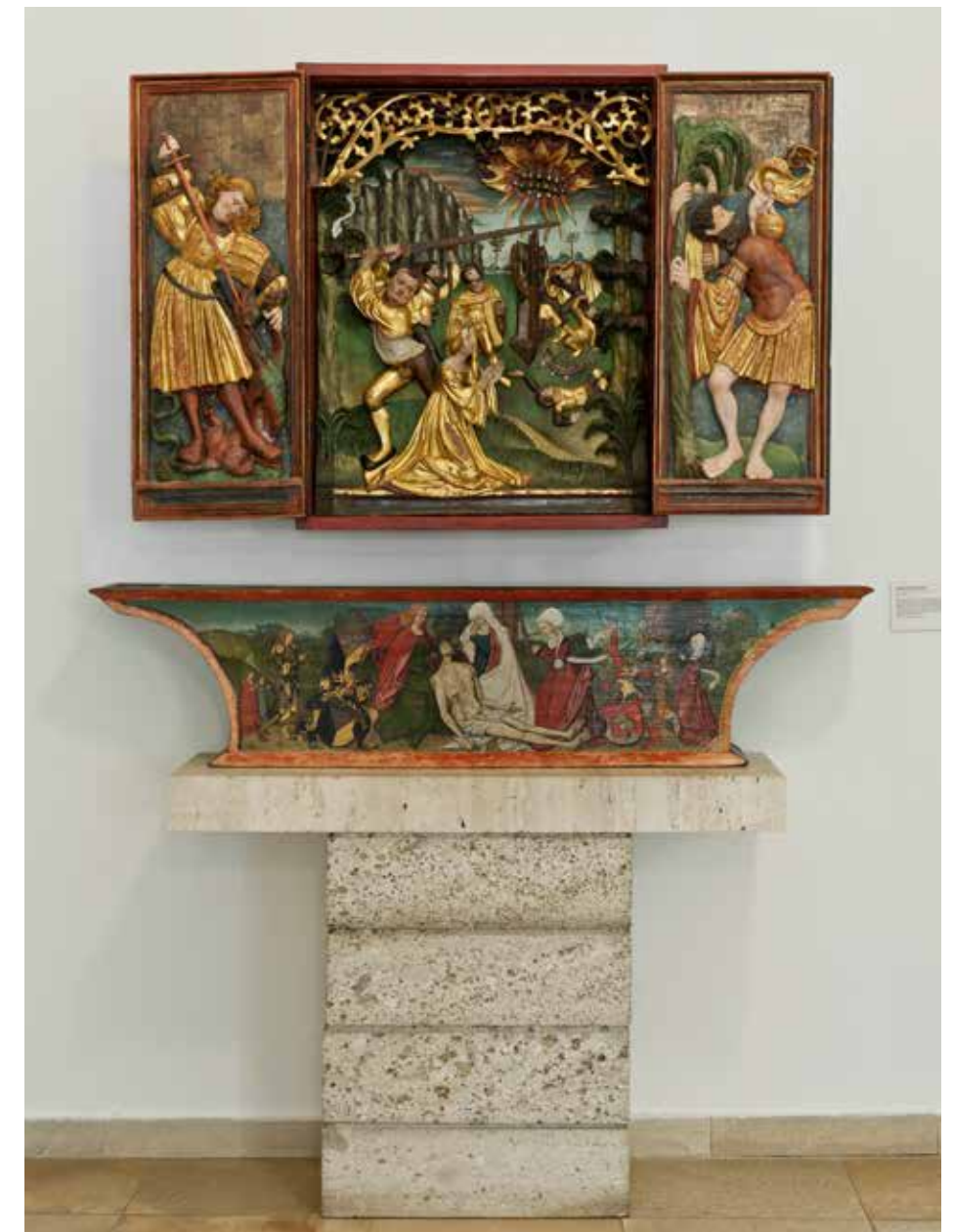
ABB. 48: Katharinenaltärchen, Passau (?), um 1515/20 Holz, Originalfassung, 85 x 67 cm (Schrein), Inv. Nr. S 5 (Geschenk Stift St. Florian, 1835)