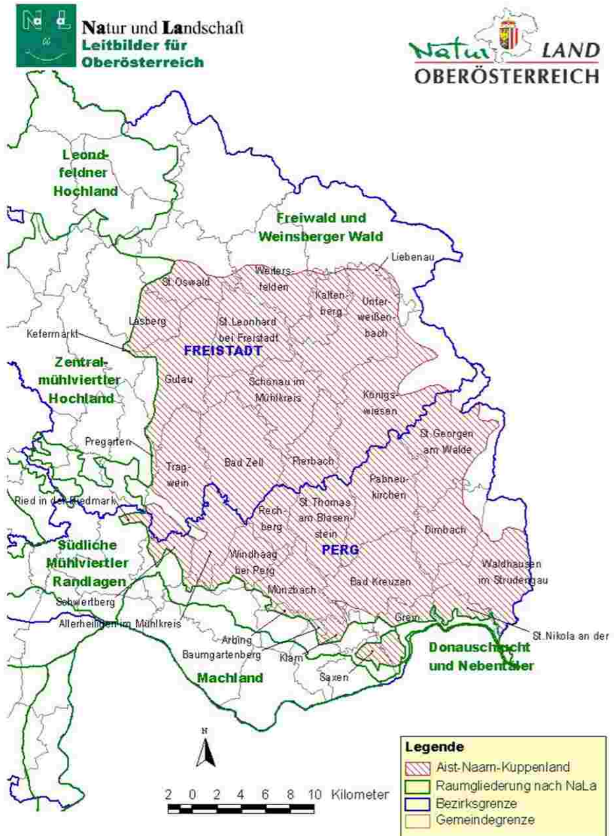
Abb.2: Lage der Raumeinheit „Aist-Naarn-Kuppenland“