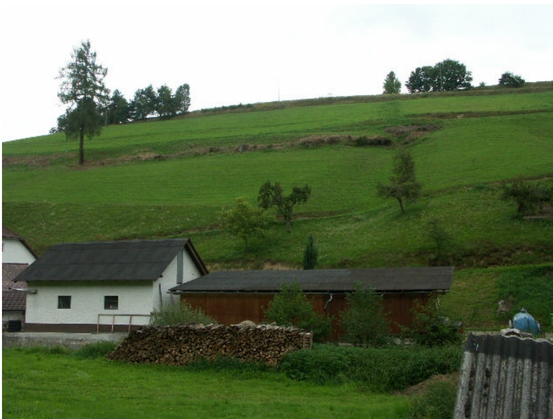
Abb. 15: Mahdgenutzte Steiflächen in Langhalsen (3.9.2006)