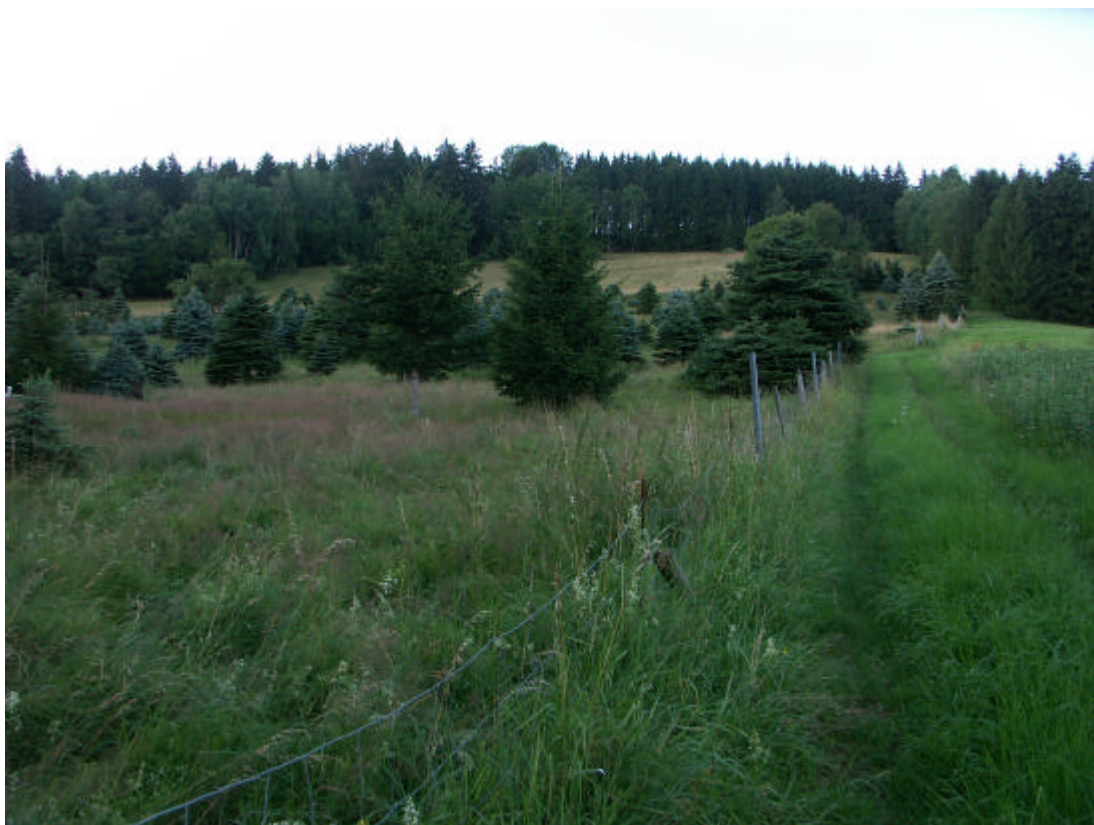
Abb. 12: Magerwiese mit lockerem "Christbaumbestand", Brutplatz des Neuntöters (Weigert, 16. Juli 2006)