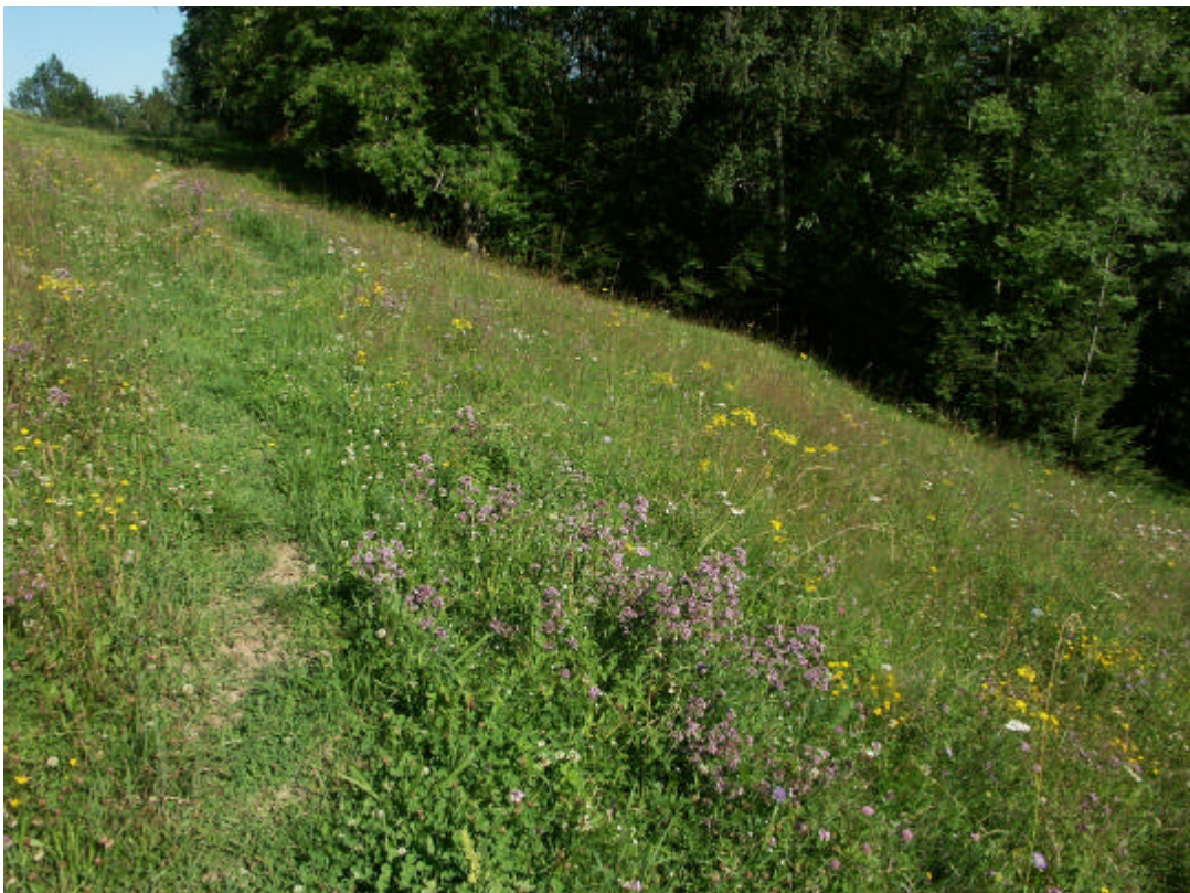
Abb. 8 Jakobs-Greiskraut und Dost bilden einen regional sehr seltenen Vegetationstyp (Schweinzberg, 15. Juli 2006)