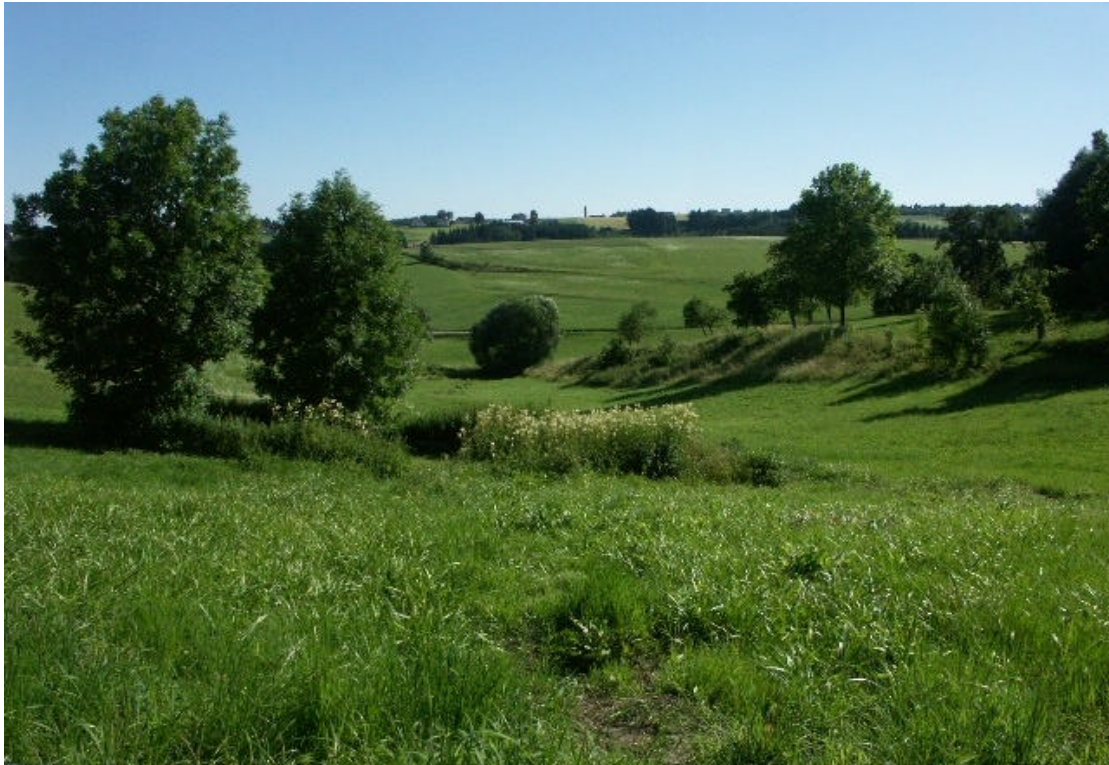
Abb. 1: Reichhaltiger Dorfrand von Unterfeuchtenbach mit Löschteich ("Schwöll"), Böschungsrain und Obstwiesen (15. Juli 2006)