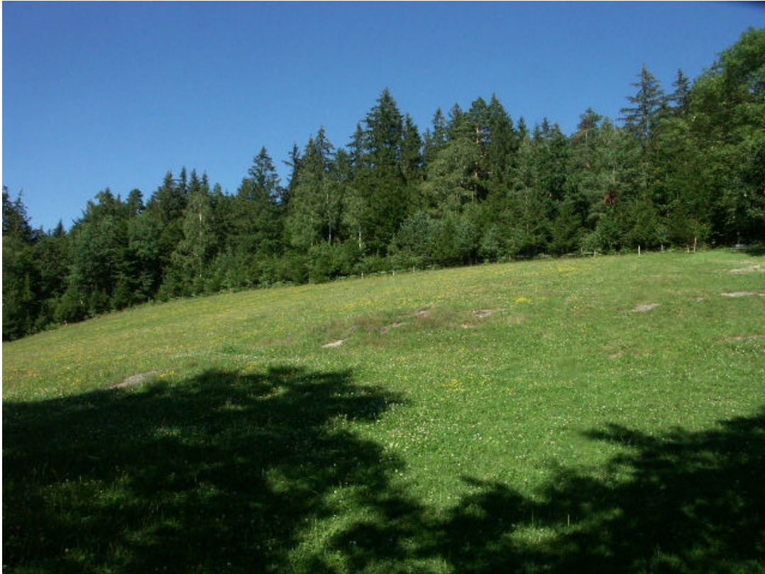
Abb. 7: Steinige Blumenwiese und besonders abwechslungsreich gestufter Waldrand am Schweinzberg (16. Juli 2006)