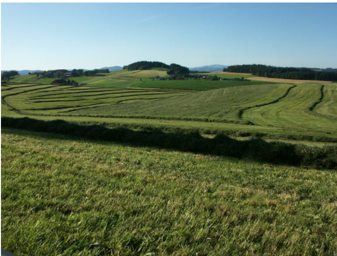
Abb. 10: 2. Silage auf riesiger Wiese in Mairhof (16. Juli 2006)