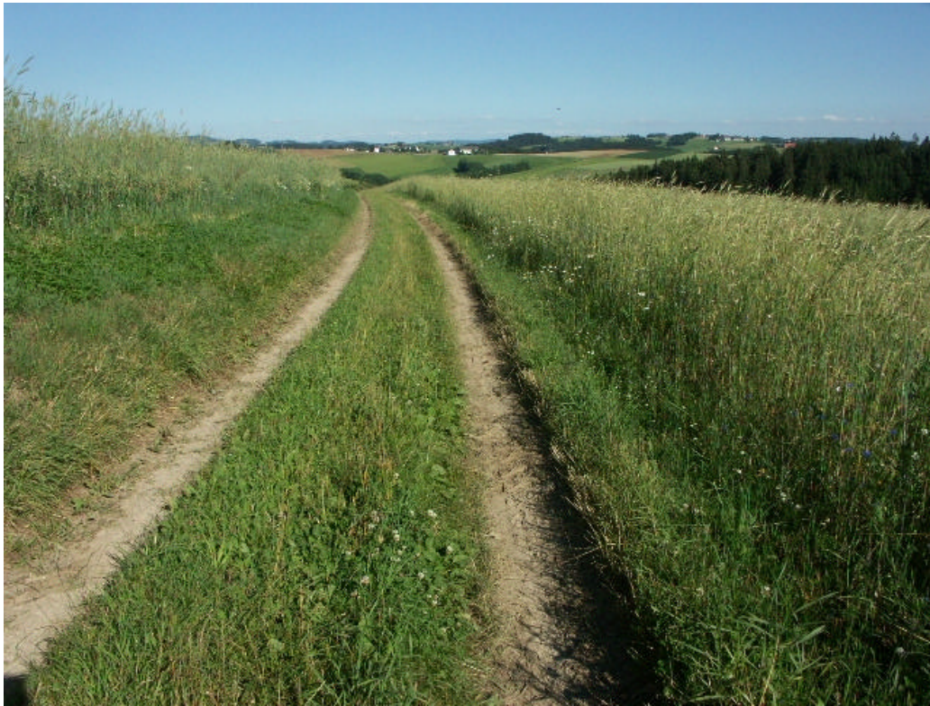
Abb. 3: Feldwege bilden Lichtungen und Bereicherungen der Feldflur, welche für Rebhühner und Hasen von hoher Bedeutung sind (Unterfeuchtenbach, 15. Juli 2006)