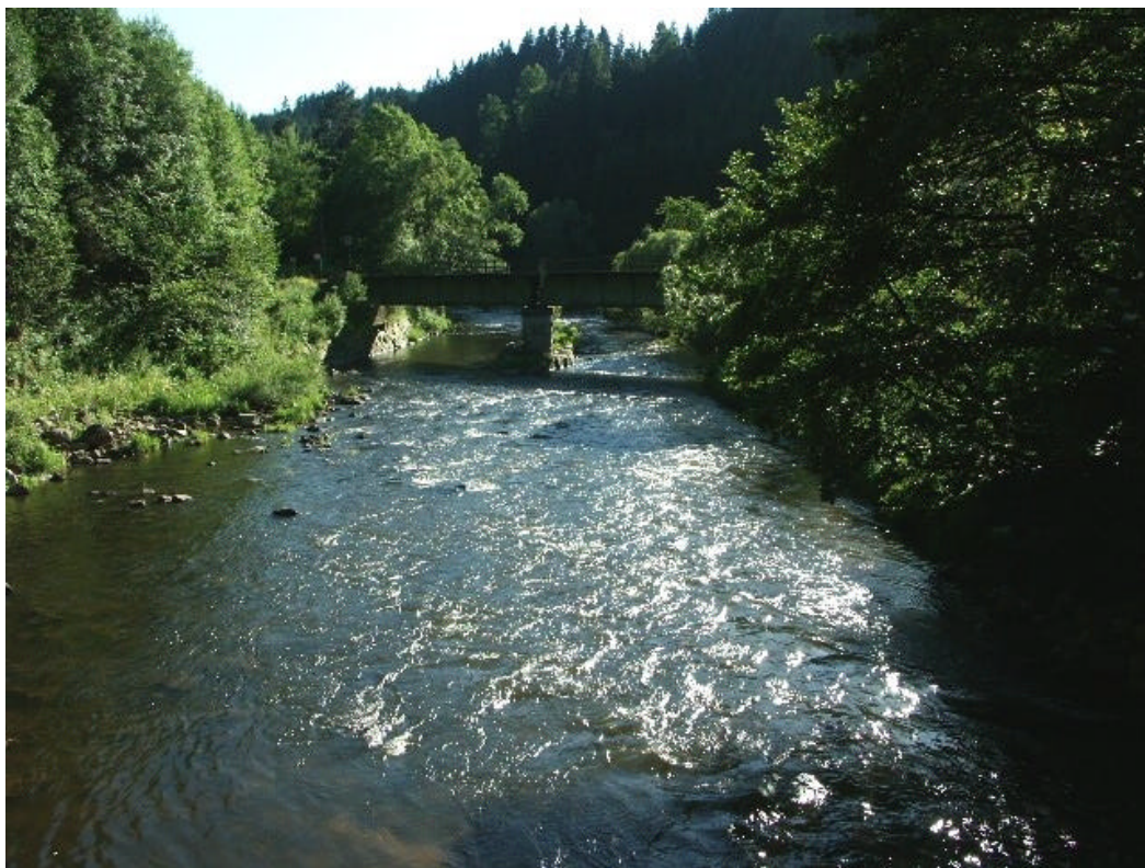
Abb. 4: Große Mühl bei Pürnstein (15. Juli 2006)