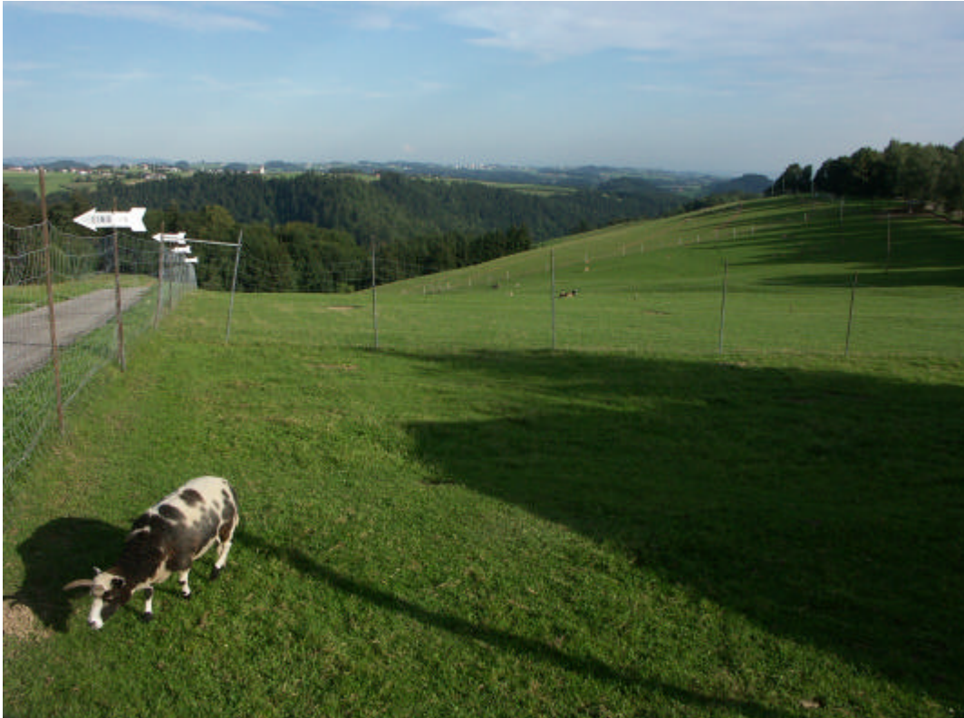
Abb. 13: Wildpark Altenfelden in Atzesberg, Blick zum Tal der Großen Mühl (2.9.2006)