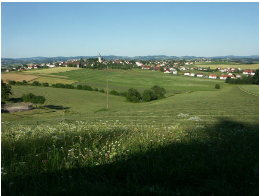
Abb. 11: Blick von Mairhof auf Altenfelden (16. Juli 2006)