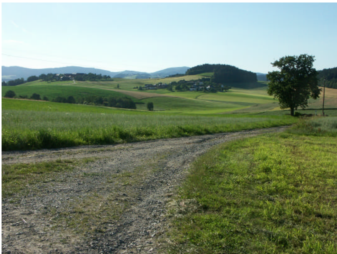
Abb. 9: Wohl der markanteste Flurbaum Altenfeldens; Blick nach Godersdorf und Wollmannsberg (16. Juli 2006)