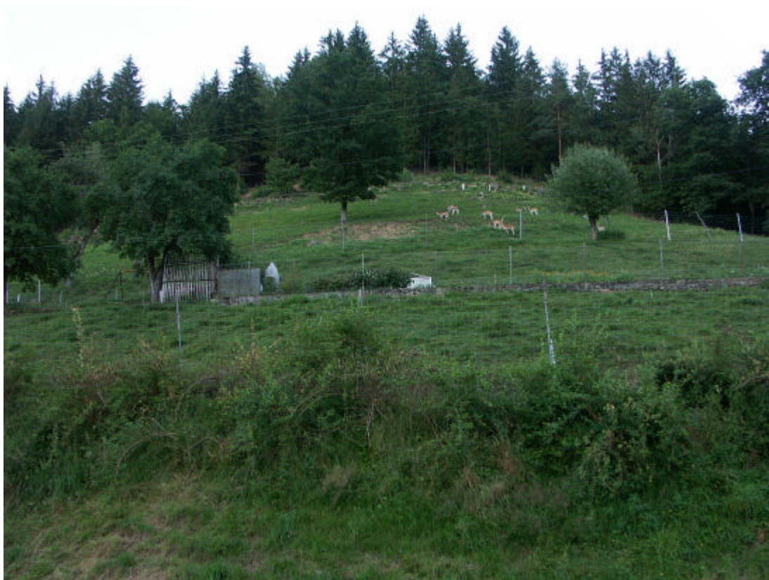
Abb. 6: Mühlthal ober der Kleemühle: Wildgatter (15. Juli 2006)