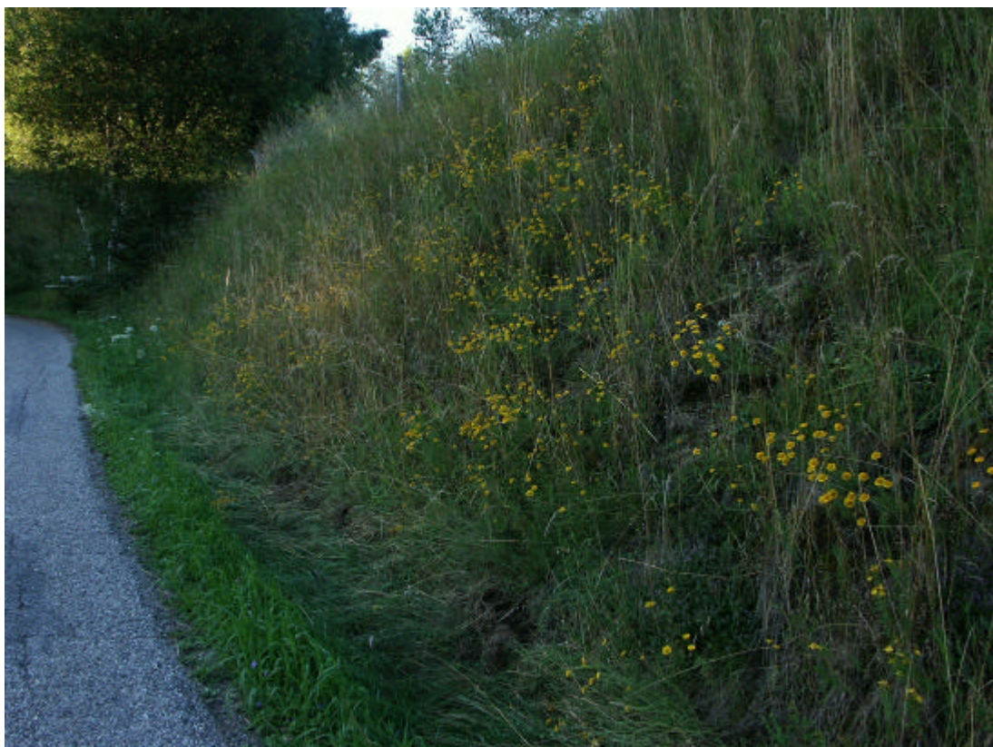
Abb. 5: Wegböschung mit Färber-Hundskamille in Hühnergeschrei (15. Juli 2006)