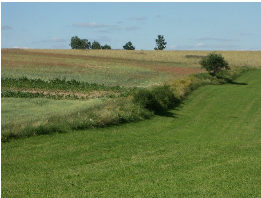
Abb. 2: Relativ magerer und blumenreicher, nicht zu sehr verbuschter, wertvoller Feldrain, bei Unterfeuchtenbach, 15. Juli 2006