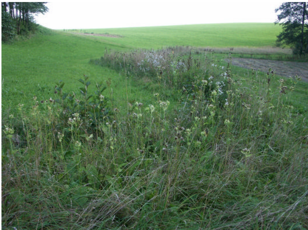
Abb. 14: Sehr naturbelassener Wiesenbach und aufgabegefährdetes Extensivgrünland in Waldrandlage (zwischen Panholz und Blumau, 2.9.2006)