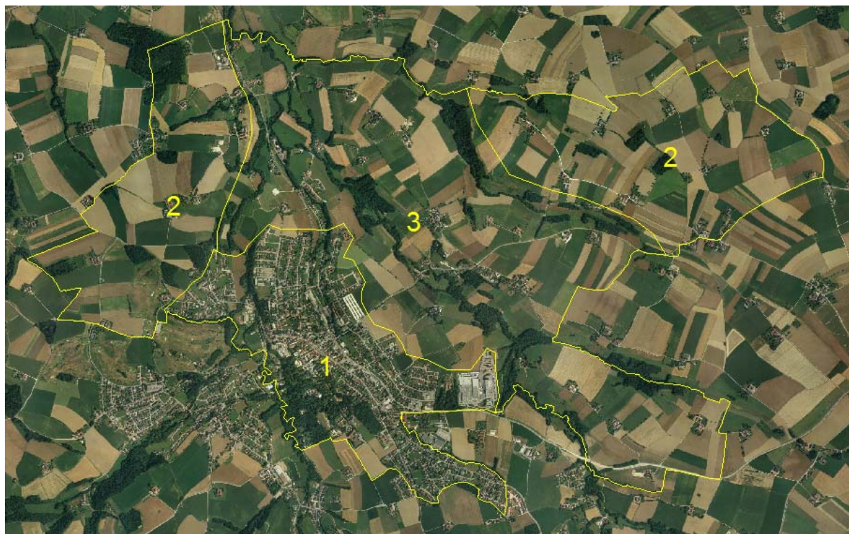
Abb. 2: Übersicht Erhebungsgebiet mit Abgrenzung der Teilgebiete und Orthophotos

Teilgebiet 1: Verdichtetes Siedlungsgebiet