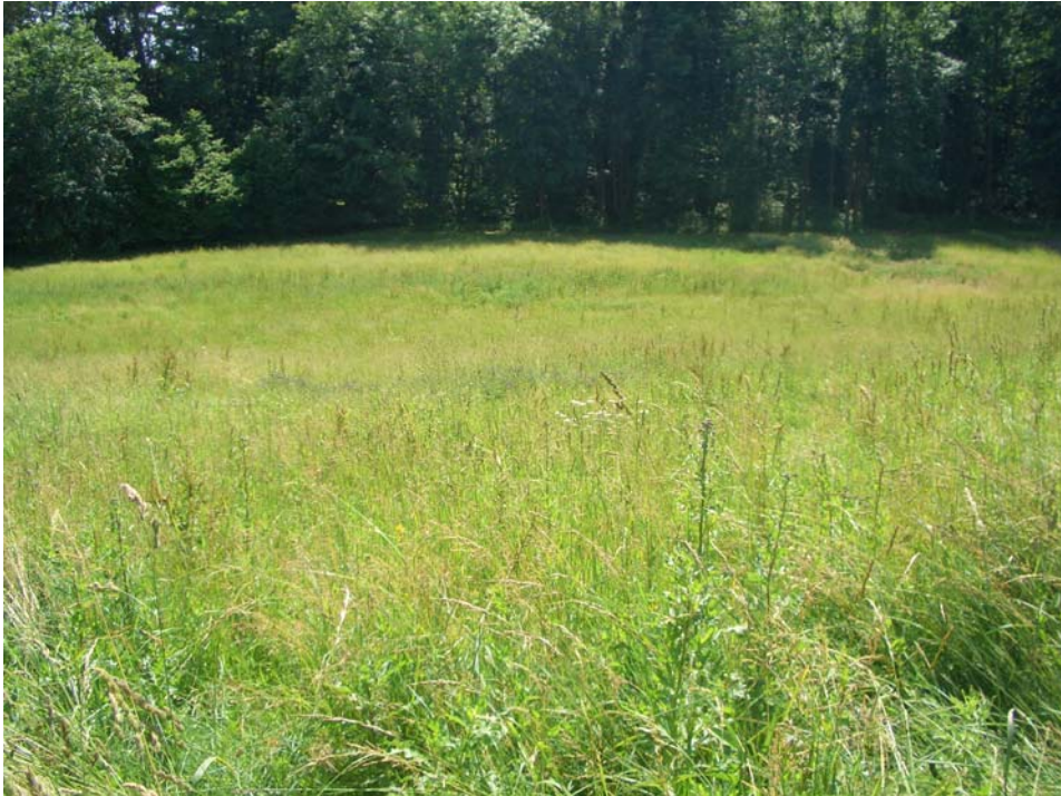
Abb. 13: Mesophile bunte Fettwiese im südl. Gemeindegebiet