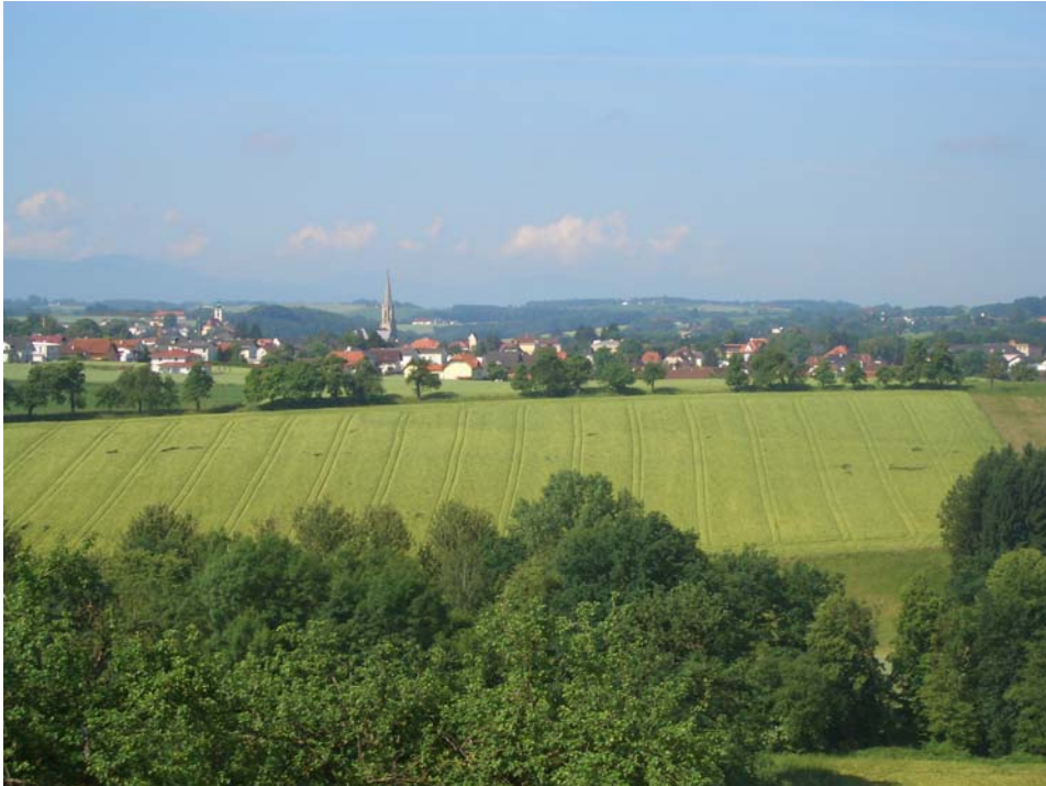
Abb. 3: Blick auf Bad Hall