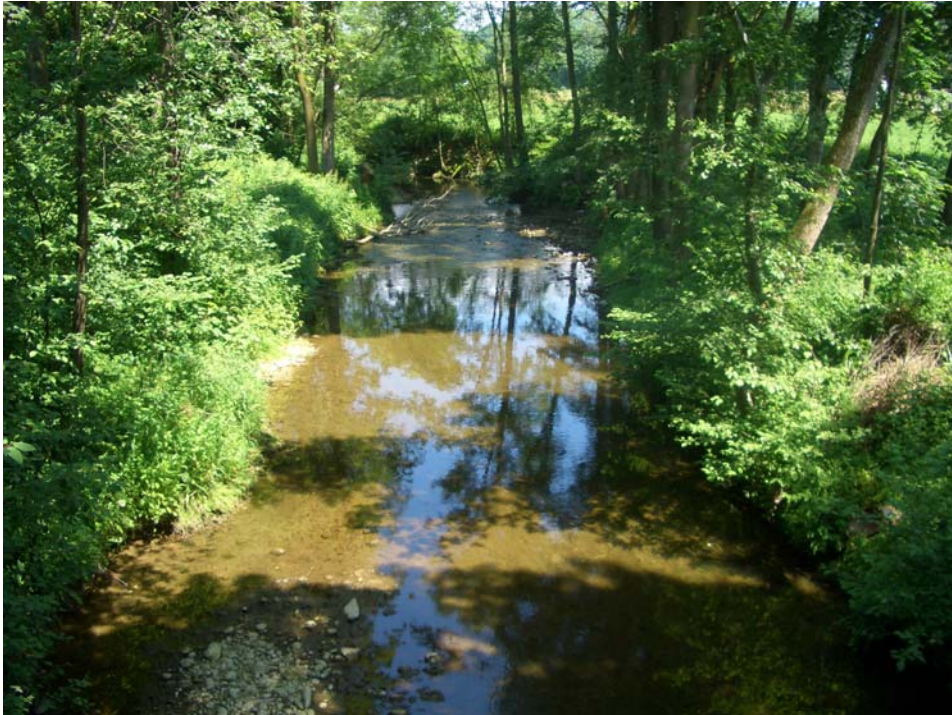
Abb. 11: Abschnitt des Sulzbaches im nördl. Gemeindegebiet