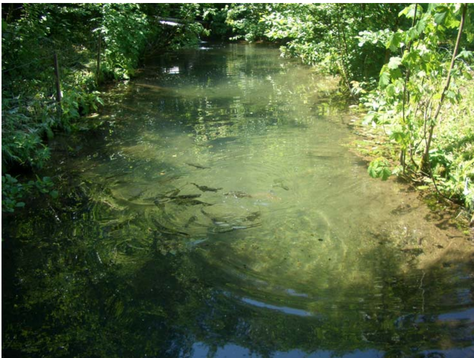
Abb. 12: Forellenzucht bei Hehenberg