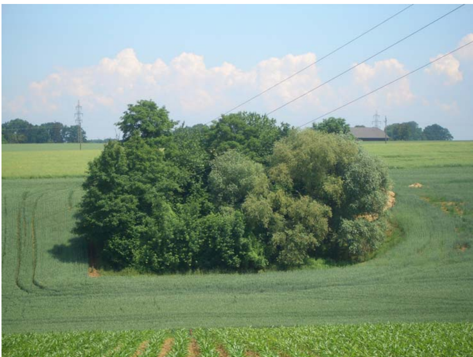
Abb. 6: Feldgehölz im nördlichen Gemeindegebiet