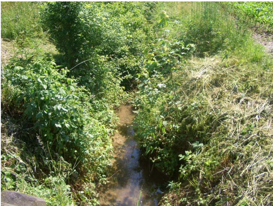
Abb. 4: Abschnitt des Edtbaches