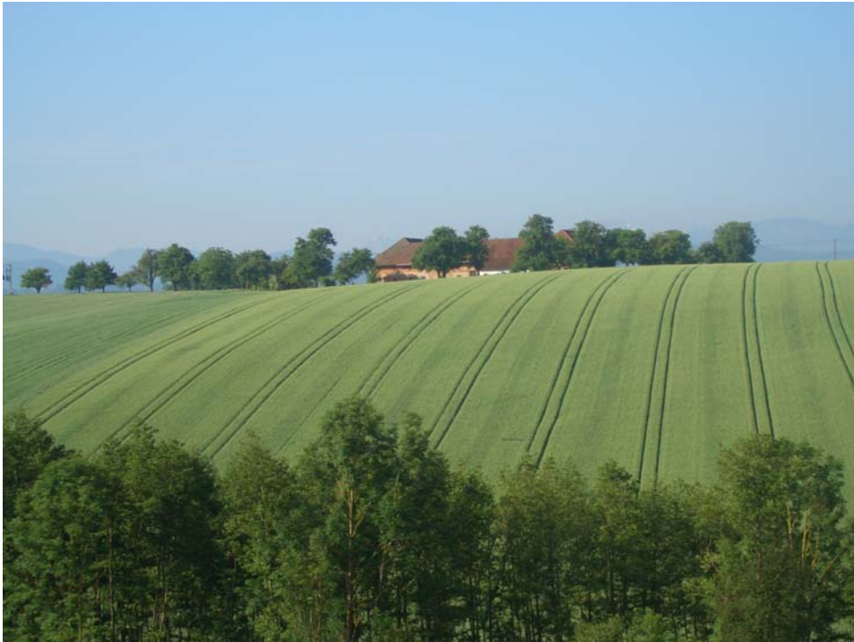
Abb. 1: Blick Bauernhof mit Streuobstwiese