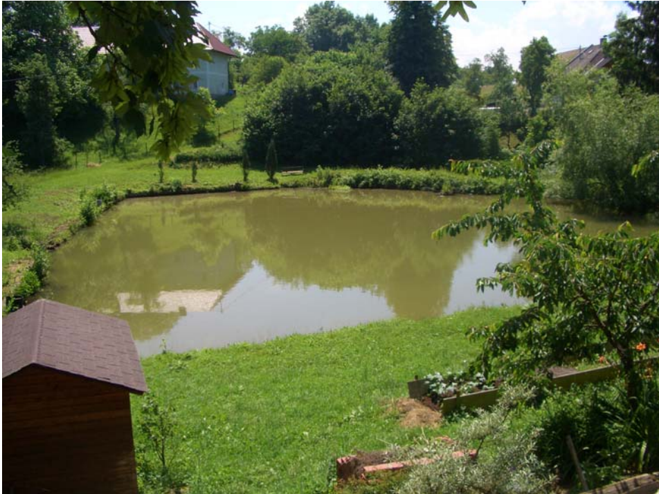
Abb. 9: Fischteich bei Hehenberg