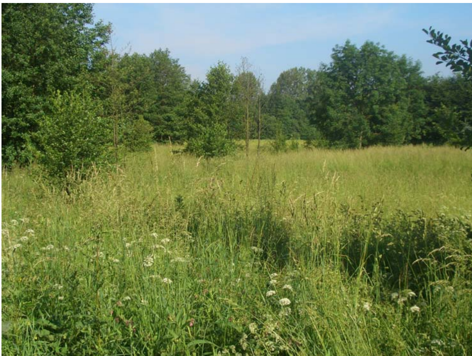
Abb. 2: Sukzession einer Feuchtwiese