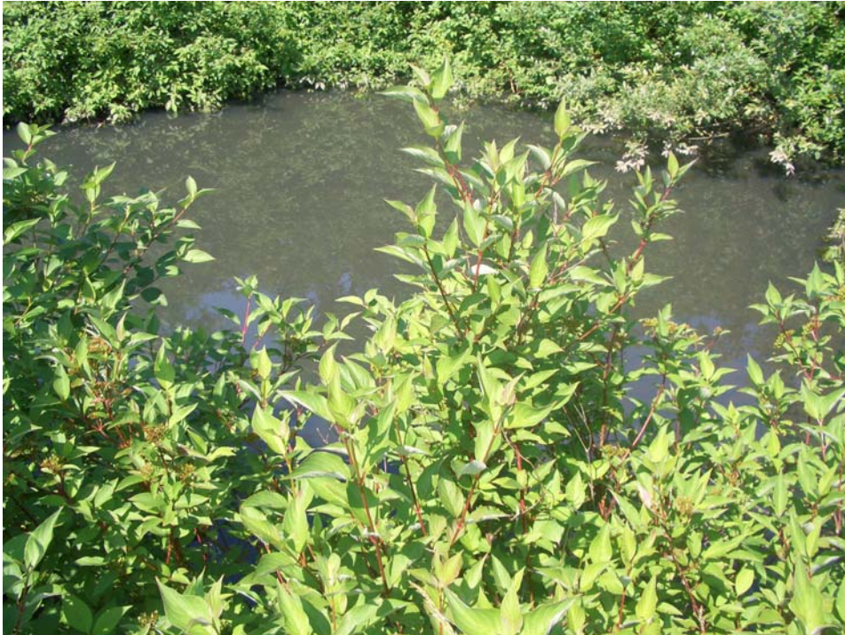
Abb. 5: Fischteich bei Großmengersdorf