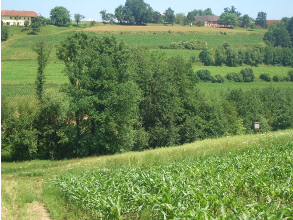
Abb. 7: Ufergehölz des Edtbaches