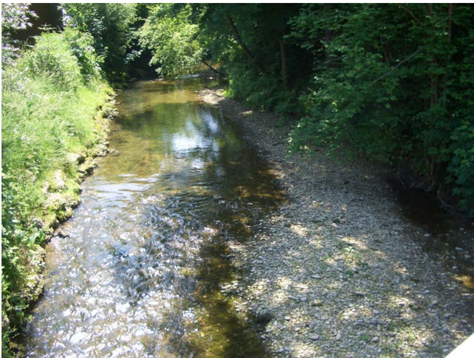
Abb. 8: Abschnitt des Fernbaches im nördl. Gemeindegebiet