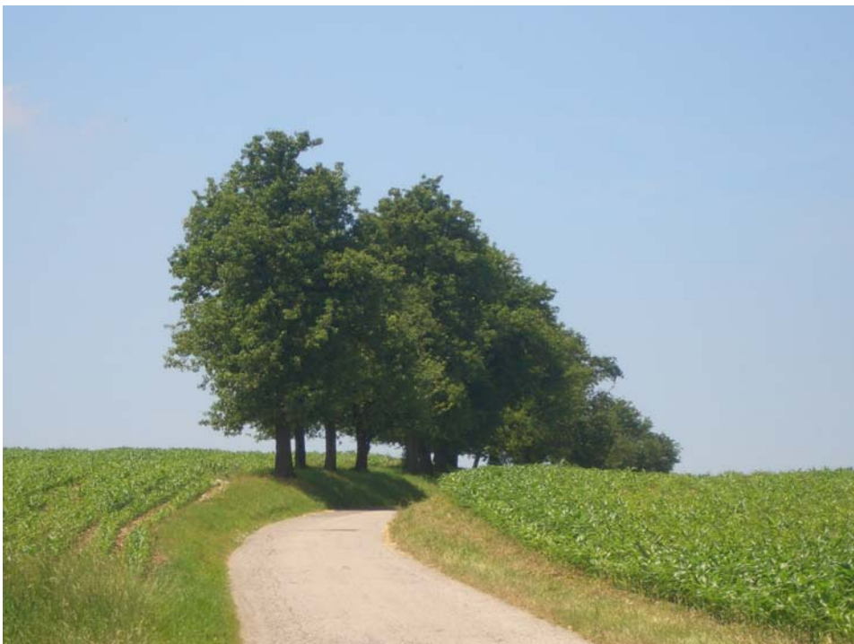
Abb. 10: Obstbaumallee bei Hehenberg