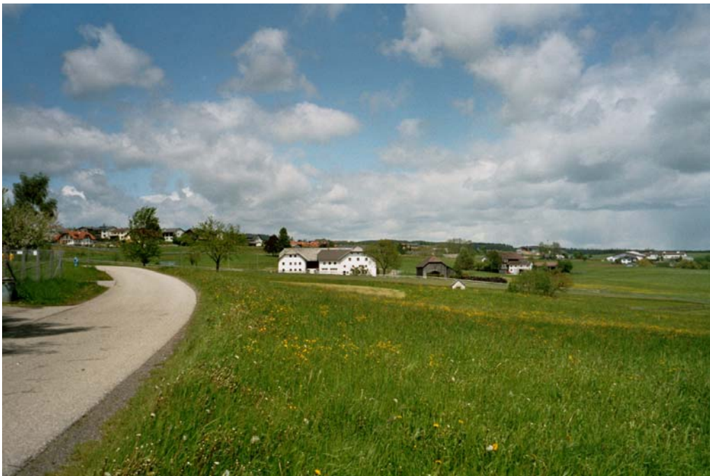
Abbildung 10: Südlicher Rand des zentralen Siedlungsgebietes von Bad Leonfelden mit Übergängen zur Agrarlandschaft.

Zentraler Siedlungsbereich des Gemeindegebietes inklusive der Siedlungsachsen nach Süden mit den Weilern Ober- und Unterstiftung und dem Weiler Unterlaimbach im NW des Teilgebietes. Nur in den Randbereichen des geschlossenen Siedlungsgebietes ist noch landwirtschaftliche Nutzung vorhanden.