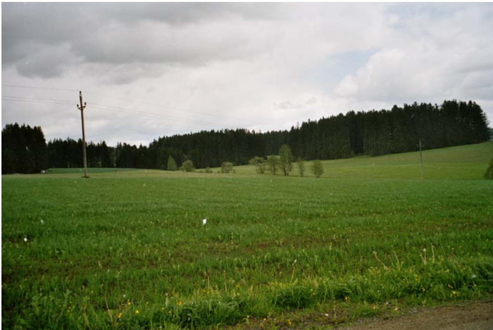
Abbildung 13: Übergangsbereiche zwischen Agrarlandschaft und großflächigem Fichtenforst in der Nähe von Weinzierl

Östlicher Randbereich des Gemeindegebietes zwischen Elmegg im Süden und Staatsgrenze im Norden, einschließlich der Weiler Weinzierl und Rading. Charakteristisch ist die Verzahnung zwischen Fichtenforstparzellen und Wiesen- bzw. Ackerparzellen.