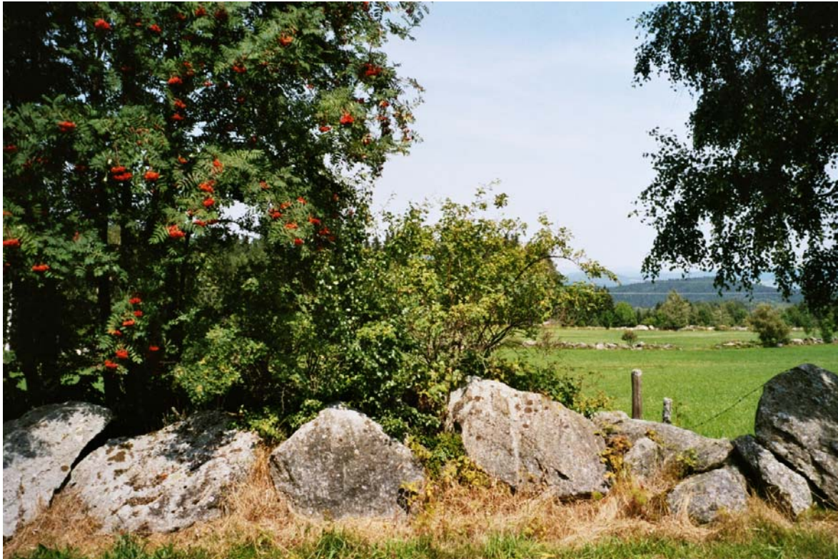
Abb. 18: Kleinteilige Wiesenlandschaft mit zahlreichen Lesesteinwällen westlich von Weigetschlag.