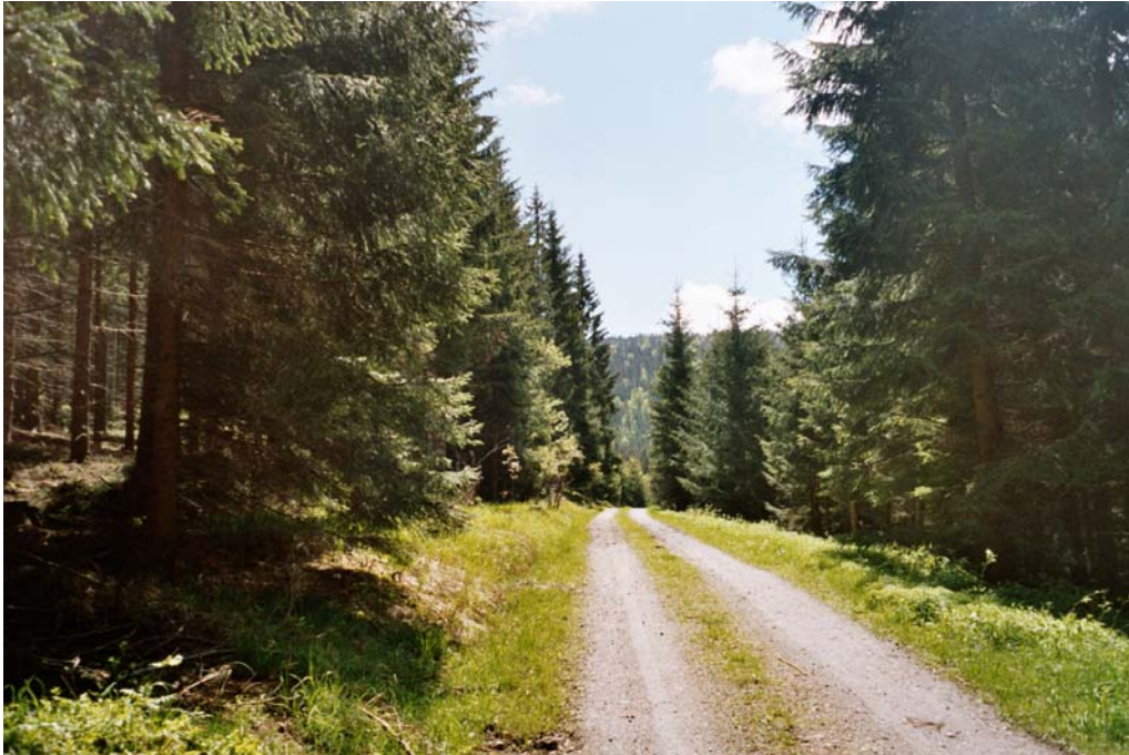
Abbildung 4: Forststraße von Dürnau in das Teilgebiet (Nr.2)