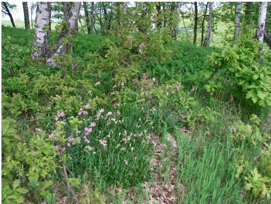
Abb. 17: Typisches Bühel, bei Hundbrenning