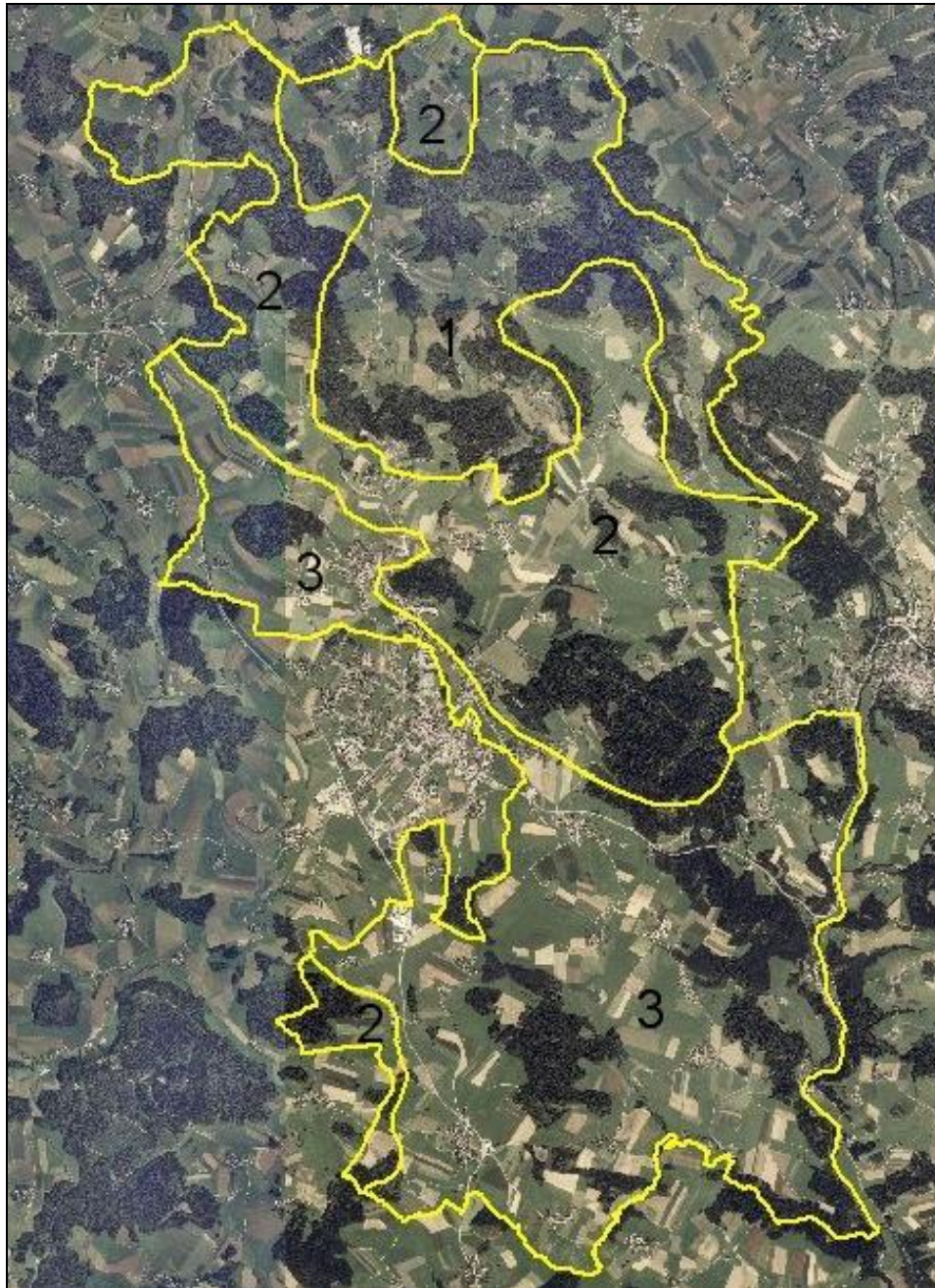
Abb. 2: Übersicht Erhebungsgebiet mit Abgrenzung der Teilgebiete und Orthofotos vom 16.08.2001 und 08.07.2002 (Nordwestteile)