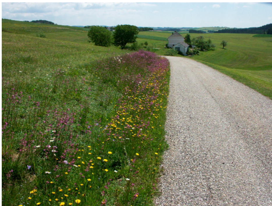
Abb. 2: Blumenreiche Wegböschung südwestlich Gollner