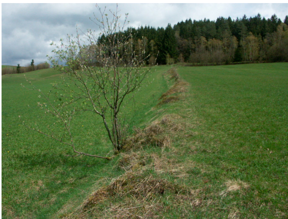
Abb. 3: Magerer Heidelbeerrain bei Rothberg