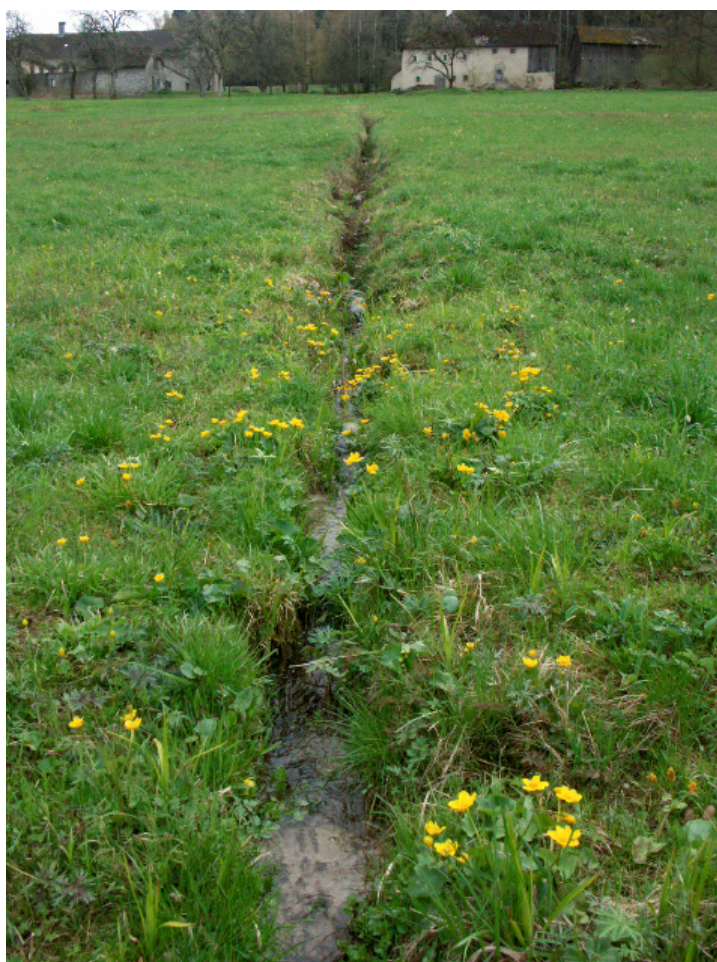
Abb. 9: Uriger Wiesengraben bei Steineck