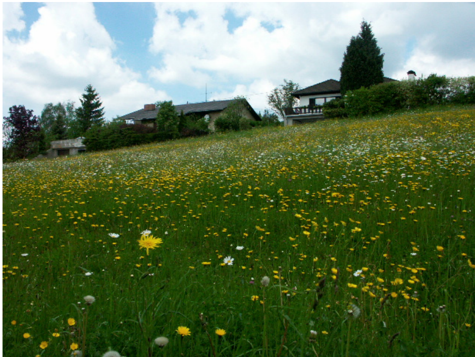
Abb. 16: Blumenreiche Fettwiese im Siedlungsgebiet von Berg