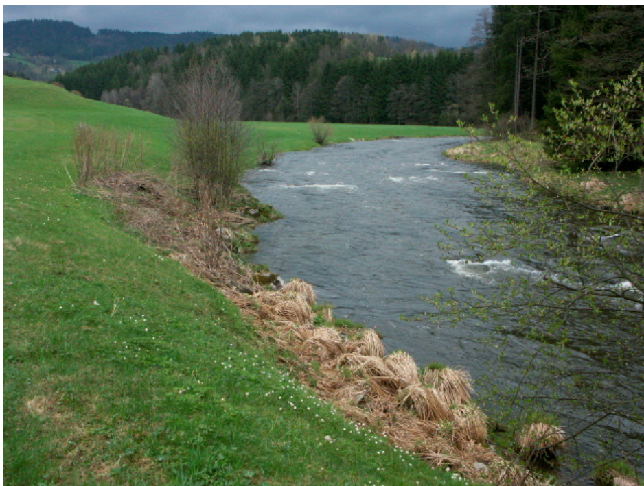
Abb. 8 Große Mühl beim Voitenhof