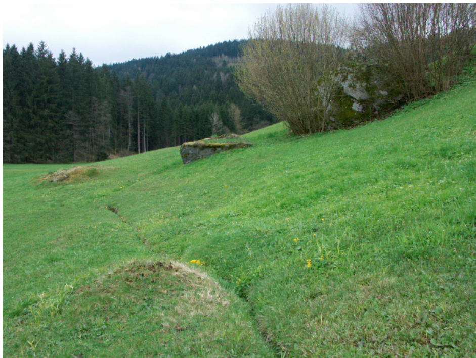
Abb. 7: Teils händische Biotoppflege beim Voitenhof