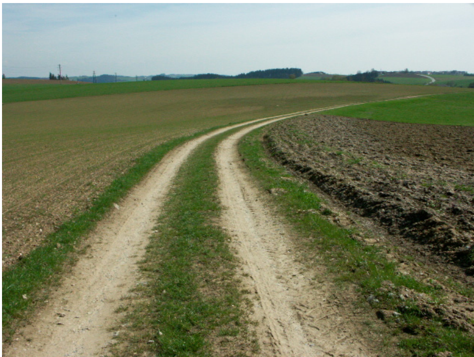
Abb. 13: Agrarisches Offenland bei Scheiblhof