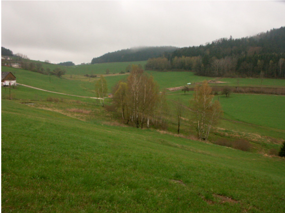
Abb. 12: Verwaltungsgefährdete hochwertige Flächen bei Kollonödt