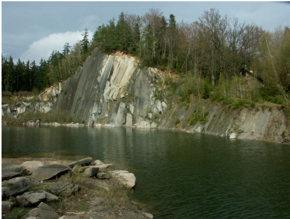
Abb. 6: Aufgelassener Steinbruch bei Steineck