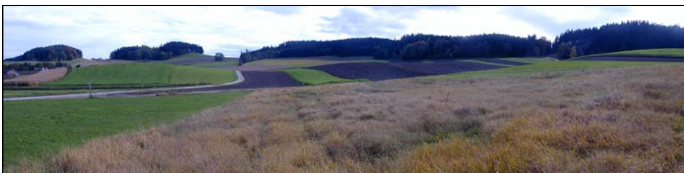
Abb. 8: Hügellandschaft mit Ackernutzung und Fichtenwald im Hintergrund (Landschaftsraum 3) bei Leithen