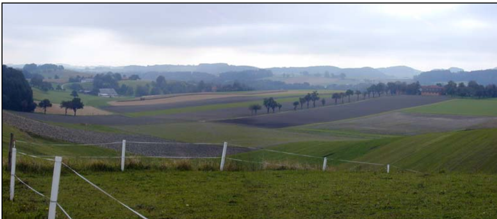
Abb. 1: Blick von der Ortschaft Weinberg Richtung Süden