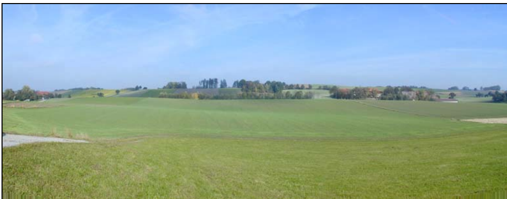
Abb. 4: Blick von Aspolttsberg Richtung Norden (Landschaftsraum 4.