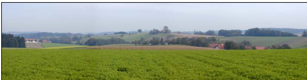
Abb. 5: Blick von Oberhöftberg Richtung Osten