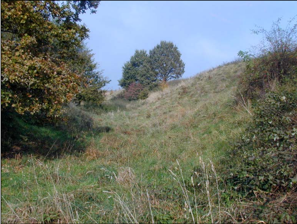
Abb. 3: Sukzessionsfläche auf ehemaligem Trockengrünland bei Aspolttsberg