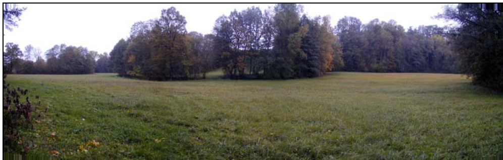
Abb. 7: Wiesennutzung zwischen den Uferbegleitgehölzen des Innbaches und eines weiteren Baches