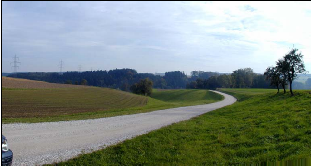
Abb. 6: Fotostandpunkt zwischen Baumgating und Fading, Blickrichtung Südosten