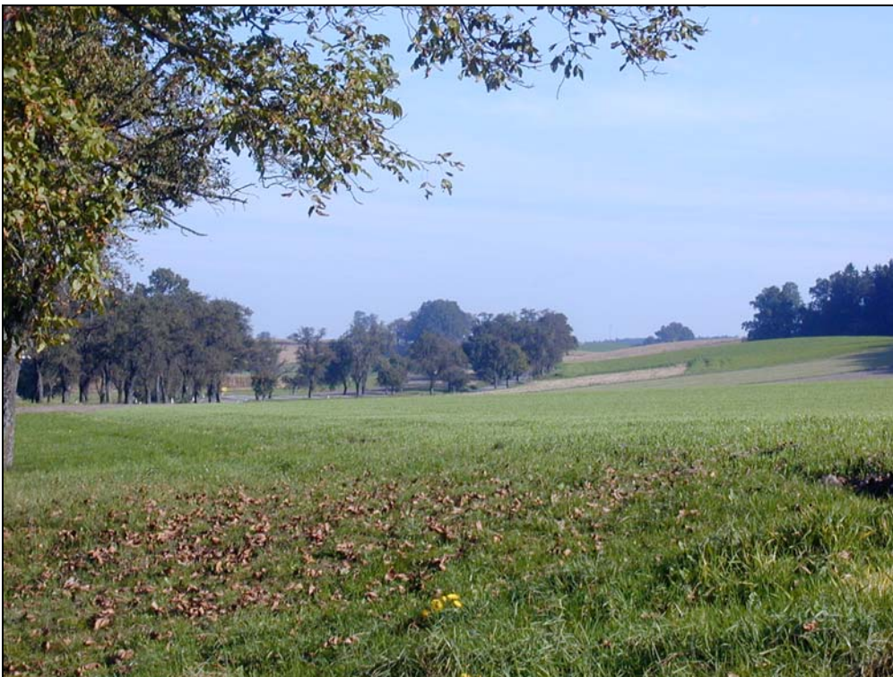
Abb. 2: Schöne Allee entlang der Verbindungsstraße zwischen Haag und Gaspoltshofen