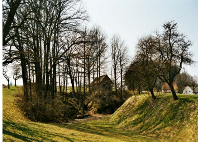
Abb. 8: Ein typisches Feldgehölz an einem ansonsten nur schwer zu bewirtschaftenden Standort.