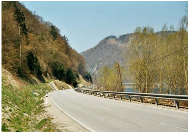
Abb. 3: Die typische Zonierung an der Donau – am Strom ein schmaler Ufergehölzstreifen, dann schließt meist der Treppelweg an, daran die Straße und sodann die Hangwälder des Donautales.