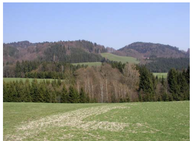
Abb. 6: Ein Blick auf die Wälder in Grein: Mischwald dominiert das Erscheinungsbild, daneben bestehen aber auch zahlreiche Fichten-Monokulturen.