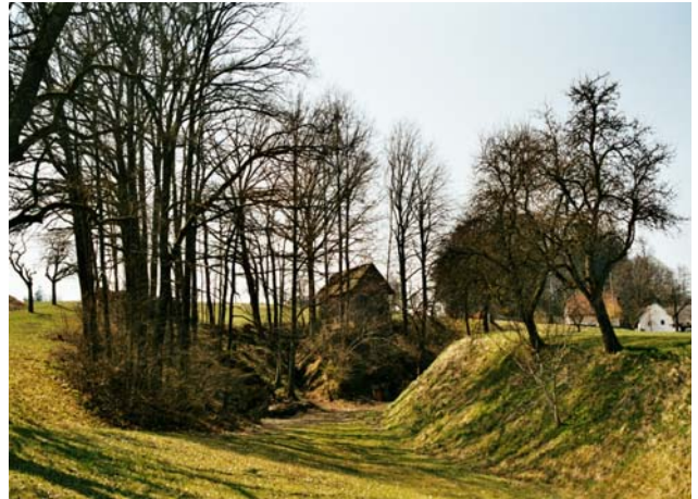
Abb. 8: Ein typisches Feldgehölz an einem ansonsten nur schwer zu bewirtschaftenden Standort.