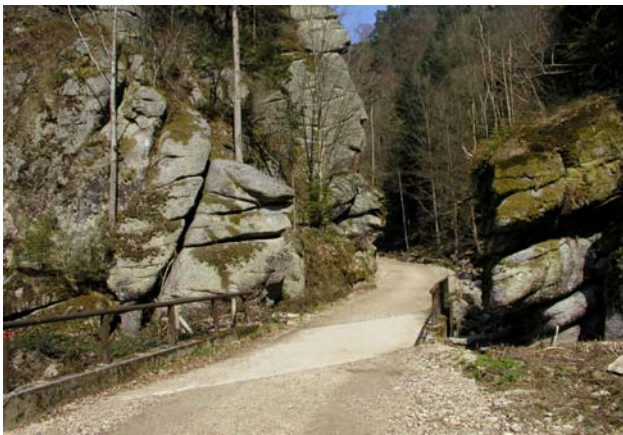
Abb. 11: Die Stillensteinklamm – landschaftlich besonders reizvoll - an der Ostgrenze des Gemeindegebiets von Grein.