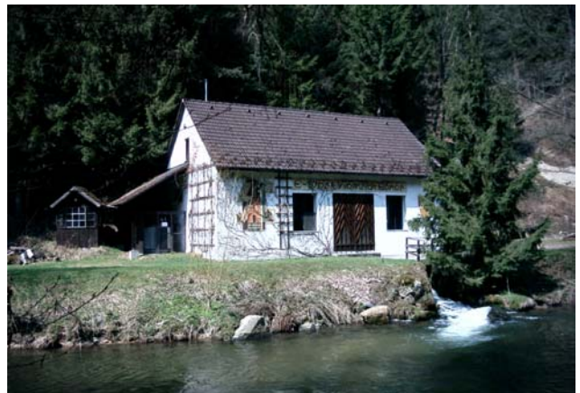
Abb. 12: Kleines Kraftwerk am Unterlauf des Gießenbaches.