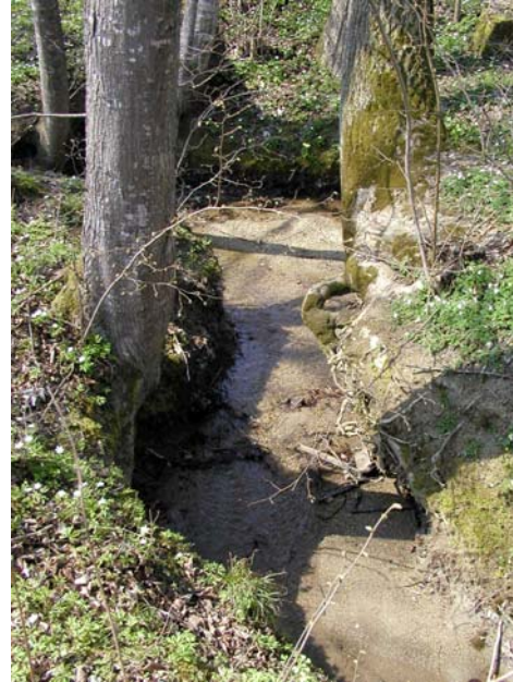
Abb. 14: Natürliches Gewässerbett des Schallahoferbaches