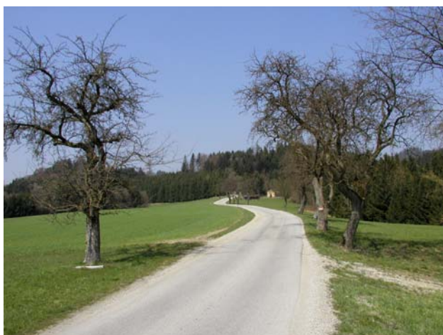
Abb. 5: Zahlreiche Obstbäume – freistehend oder in Reihen – als wichtige Strukturelemente.