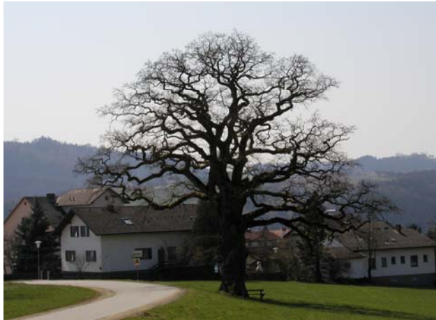
Abb. 7: Eine alte Eiche am Stadtrand von Grein.