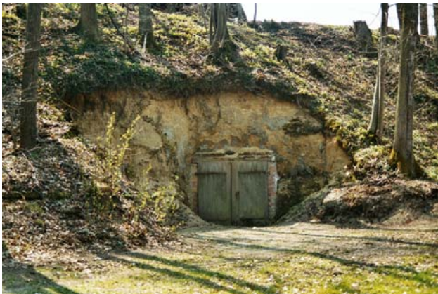
Abb. 9: Der Eingang zu einem Erdkeller.