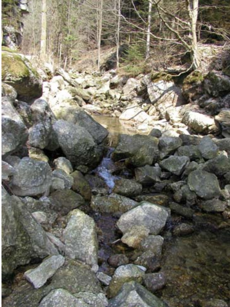
Abb. 13: Der Gießenbach in der Stillensteinklamm.