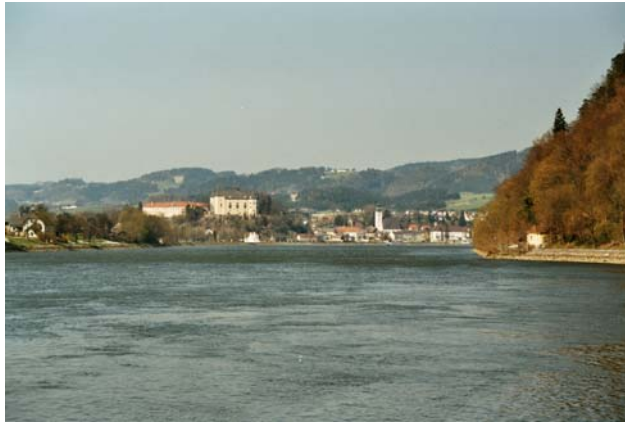
Abb. 1: Blick über die Donau nach Grein – im Vordergrund die Greinburg.