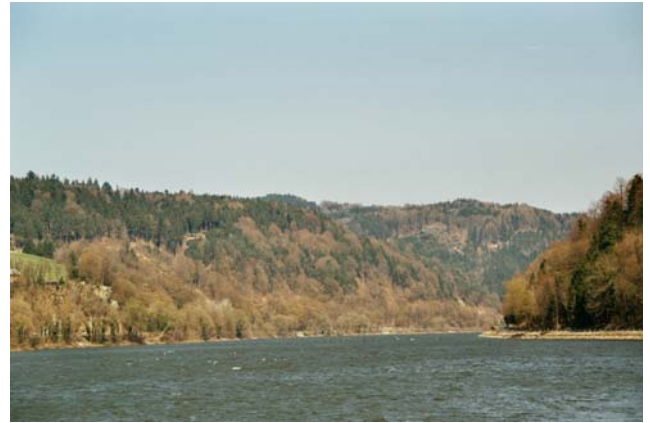
Abb. 2: Die Hangwälder des Donautales.