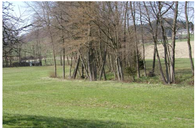
Abb. 10: Naturnahes, standortgerechtes Ufergehölz im Gebiet am Beispiel des Schallahoferbaches.