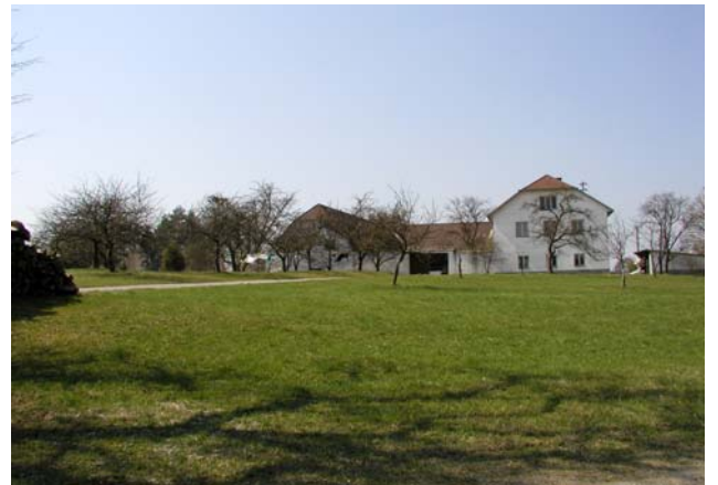
Abb. 4: Außerhalb der Stadt Grein prägt die Landwirtschaft – hier ein Bauernhof mit Streuobstwiese – die Landschaft.