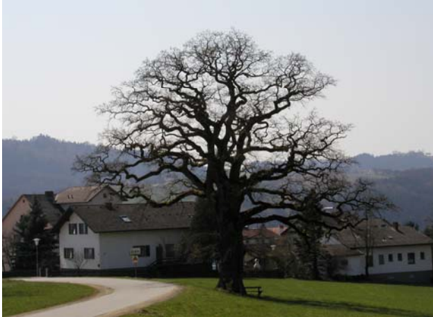
Abb. 7: Eine alte Eiche am Stadtrand von Grein.