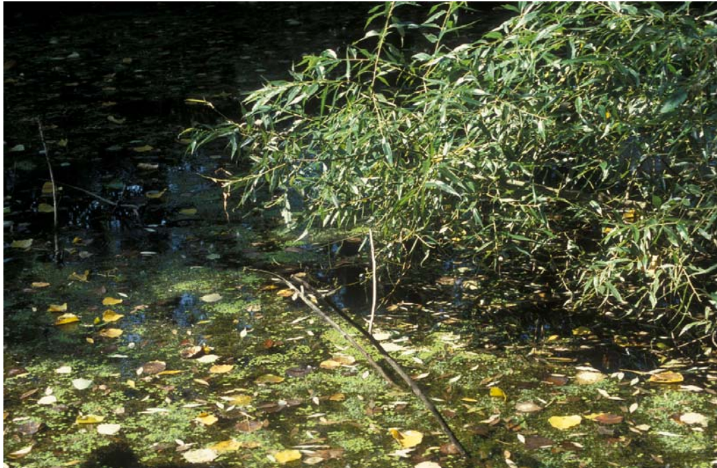
Abb. 7: Naturnaher Teich beim GH. Pammer in Guttenbrunn, Ufergehölz mit Bruch-Weide ( Salix fragilis ), dichte Makrophytenflur mit Wasserstern ( Callitriche sp.) und Teichlinsendecke ( Spirodela polyrhiza )