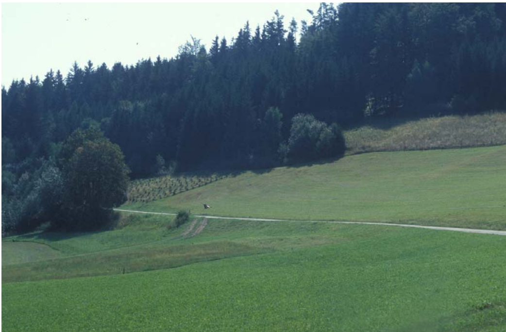
Abb. 12: Aufforstung von waldnahen Grenzertragsflächen meist mit Fichte wie hier nahe Pemsedt