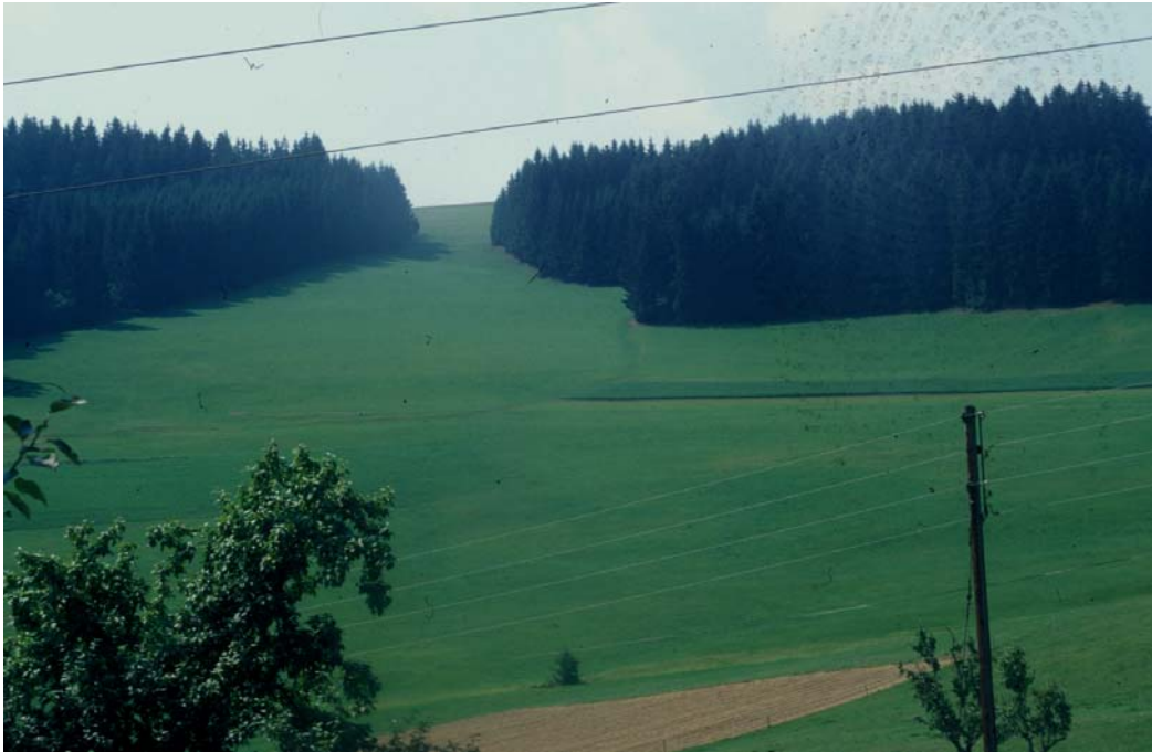
Abb. 11: Ausräumung und Meliorierung wie in diesem Hang und Muldental nahe Höllsteiner