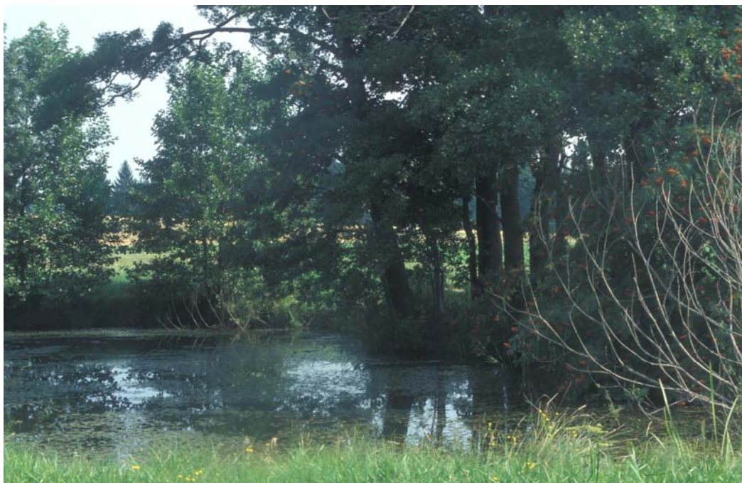
Abb. 8: Naturnaher Teich mit altem Ufergehölz und Schwimmblattgesellschaft westlich von Guttenbrunn