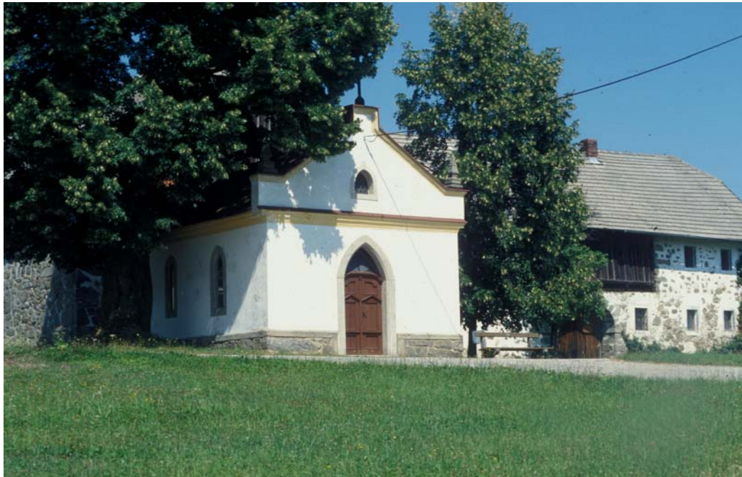
Abb. 2: Typischer Mühlviertler Steinblöß-Hof, hofeigene Kapelle mit altem Einzelbaum (Linde)