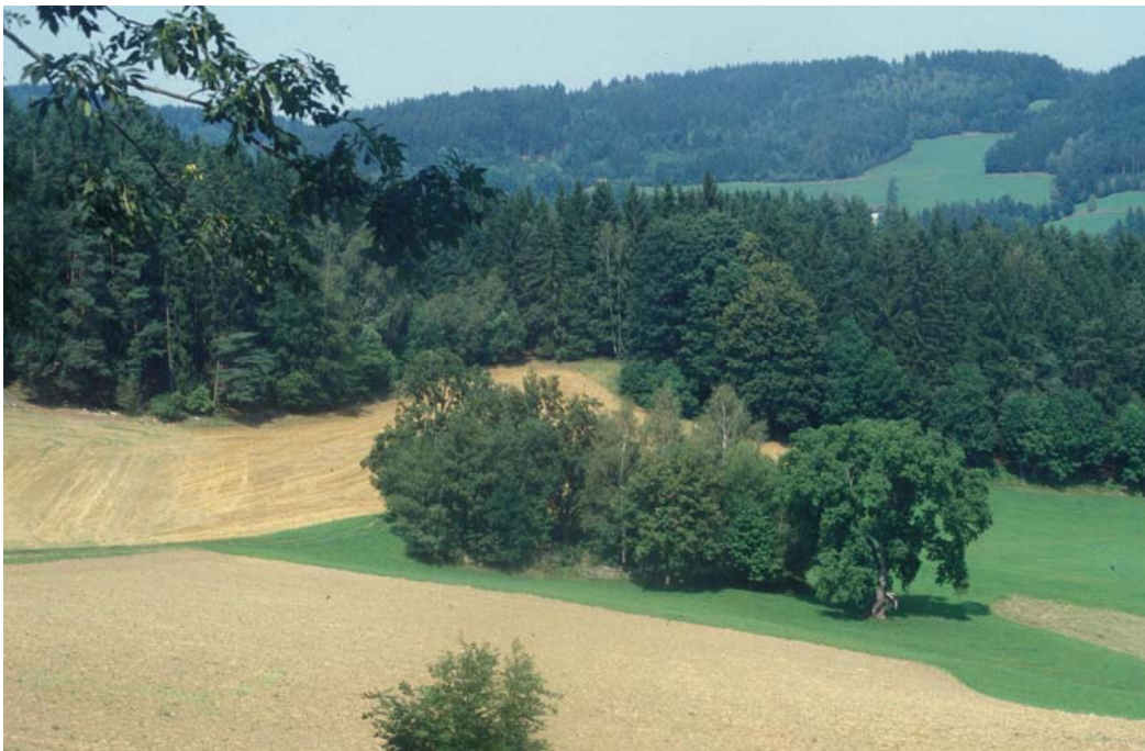
Abb. 4: Feldgehölz und Landschaftsüberblick nahe Pemsedt: Einöblockflur mit Grünlandwirtschaft und eingestreuten Äckern, Fichtenforste, Laubholz-Waldmantel