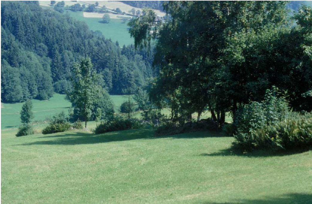
Abb. 3: Teilw. auf Stock gesetzte Hecke in Pemsedt mit Vorhölzern wie Birke auf Blocksteinwall, farnreicher Unterwuchs, in mäßig artenarmes Grünland eingebettet