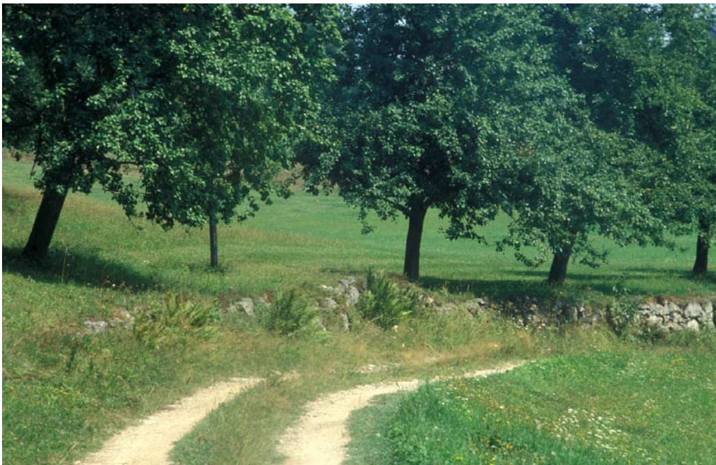
Abb. 6: Obstzeile in Vorwald oberhalb an alter farnreicher Lesesteinmauer