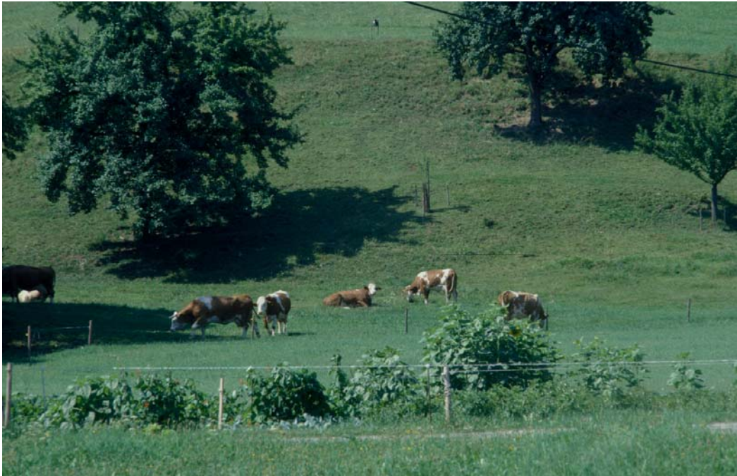
Abb. 5: Rinder-Weide in Hofreith mit alten Obstgehölzen auf steilem Gelände