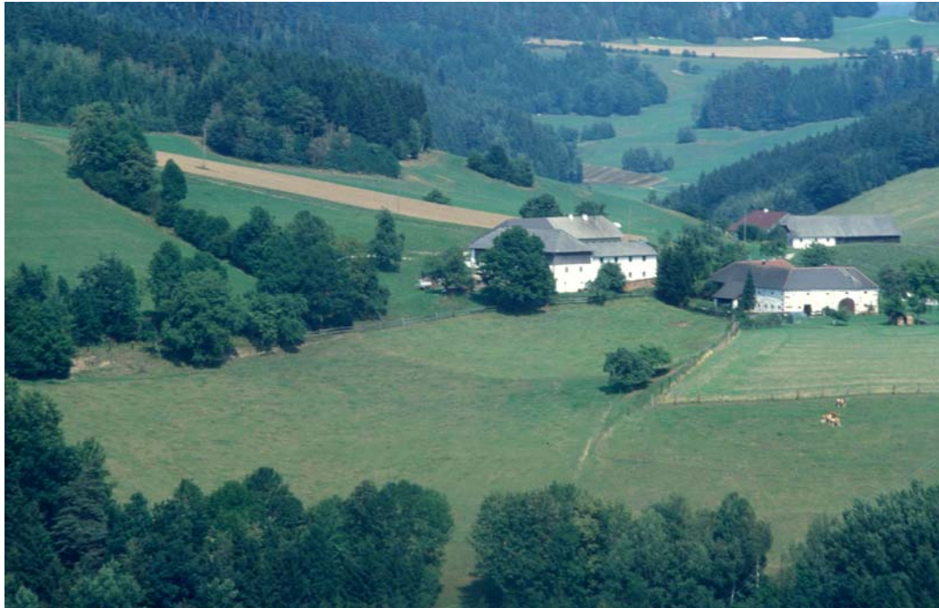
Abb. 1: Kleinweiler in Berg: Einöbblockflur mit alten Streuobstbeständen umgeben von Intensivgrünland (Wiesen und Weiden), von Heckenzügen und Feldgehölzen durchsetzte Kulturlandschaft