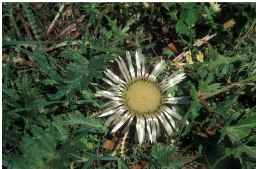
Abb. 10: Magerkeitszeiger wie die Silberdistel ( Carlina acaulis ) sind auf die letzten Magerböschungen etc. beschränkt und bereits selten geworden.