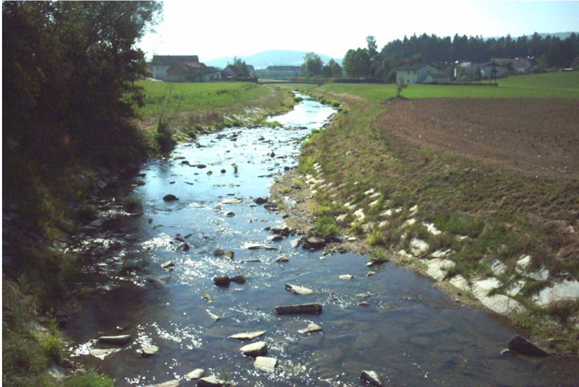
Foto 3: Regulierte Feldaist flussab an der Straßenbrücke von Kefermarkt Richtung Freidorf; Blick Richtung Süden (F-19)