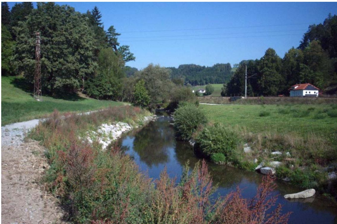
Foto 4: Regulierte Feldaist flussauf an der Straßenbrücke von Kefermarkt Richtung Freidorf; Blick Richtung Süden