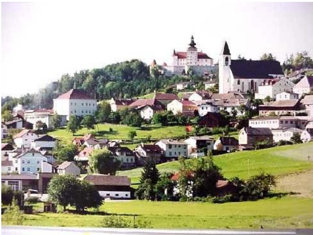
Foto 2: Ortschaft Kefermarkt mit der Kirche und dem Schloss Weinberg im Hintergrund, Blick Richtung Norden