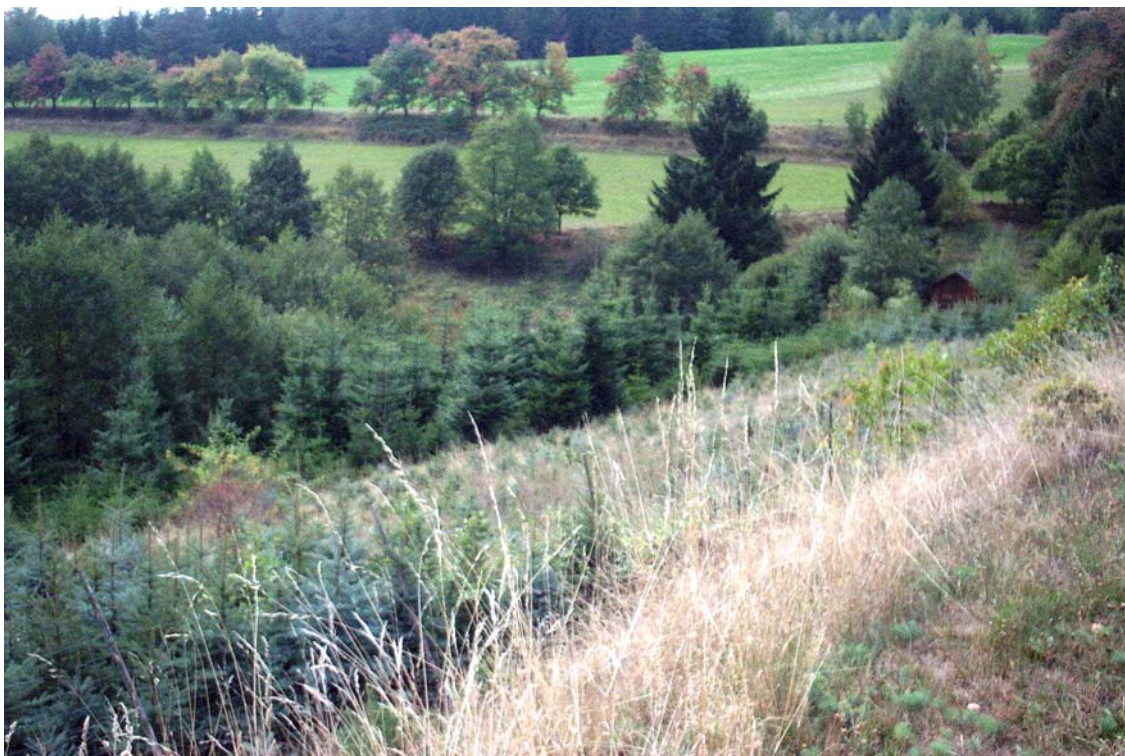
Foto 8: Im Vordergrund Aufforstungsfläche bei Wittinghof, im Hintergrund eine Obstbaumreihe entlang eines Feldwegs; Blick Richtung Süden