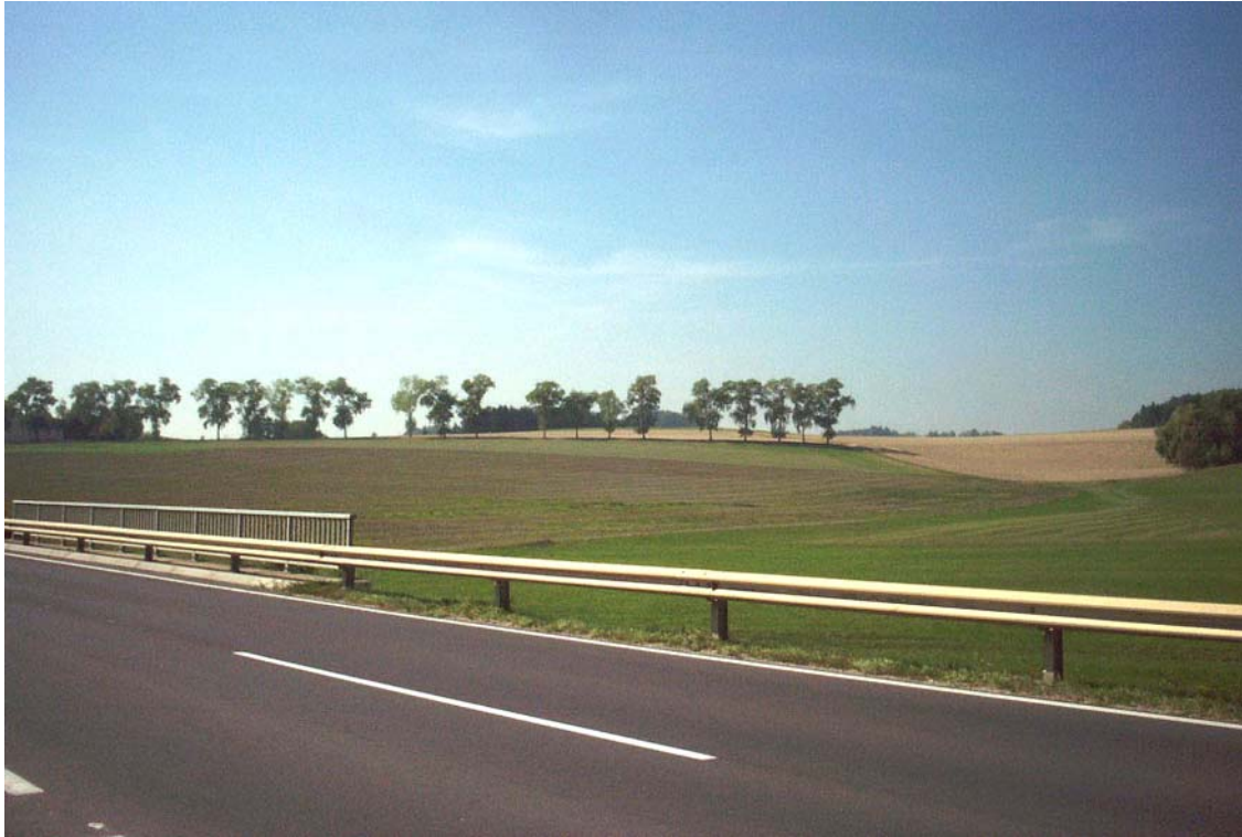
Foto 7: Stark raumwirksame Baumreihe bei Pernau; Blick Richtung Südwesten von der B 310 aus