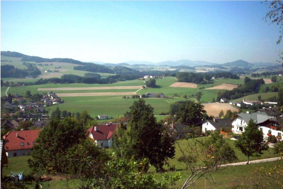
Foto 5: Landschaft von Kefermarkt aus Richtung Nordwesten gesehen