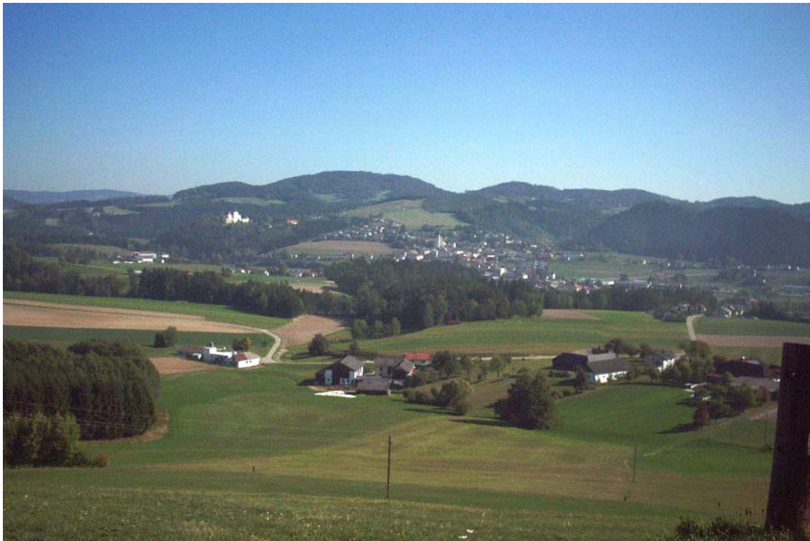
Foto 1: Ortschaft Kefermarkt am südwestlichen Hang des Weinbergs mit leicht welliger Oberflächenmorphologie (Agrar- und Siedlungsbereich); im Hintergrund rechts Liegen die bewaldeten Hänge der Flanitz; Blick Richtung Osten