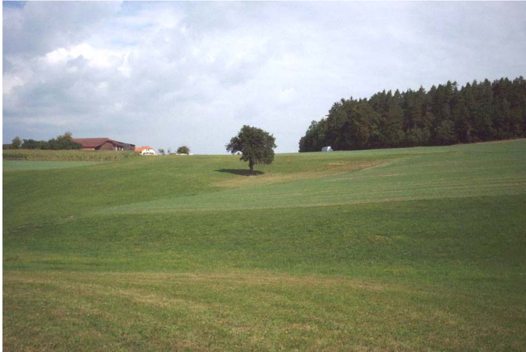
Foto 9: Markanter Einzelbaum im intensiven Grünland zwischen Matzelsdorf und Möstling