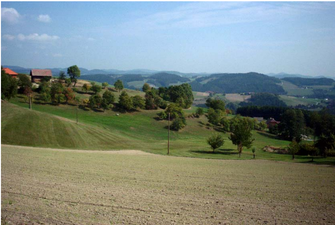
Foto 1: Obstwiese bei Dingdorf; im Hintergrund: Kuppenlandschaft; Blick Richtung Norden