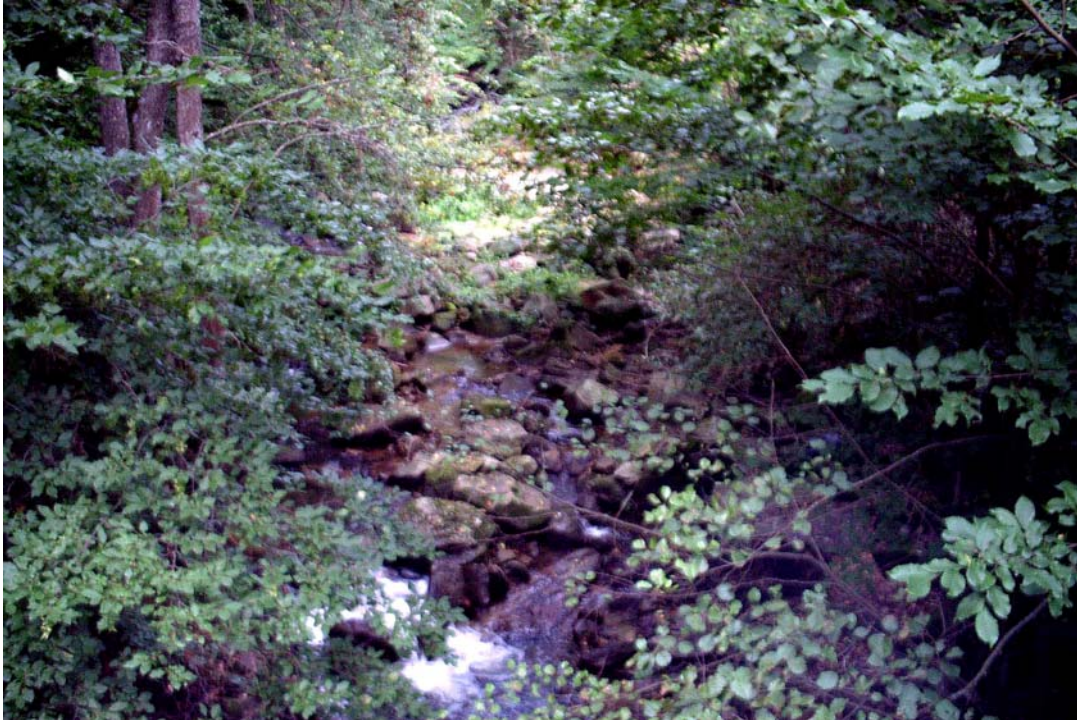
Foto 3: Bachbett der Kleinen Gusen im südlichen Gemeindegebiet, große Granitblöcke liegen im Bachbett, gute Ufer-Land-Verzahnung, naturnahe Begleitgehölze, Foto flussauf