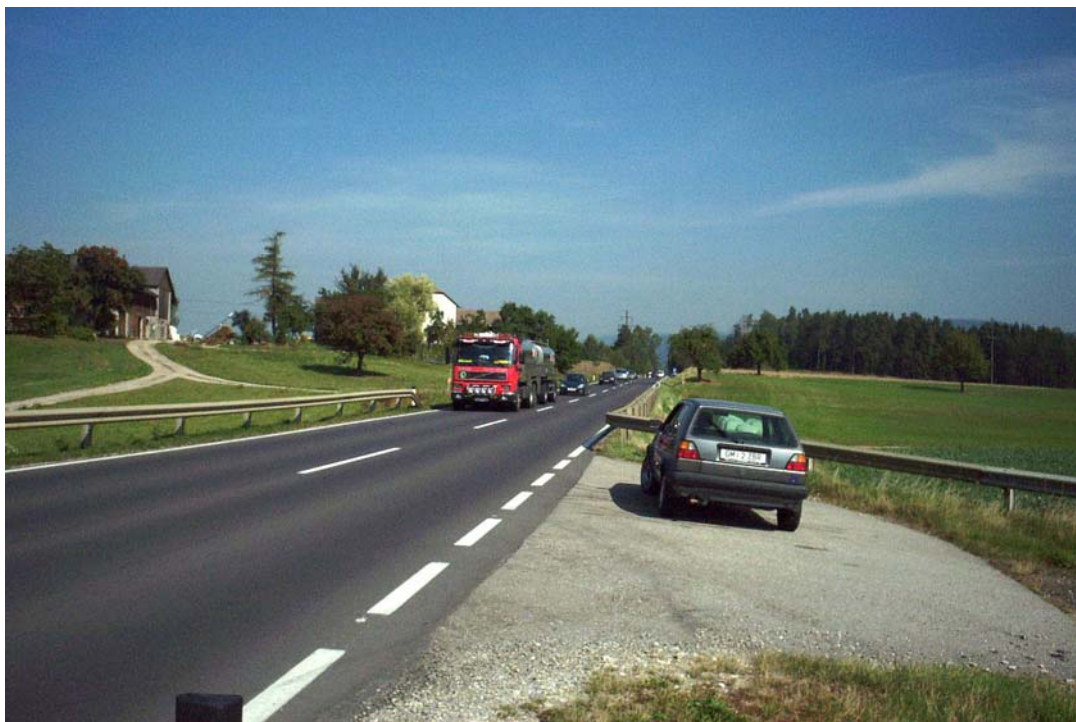
Foto 10: Stark befahrene B 310 Prager Straße nördlich von Neumarkt