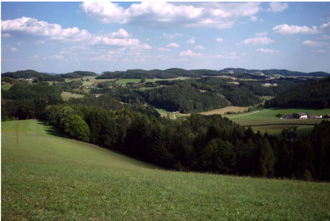
Foto 2: Stark reliefierte Kuppenlandschaft des nördlichen Gemeindegebiets