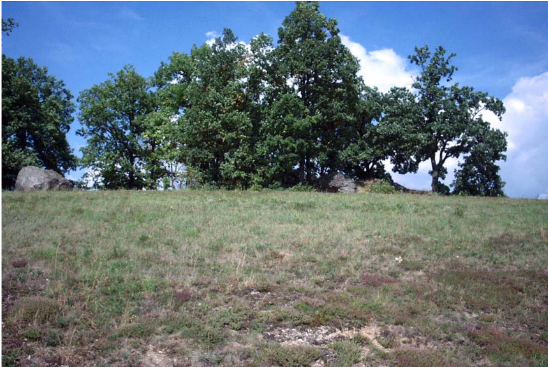
Foto 5: Mit Eichen bestockte Einzelfelsformation in Kuppenlage westlich von Neumarkt