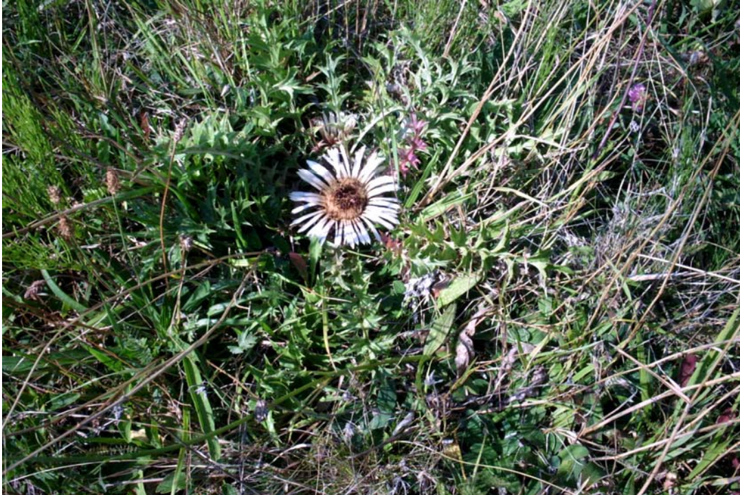
Foto 7: Silberdistel in einer Sukzessionsfläche auf einer Böschung bei Immerle