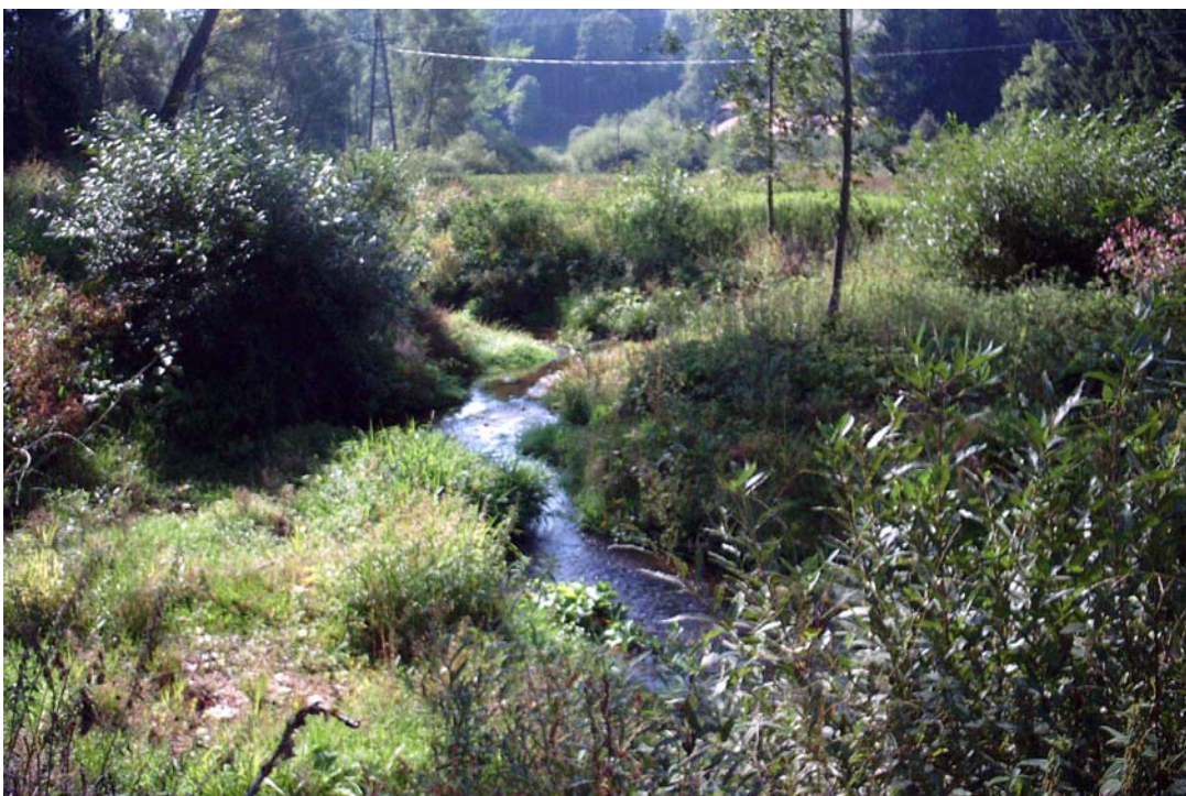
Foto 4: Kleine Gusen im nördlichen Gemeindegebiet, mäandrierender Verlauf, naturnahe Begleitgehölze; im Hintergrund Sukzessionsfläche, Foto flussab