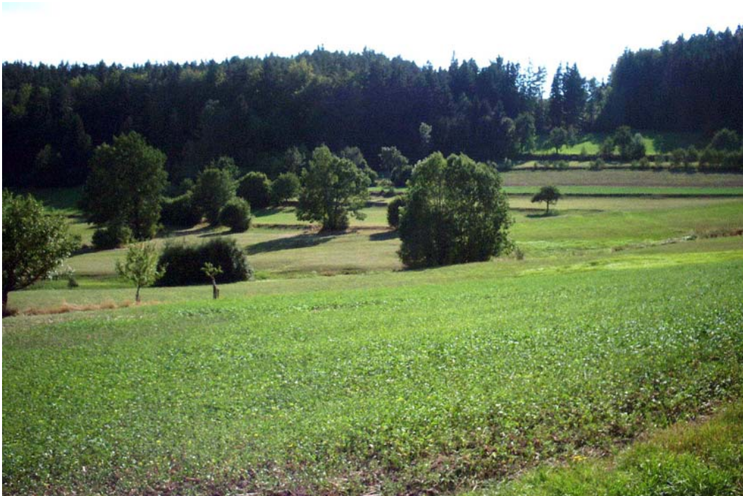
Foto 8: Intensives Grün- und Ackerland bei Stiftung mit Hecken auf den Böschungen zwischen den Flächen