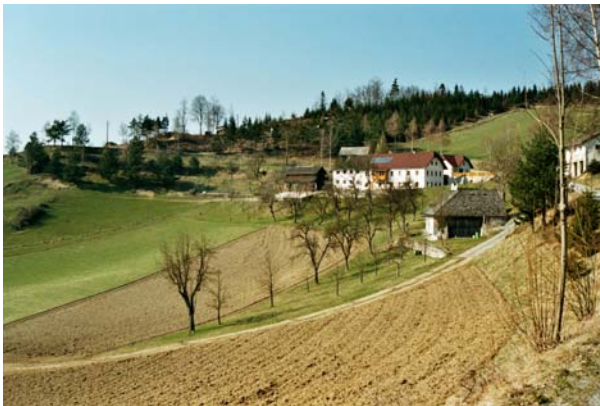
Abb.3. Ein typisches Bild für die Gegend – Grünland, Äcker, Obstbäume und Wald sowie (teils bereits gehölzbestockte) Böschungen.