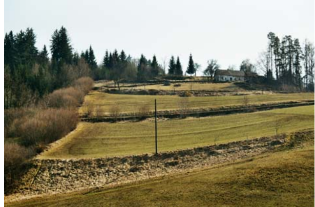
Abb.8. Abtreppungen in den Hängen, als unge-ähete Böschungen auch als Refugialräume für zahlreiche Tierarten interessant.