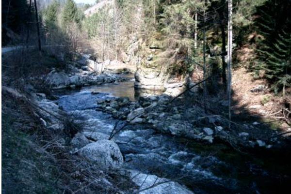
Abb.13. Die Große Naarn – ein überwiegend natürliches Fließgewässer von höchstem ökologischen Wert.