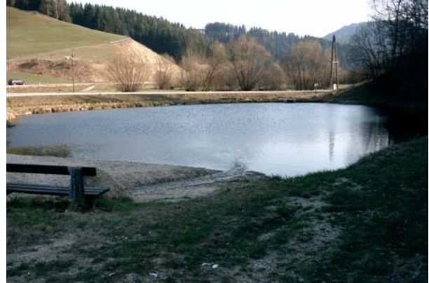
Abb.20. Ein Fischteich nahe des Ortes Pierbach.