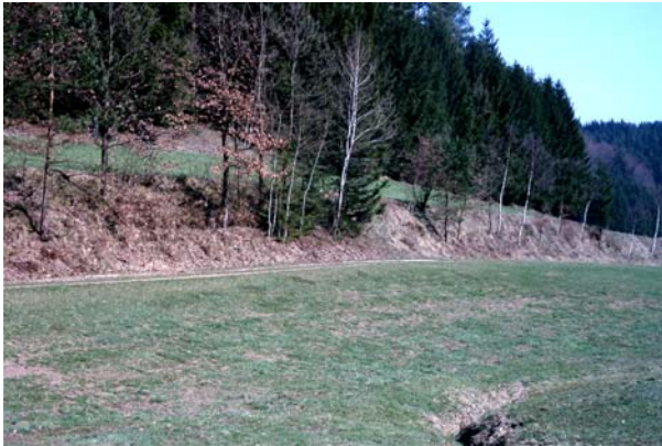
Abb.9. Ungemähte Böschung, bereits mit zahlreichen Gehölzen bestockt.