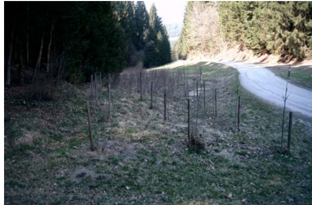
Abb.10. Ungemähte Wiese mit junger Laubholz-aufforstung.