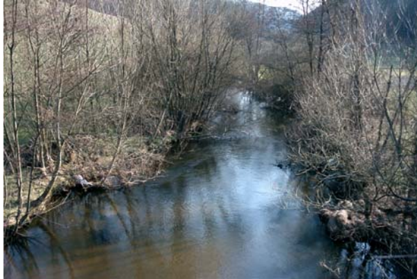
Abb.19. Die Naarn nach der Vereinigung von Großer und Kleiner Naarn.