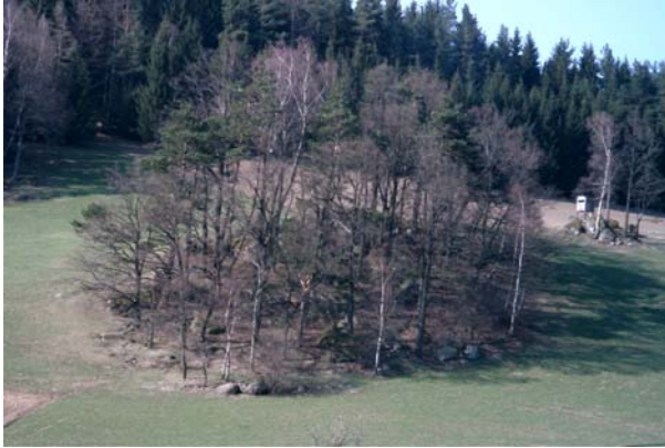
Abb.7. Ein weiteres der zahlreichen Feldgehölze im Gebiet.