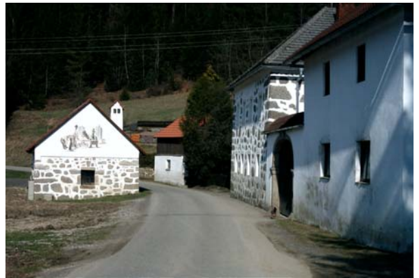
Abb.4. Der typische Bauernhof im Mühlviertel, gemauert aus Mühlviertler Granit, mit Wandmalerei am Nebengebäude.