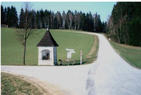
Abb.5. Wegkreuzung mit Kapelle in Pierbach – auch hier die klassische Bauweise erkennbar.