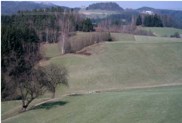
Abb.1. Die Landschaft - welliges Hügelland, vorwiegend landwirtschaftlich genutzt.