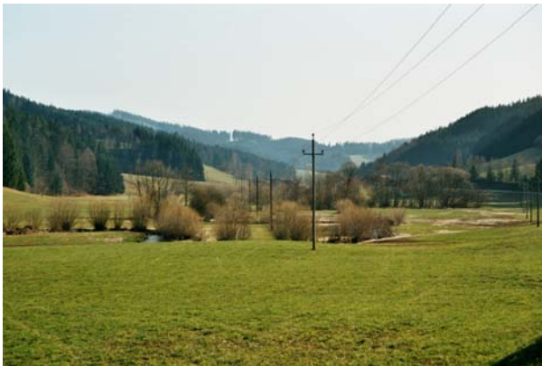
Abb.15. Die Große Naarn unterhalb des Ortes Pierbach – ein stark mäandrierender Abschnitt, umgeben von nährstoffreichem Feuchtgrünland.