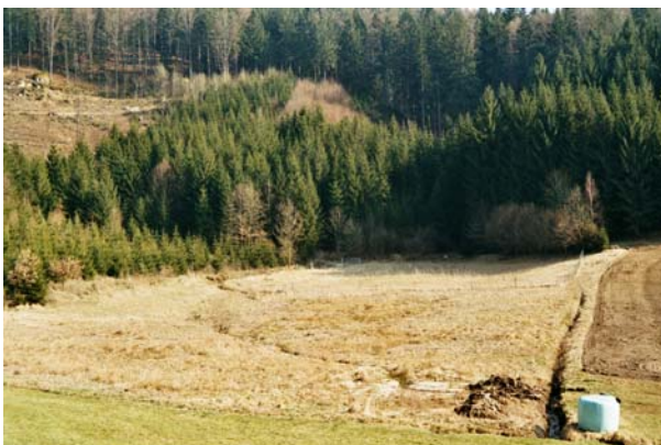
Abb.11. Feuchte Wiesenfläche (ungemäht).