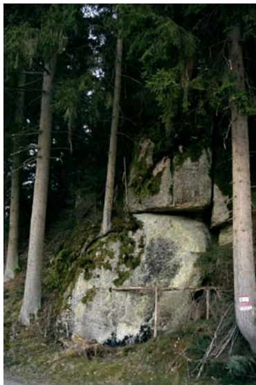
Abb.21. Ein für die Wälder der Region (zumeist Fichten-dominiert) typisches Bild – teils sehr mächtige Granitblöcke ragen zwischen den Bäumen empor.