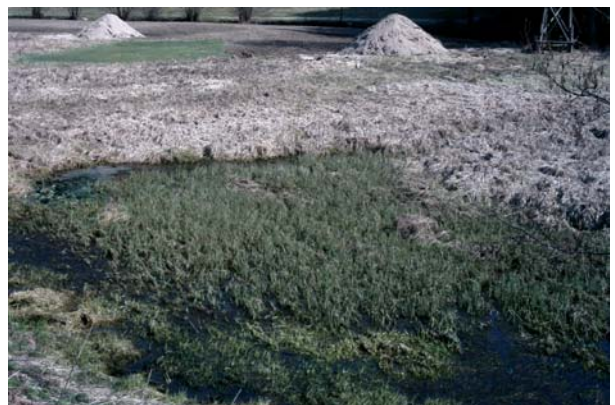
Abb.12. Nasses Grünland, teils überschwemmt, an der Großen Naarn.