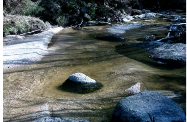
Abb.14. Detailaufnahme aus der Großen Naarn – ein äußerst reich strukturierter Lebensraum.