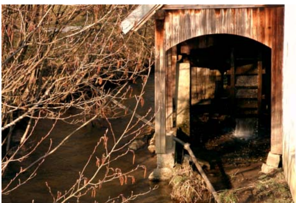
Abb.17. Ein kleines Mühlrad an der Kleinen Naarn.