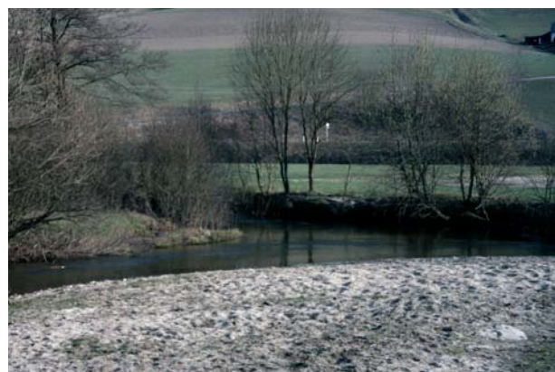
Abb.18. Der Zusammenfluss von Großer und Kleiner Naarn im Gemeindegebiet von Pierbach.