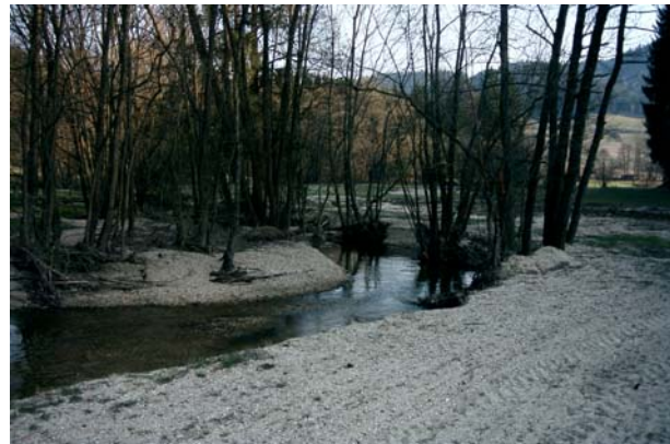
Abb.16. Die Kleine Naarn an der Westgrenze der Gemeinde Pierbach – sie zeigt hier ebenfalls ein recht naturnahes Erscheinungsbild (im Vordergrund Schotterauswurf des Sommerhochwassers 2002).