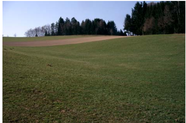
Abb.2. Grünland und Wälder dominieren, Äcker spielen eine untergeordnete Rolle.