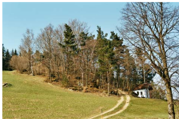
Abb.6. Eines von vielen Feldgehölzen (hier ebenfalls mit einer kleinen Kapelle).