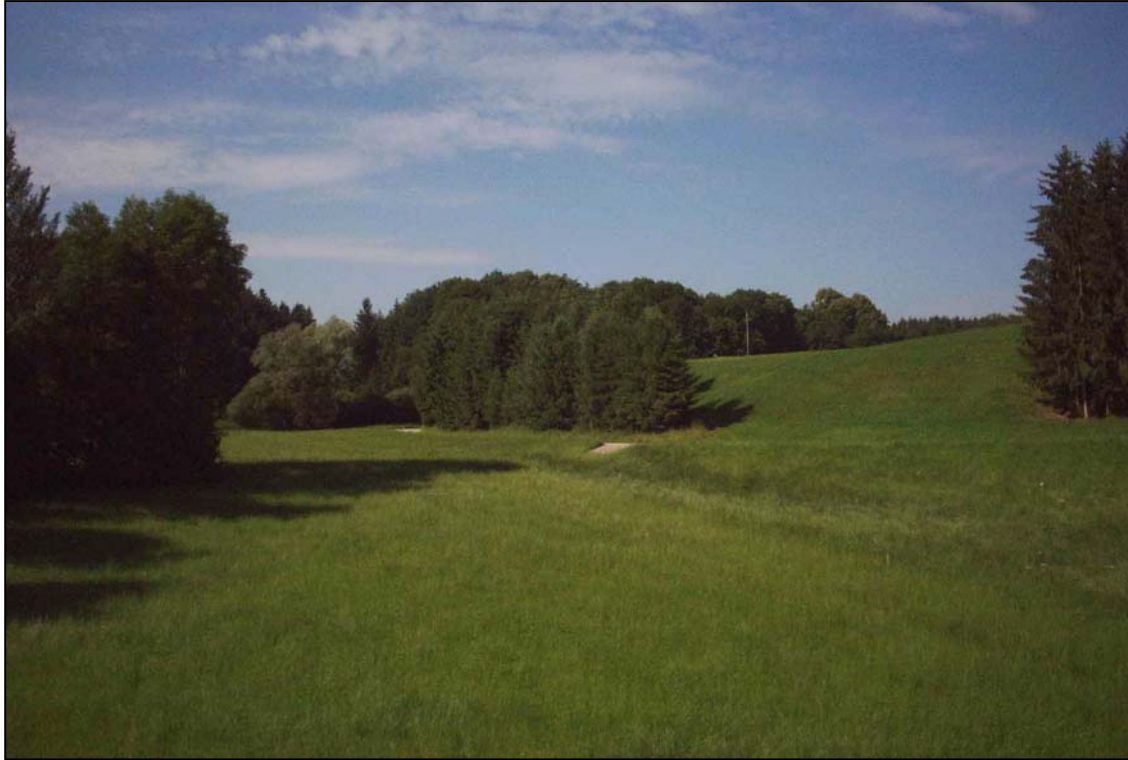
Abb. 5: Landschaft südlich von Innerroh, Blick Richtung Südwesten; leicht reliefiertes Riedelland