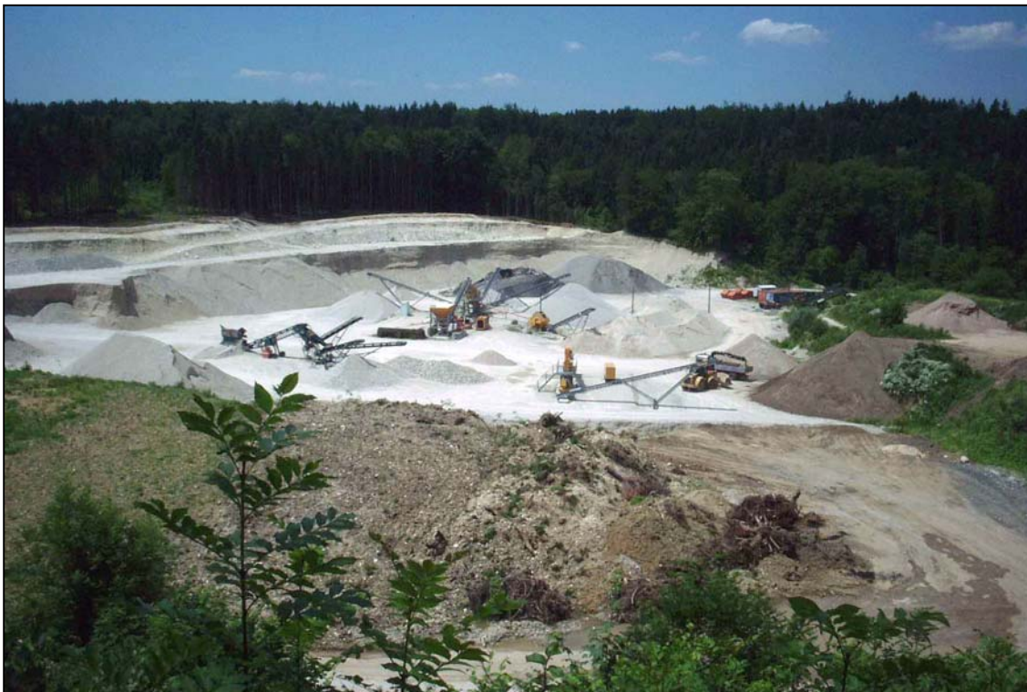
Abb. 2: Kies- und Schottergrube Forstinger, durch anthropogene Eingriffe wie Schottergruben können auch neue Lebensräume für die Tier- und Pflanzenwelt entstehen