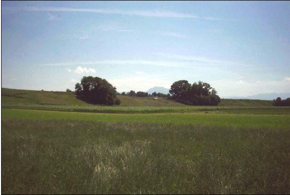
Abb. 3: Markante Geländeböschung mit extensiven Flächen und Gehölzen bei Kemating; Blick Richtung Süden