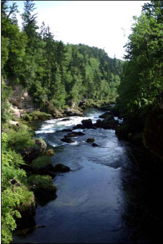
Abb. 1: Traunfall, Blick flussabwärts