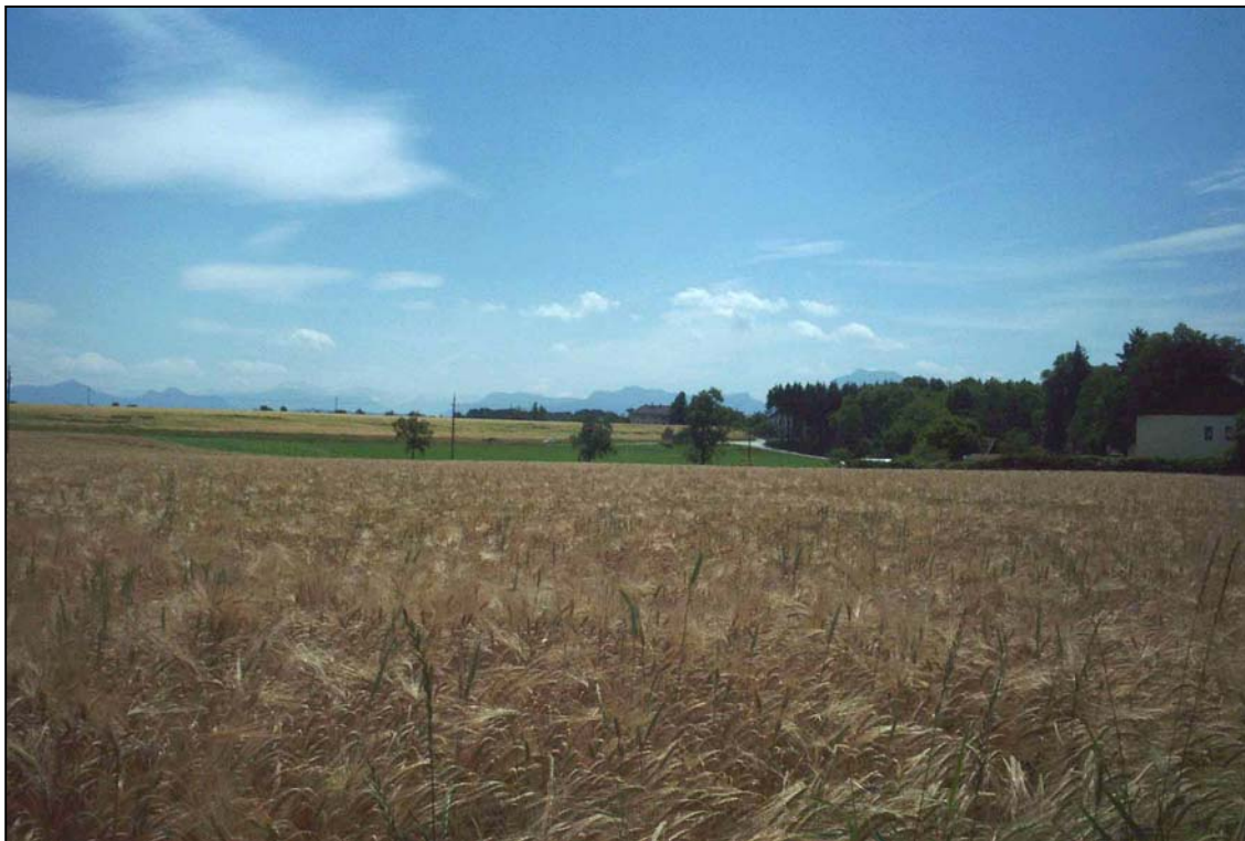
Abb. 4: Blick Richtung Roitham, Richtung Süden, intensive, wenig strukturierte Agrarlandschaft auf der Hochterrasse