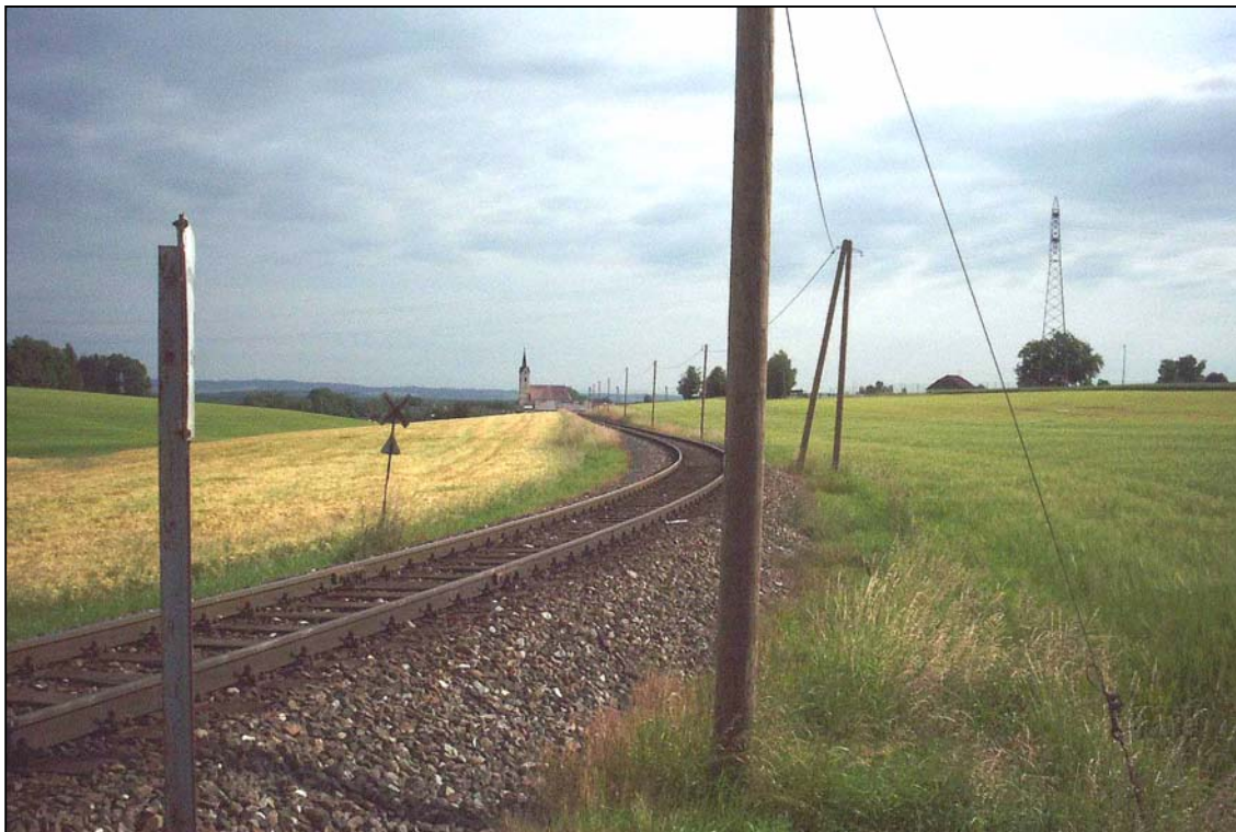
Abb. 6: Bahngleis südlich von Roitham, linearer Eingriff ins Landschaftsbild, Blick Richtung Norden, im Hintergrund Kirche von Roitham