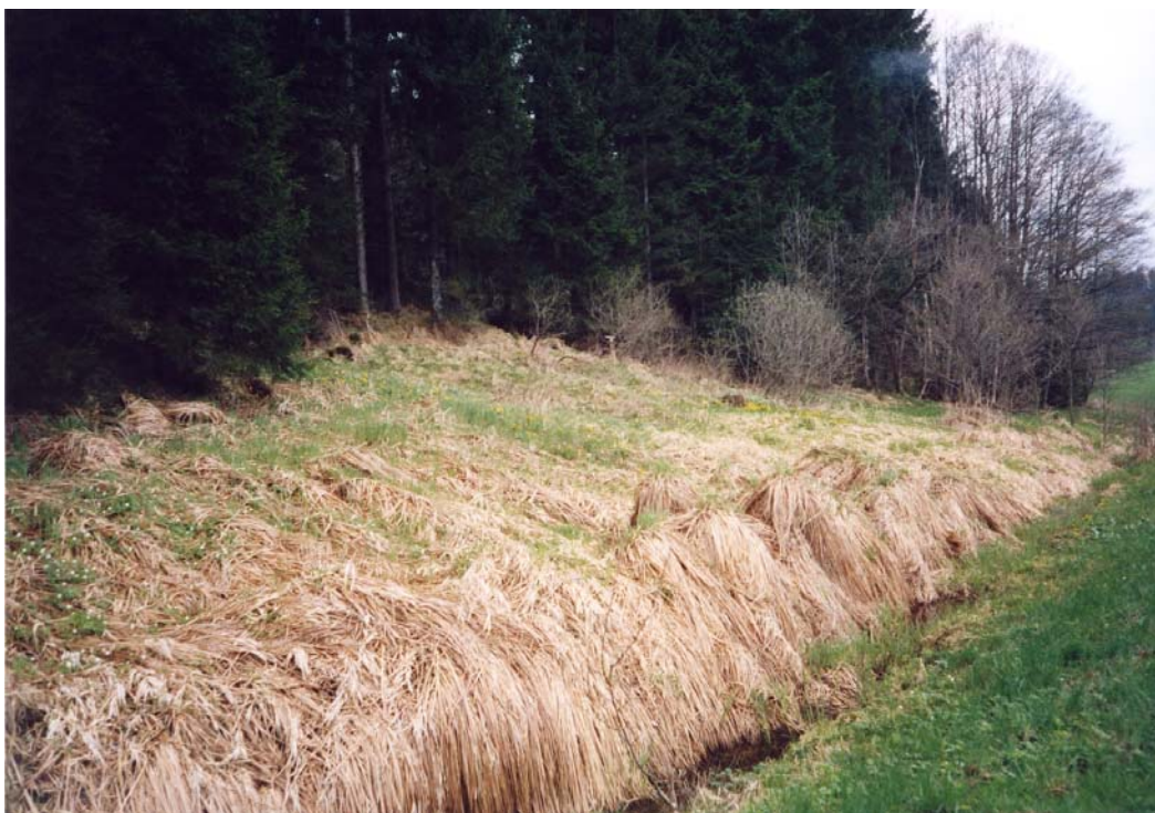
Abb. 10: Sumpf-Brachsaum und Grabentümpel am Rand des Mühltales ober der Atzmühle.