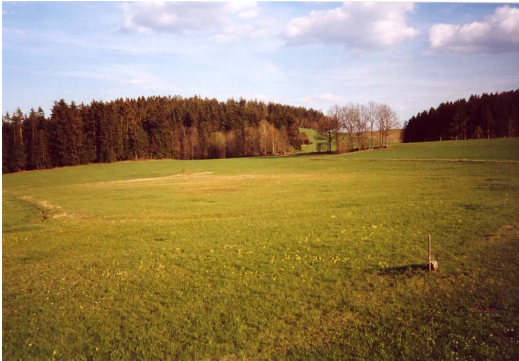
Abb. 9: Eine der wertvollsten Wiesen von St. Peter: magere Feuchtwiese mit Bürstlingsrasen (braun in Bildmitte), am Weg von Kasten nach Dambach..