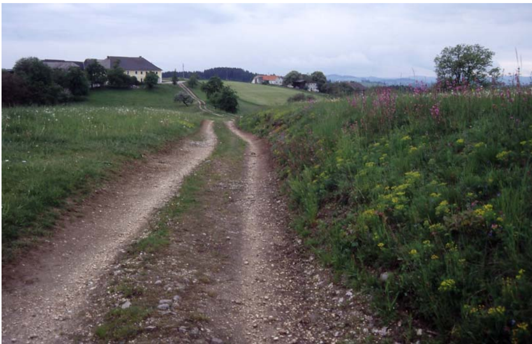
Abb. 8: Weg vom Kaar zum Pfaffenhofer; eine der naturschutzfachlich wertvollsten Böschungen St. Peters, mit Bürstlingsvorkommen; gut gepflegt.