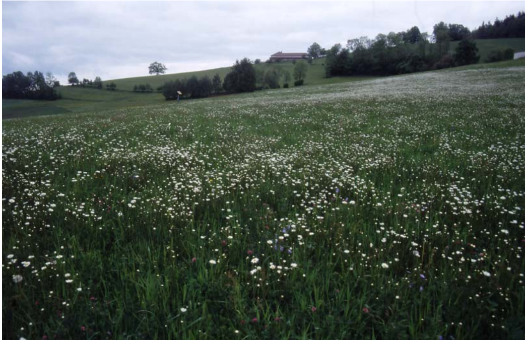
Abb. 7: Große Blumenwiese beim Kaar; die Margeritenmassen wachsen zum Teil auf einem Acker, nicht auf einer Wiese, bei extensiver Nutzung trotzdem ein wertvoller Lebensraum.