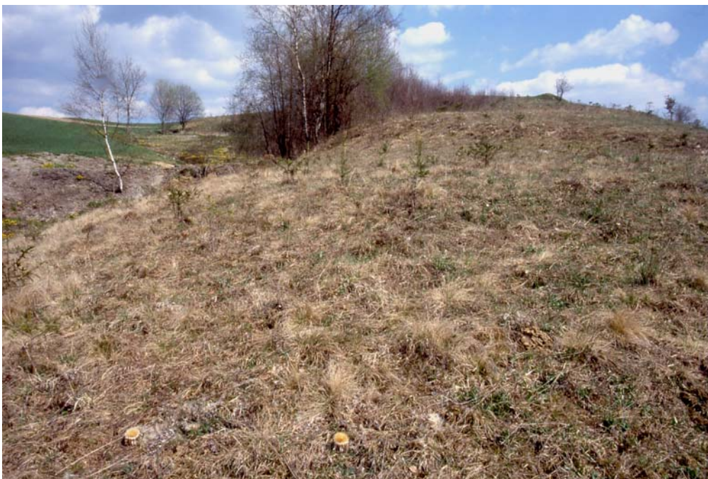
Abb. 2: Hummelmühlbachtal oberhalb Uttendorf; einer von 2 winzigen letzten Bürstlingsrasen (nach EU-Recht höchstwertiges Naturschutzgut) der Gemeinde St. Peter - frisch aufgeforstet!