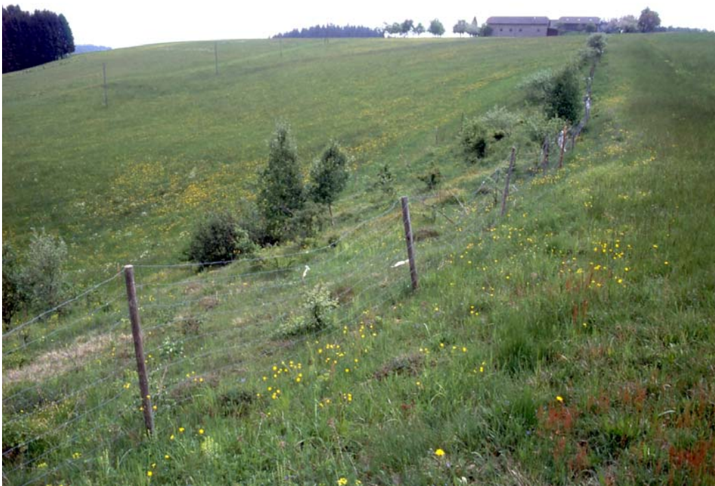
Abb. 6: Kommassierungs-Todsünde in Eckerstorf: Bepflanzung einer höchst wertvollen Trockenwiese mit Bürstling; solche Lebensräume sollten durch Mahdpflege - oder wenn nicht anders möglich - durch Beweidung erhalten werden.