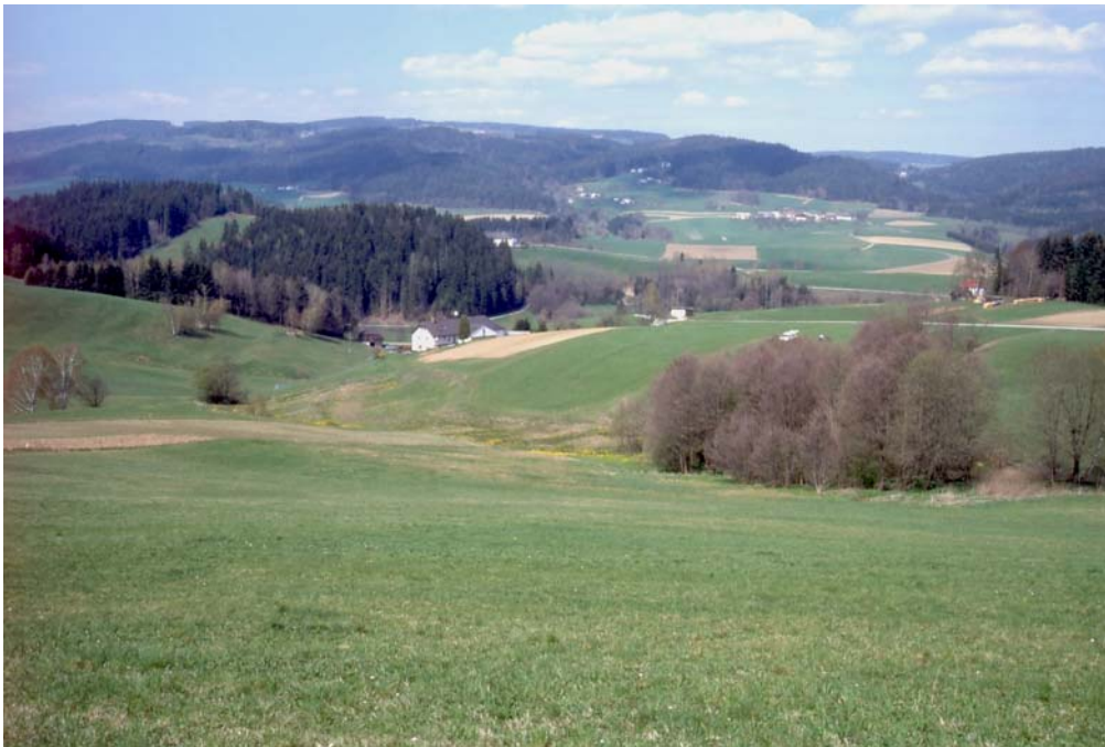
Abb. 1: Nicht vollflächig gedüngte Fettweide bei Uttendorf.