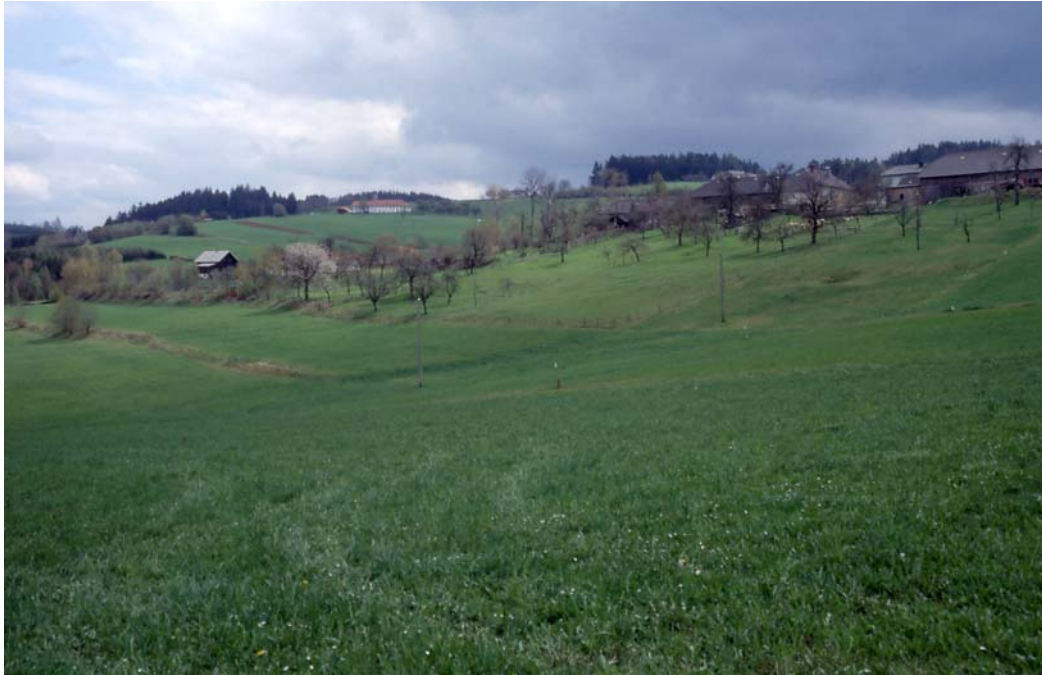
Abb. 5: Blick auf den ausgedehnten, naturschutzfachlich wertvollen Obstwiesengürtel um Kasten; Raine mit Resten von Magervegetation.