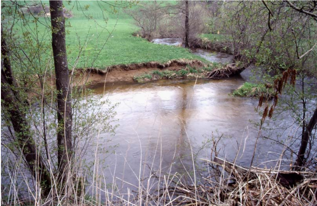
Abb. 3: Prallufer in äußerst naturnaher Fließstrecke der Steinernen Mühl ober der Atzmühle - Standort einer Eisvogelniströhre auf St. Stefaner Seite.