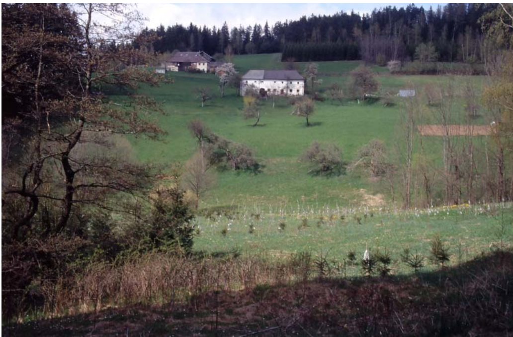
Abb. 4: Höchstwertiger Landschaftsausschnitt bei den Leitenhäusln bei Engersdorf. Die Aufforstung der Auberger Feuchtwiese im Vordergrund entspricht nicht den ÖPUL-Vorgaben zu Erhaltung und pfeglichem Umgang mit Landschaftselementen; hinten zahlreiche Extensivwiesen.