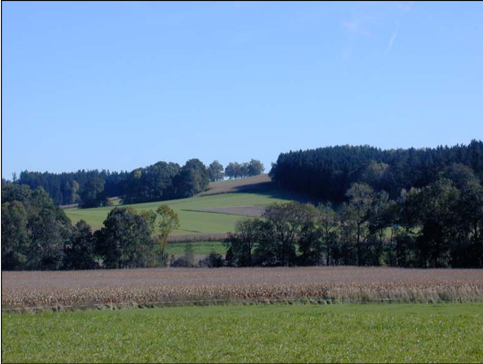
Abb.6: Strukturierte Hügellandschaft bei Reischau, Fotostandpunkt Holz