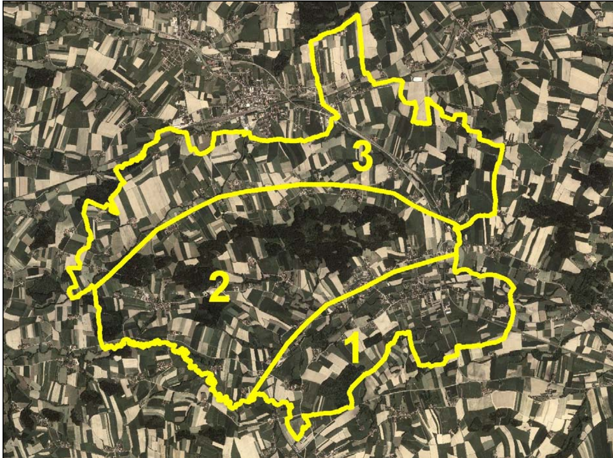
Abb. 2: Abgrenzung der Teilgebiete (Beschreibung der Teilgebiete siehe Kap. 2) mit Orthofoto Teilgebiet 1: Flache Hochterrasse entlang der Trattnach mit intensiver landwirtschaftlicher Nutzung Teilgebiet 2: Langgezogener Hangrücken mit großflächigem Fichtenwald und guter Strukturierung Teilgebiet 3: Flachwelliger Landschaftsraum mit intensiver landwirtschaftlicher Nutzung