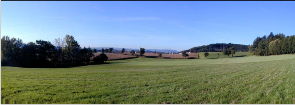
Abb.3: Blick von Dietensam Richtung Südwesten, Landschaftsraum 2