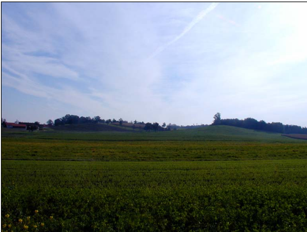
Abb.1: Intensive Ackerwirtschaft mit Weiler Eibhub im Hintergrund, Landschaftsraum 3