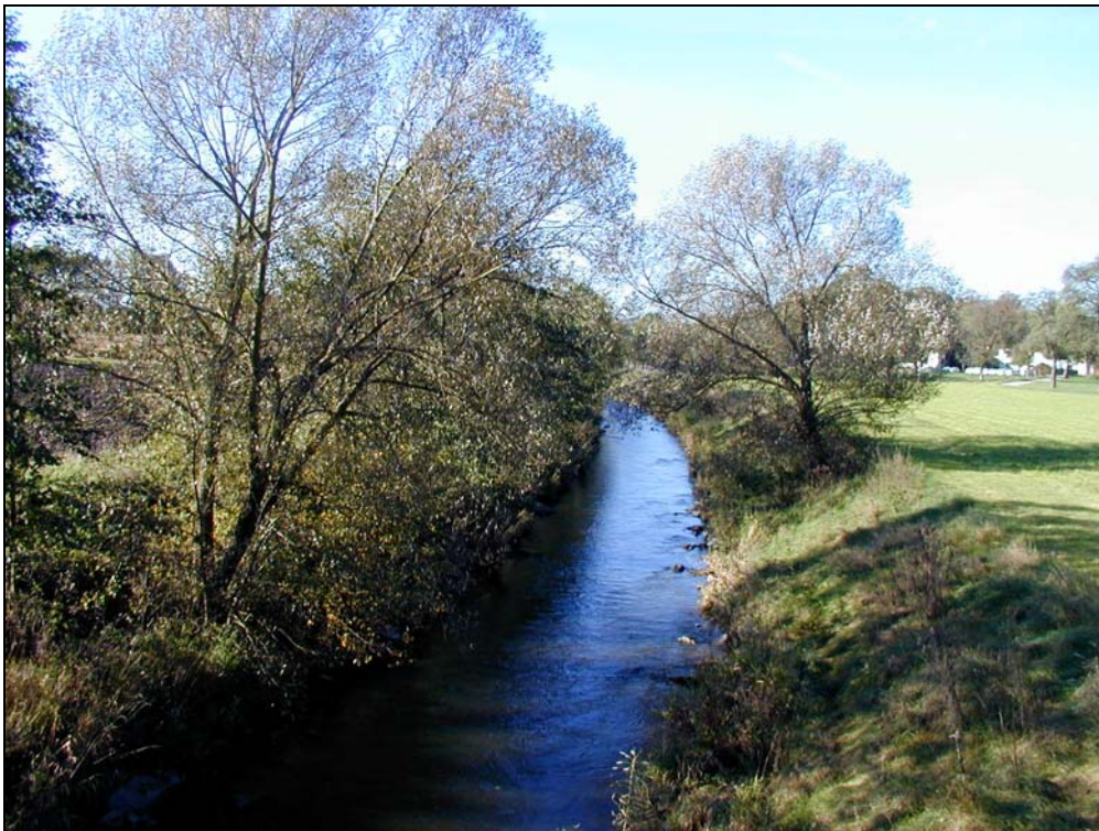
Abb.4: Regulierte Trattnach mit einseitigem Uferbegleitgehölz, Landschaftsraum 1