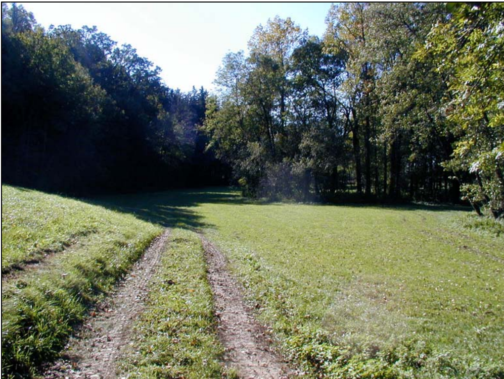
Abb.7: Talboden im Bereich der Dürren Aschach, Landschaftsraum 3