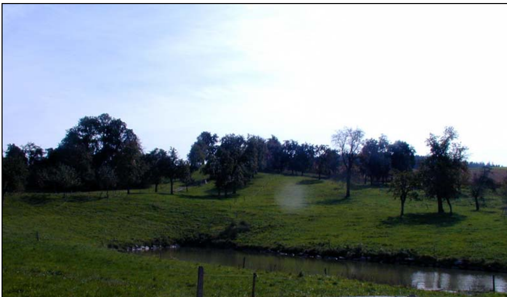
Abb.2: Mehrere Obstbaumzeilen im Bereich des Weilers Unterolzing, Landschaftsraum 3