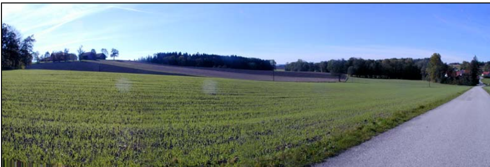
Abb.5: Ausgeräumte Ackerlandschaft mit Fichtenforst im Hintergrund in Brandstetten