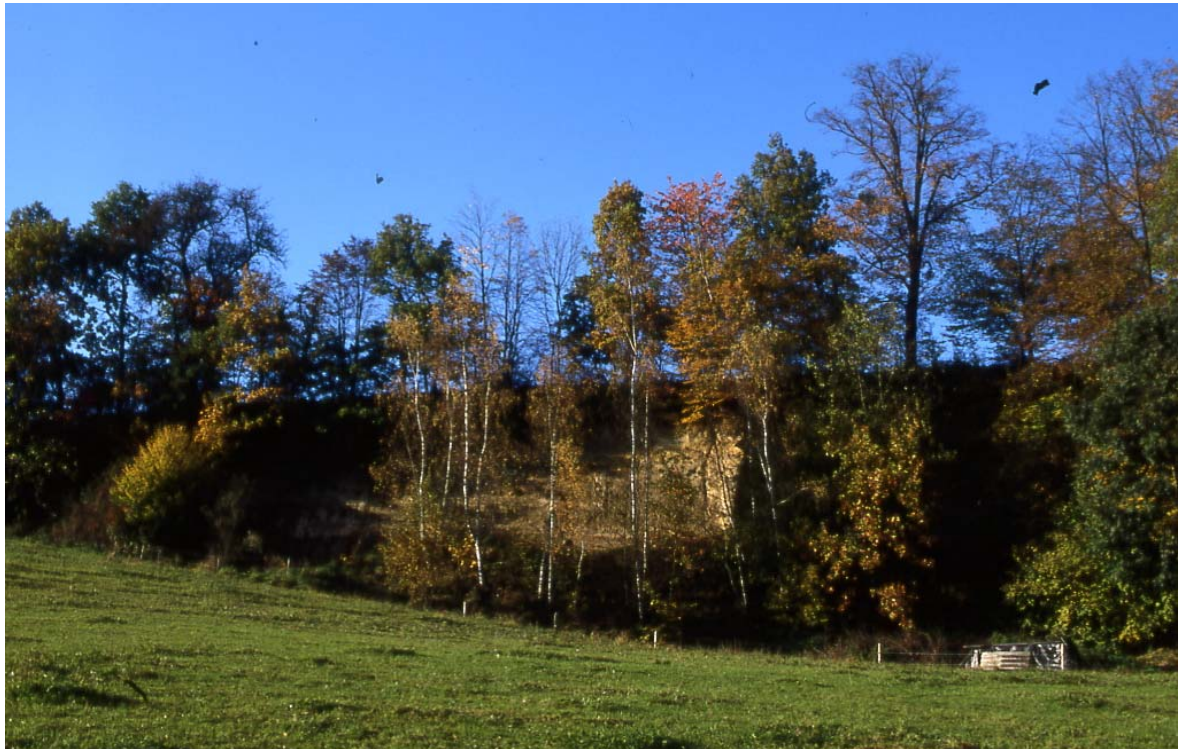
Abb. 3: Terrassenkante mit Feldgehölz und Steilwand.