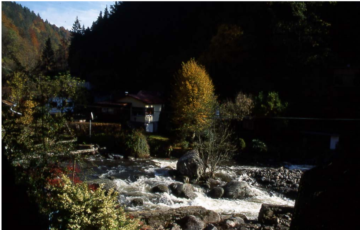
Abb. 1: Tal der Großen Rodl mit Siedlungsnutzung (Wochenendhäuser).