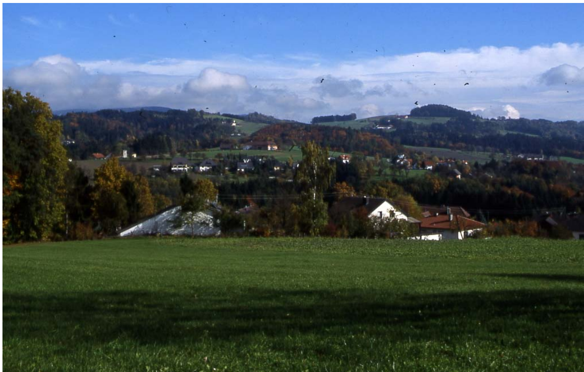
Abb. 2: Überblick über das Gemeindegebiet.