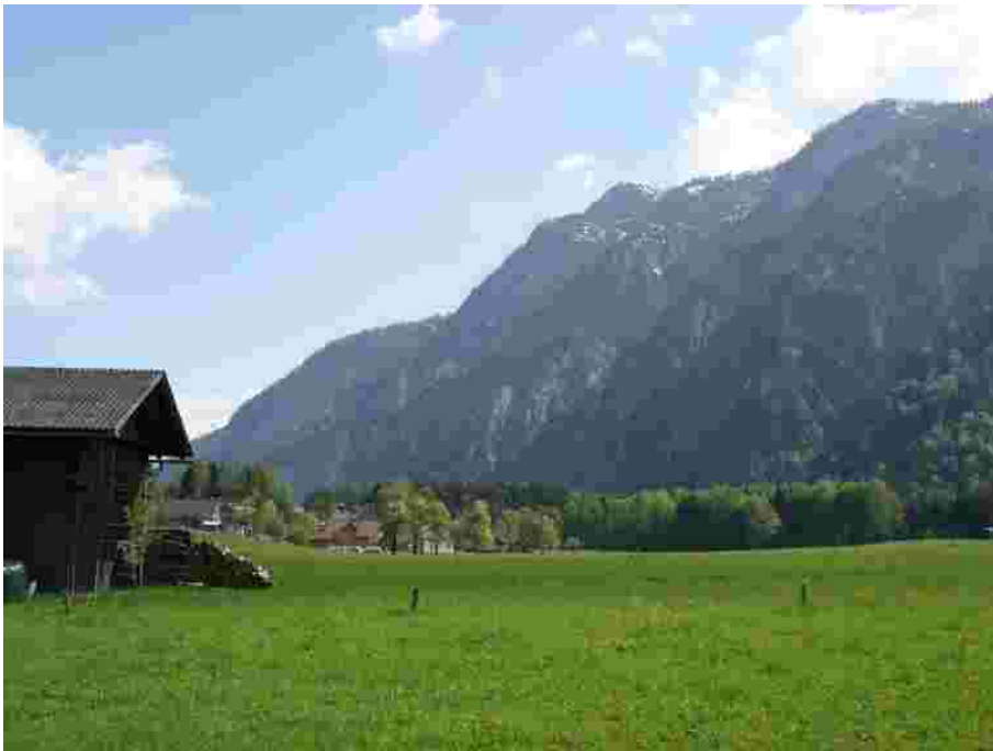
Foto 24007: Steile, zum Teil unbewaldete Flanken des Ramsaugebirges südlich von Bad Gai- sers