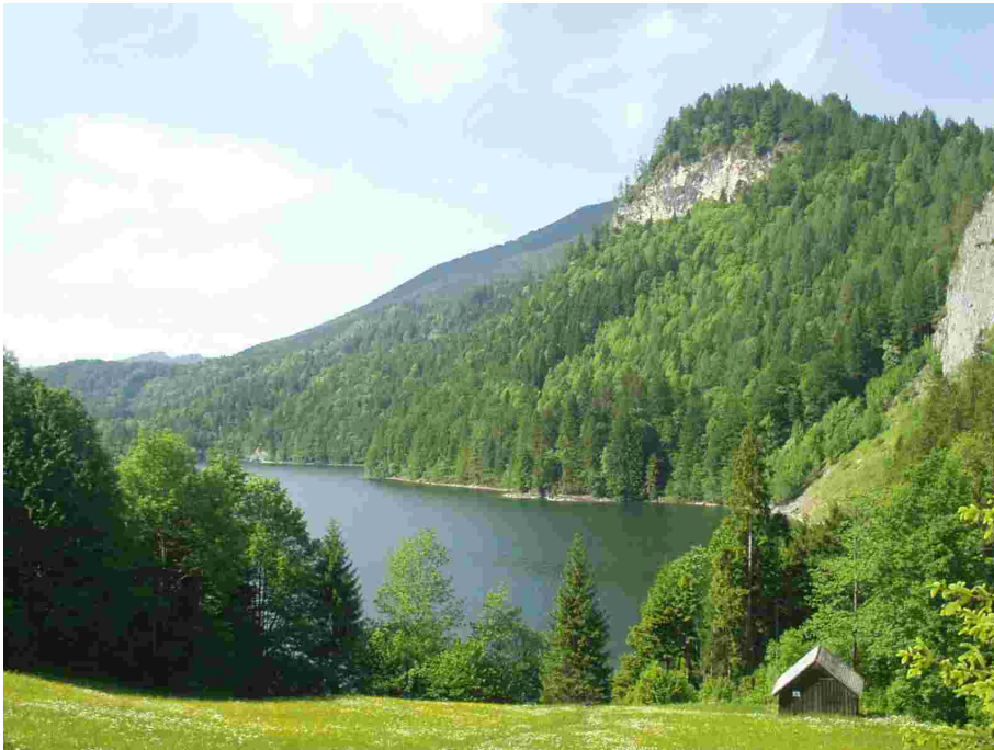
Foto 24003: Schwarzensee, im Hintergrund ausgedehnte Waldlandschaft