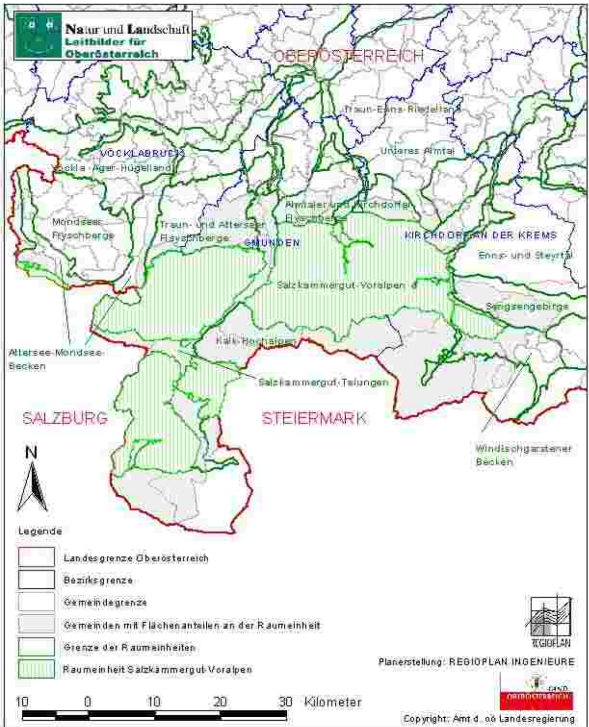
Abb. 2: Lage der Raumeinheit „Salzkammergut-Voralpen“

[Quellen: Amt der Oberösterreichischen Landesregierung, Bundesamt für Eich- und Vermessungswesen]