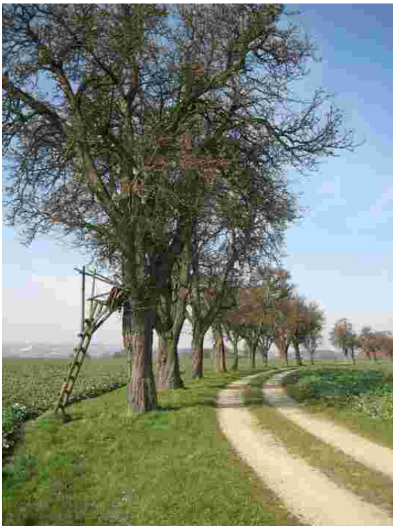
Foto 33007: Obstbaumreihe entlang eines Feldweges westlich von Neukematen