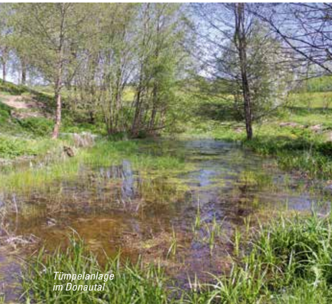
Tümpelanlage im Donautal