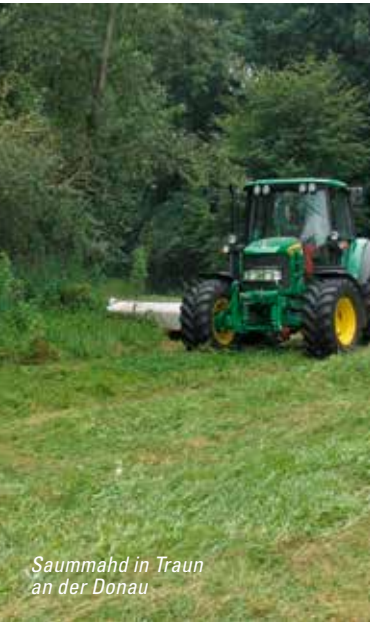
Saummäh in Traun an der Donau

Naturschutzarbeit bedeutet in erster Linie Managementarbeit. Nur in den seltensten Fällen kann über schutzwürdige Gebiete einfach ein Glassturz gestellt werden und das war's. Vielmehr sind in den meisten Gebieten zahlreiche Maßnahmen erforderlich, um die dortigen Schutzgüter zu erhalten.