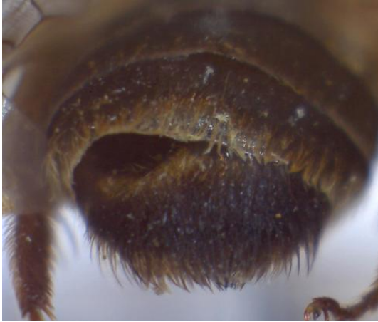
Abb. 3: Sandbiene Andrena flavipes (f) mit Ausschlüpföffnung eines männlichen Fächerflüglers

Männliche Fächerflügler sprengen die Puppenhülle, so dass sie ausschlüpfen, sich frei bewegen und auf das weibliche Pheromon reagieren können. Über die Ausschlüpföffnung lässt sich das gesamte Ausmaß der Schädigung des Wirtes erahnen