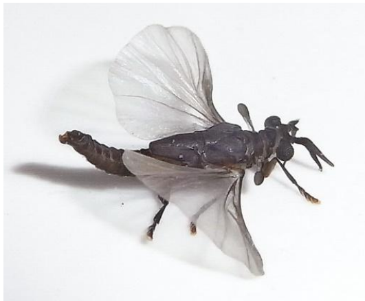
Abb. 1: Präparat eines männlichen Xenos vesparum

Die weltweit 600 Fächerflüglerarten sind kleine bis sehr kleine, parasitisch bei Hautflüglern, Wanzen und Zikaden lebende Insekten. Sie weisen einen kaum vorstellbaren Geschlechtsdimorphismus auf. Die Männchen können ihre Hinterflügel wie einen Fächer ausbreiten, woher der deutsche Name rührt. Ihre Vorderflügel sind zu Schwingkölbchen, wie man sie von Fliegen kennt, zurückgebildet.