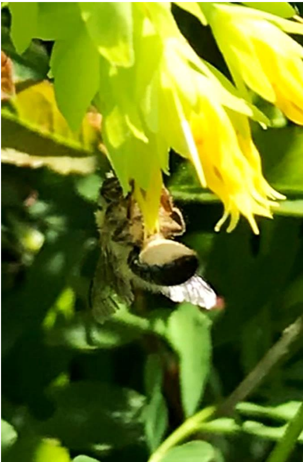
Osmia cerinthidis ♀