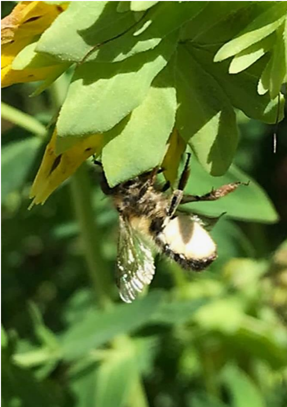
Osmia cerinthidis ♀