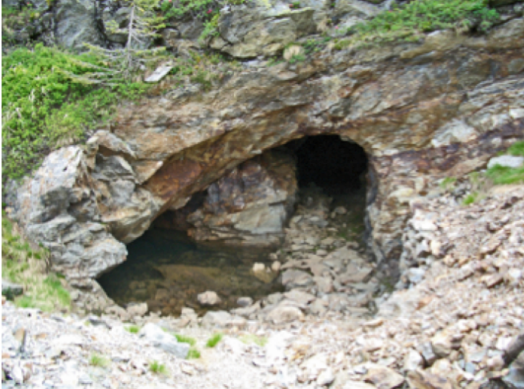
Abbildung 5. Schürfe und Suchörter unterhalb des Bodnerberges am sog. Spielbichl wurden mittels des händischen Schlenkerbohrens vorgetrieben. Figure 5. Pit underneath the Bodnerberg at the Spielbichl created by using manual drills.