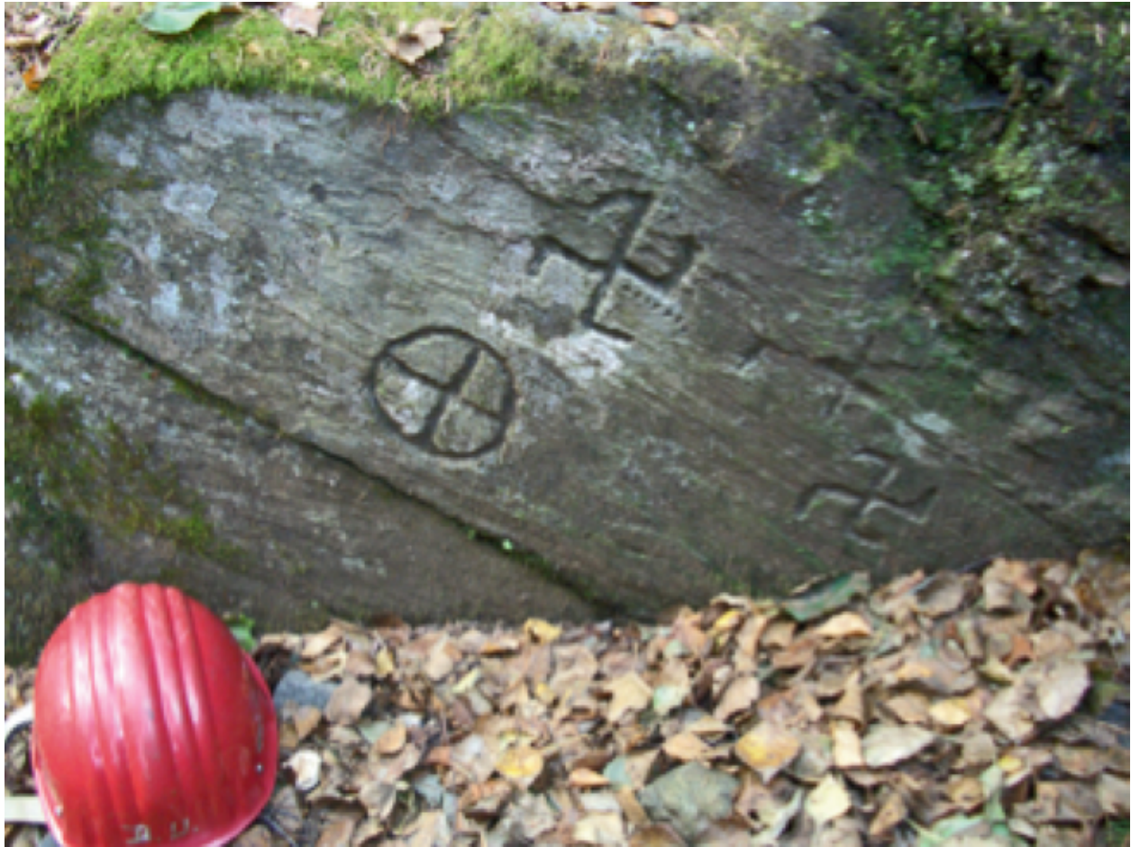
Abbildung 2. Runenartige Zeichen im Weiler Hinterstein. Figure 2: Runes in the village Hinterstein.

lebende Brixner Bischof Nikolaus von Kues verweist in einem Schreiben an Kaiser Friedrich III. auf diese alten Bergbaue, welche er in Gossensaß und Pflersch besessen hat. Die Bergbaue von Gossensaß und Pflersch sind damit wesentlich älter als bisher angenommen (KOFLER, 2002, 2003).