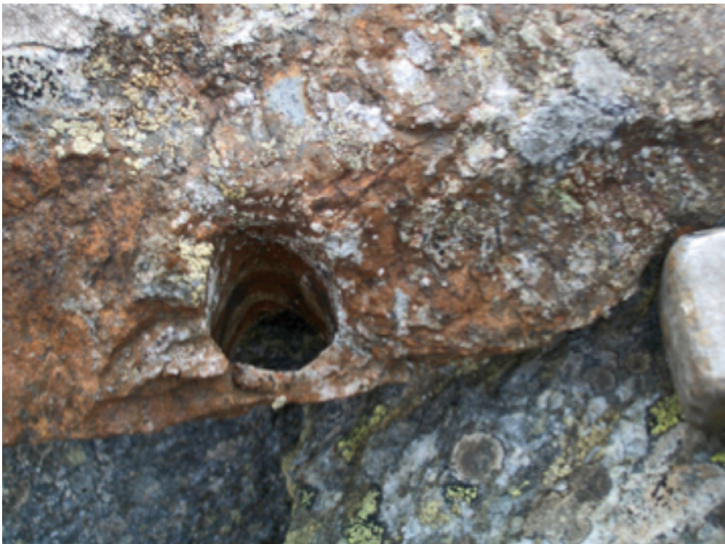
Abbildung 6. Händisch vorgetriebenes Bohrloch gefunden im Abraummaterial des Stollens. Figure 6. Manual drill hole.