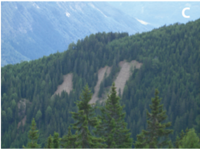
Abbildung 7. (A) Abraumhalde am Bodnerberg. (B) Eingemeißelte Jahreszahl an einem Stollenmundloch im Weiler Stein. (C) Abraumhalden im Bergbaurevier Pocherbrand. Figure 7. (A) Waste heap at the Bodnerberg. (B) Chisseld data at the portal of a gallery in the village Stein. (C) Waste heaps in the mining area Pocherbrand.