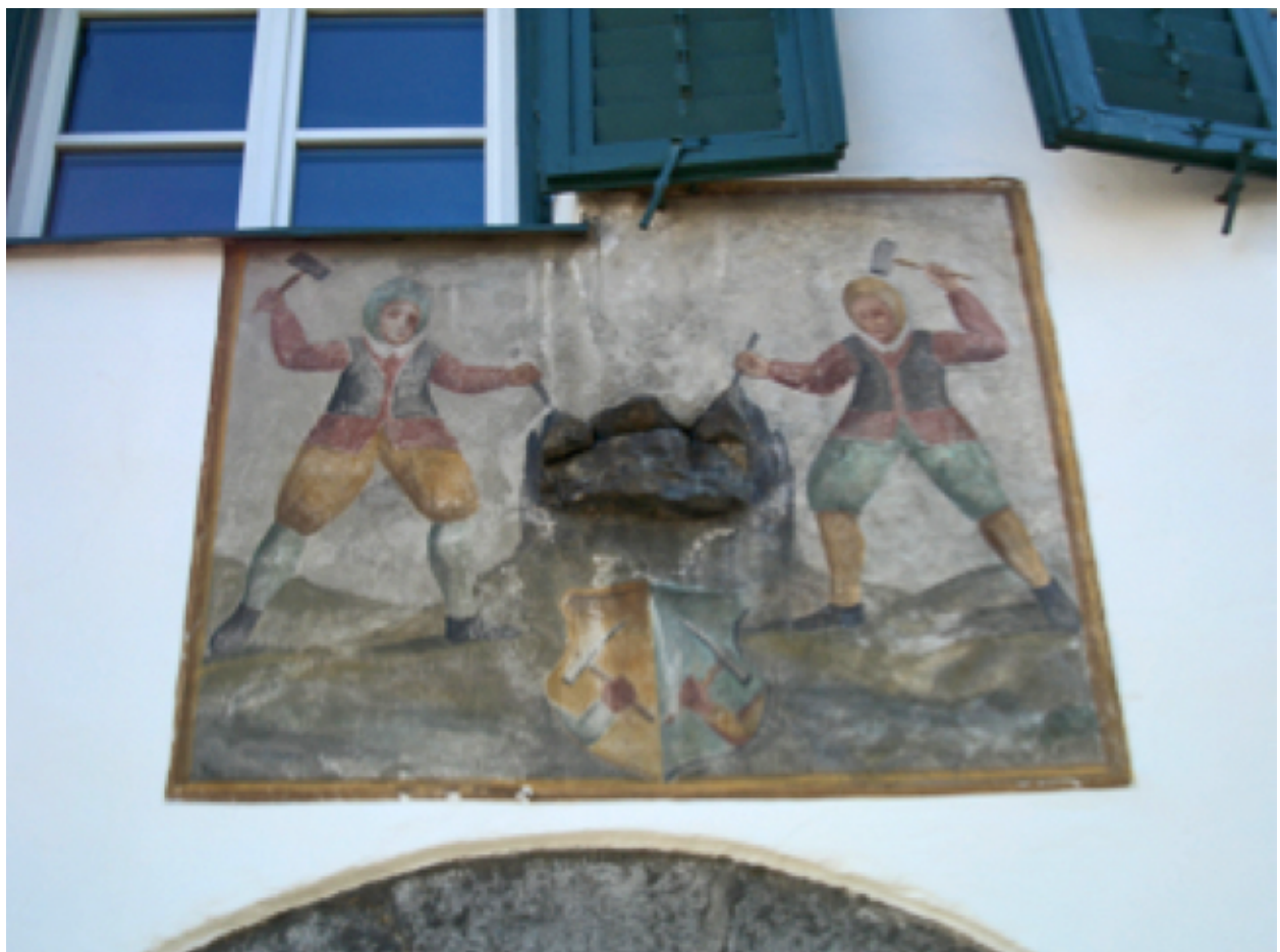
Abbildung 4. Eine eingemauerte Erzstufe oberhalb des Torbogens mit dem Bildnis zweier Knappen. Figure 4. Ore bench above an entrance showing two miners.

Noch heute kann man in Gossensaß eingemau- erte Erzstufen über den Hauseingängen finden (Abb. 4). Bis vor wenigen Jahren konnten noch 42 Stollenmundlöcher lokalisiert werden, die jedoch im Zuge der Pistenplanierung der Berg- bahnen Ladurns weitestgehend zerstört wurden. Jedoch zeugen zahlreiche Schürfe, Suchörter, Abraumbalden (Abb. 5, 6 und 7) und Flurnamen (Silberböden, Silbergasse, etc.) sowie Gebäude (Berggerichtshaus, Knappenkapelle St. Barbara in Gossensaß) von der einstigen regen Bergbau- tätigkeit. Abbildung 8 gibt einen geographischen Überblick über die Lokalitäten der ehemaligen Bergbaureviere im Pflerschtal.