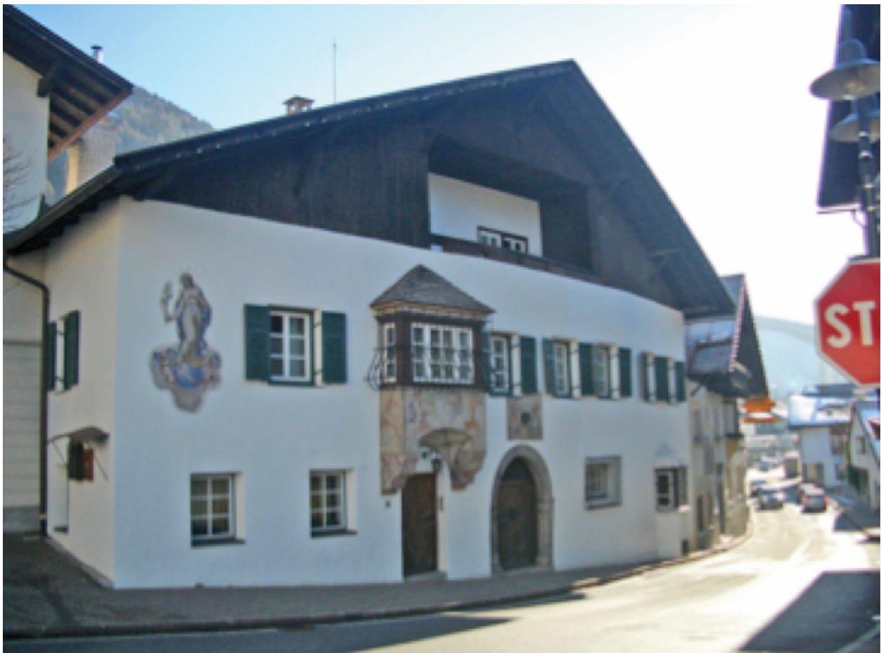
Abbildung 3. Ehemaliges Bergrichterhaus in Gossensaß. Figure 3. Former house of the court of mining justice in Gossensaß.

punkt. Zehn Jahre später werden für den Bereich „Ladurnspach“ lediglich 16.5 Tonnen gefördert Erz registriert. Gossensaß (vermutlich der „Alte Berg“) schlägt mit rund 11 Tonnen Erz zu Buche. Diese Zahlen lassen bereits zu Beginn des 16. Jahrhunderts auf einen Rückgang der Gesamtförderung schließen (BAUMGARTEN et al., 1998). Abgebaut wurden in dieser Zeit im Bergbaurevier Gossensaß- Pflersch silberreiche Bleierze (Ag-reicher Galenit), die im Inntal für die Verhüttung des Fahlerzes gebraucht wurden. Die Gewinnung von Kupfer, das wir heute kaum mehr irgendwo finden können, ist urkundlich zwar belegt, doch sicherlich von untergeordneter Bedeutung gewesen. Auch der Bleiglanz aus den Gossensasser Revieren scheint nicht von bester Qualität gewesen zu sein. Von den Hütten im Inntal war die hohe Bleierzanlieferung aus den verschiedensten