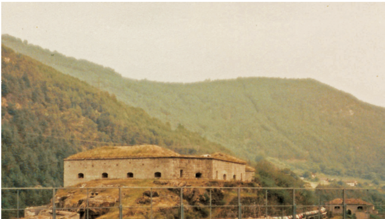
Abb. 2: Detail der Franzensfeste, erbaut zwischen 1833 bis 1838 unter Kaiser Ferdinand I. (1793-1875) und nach Kaiser Franz I. von Österreich (1768-1835), dem Monarchen während der Planungsphase, benannt.

(Abb. 2). Nach dem Gebietsverlust der Lombardei und Venetien infolge der Schlacht von Solferino 1859 begann die k. u. k. Militärverwaltung mit einem Ausbau von Befestigungsanlagen (mehrgeschossige Natursteinmauerwerke mit Geschützen hinter den Mauerscharten) entlang der neuen Grenze gegen Italien zwischen Gardasee und der Schweizer Grenze. Diese Befestigungsart war damals zwar bereits veraltet, bot aber den Waffen Schutz vor der Witterung im Gebirge. Darüber hinaus rechnete man nicht damit, dass jemals schwere Artillerie im Gebirge zum Einsatz kommen könnte und hielt die vorhandene Befestigung für ausreichend. Nach der Niederlage in der Schlacht von Königgrätz 1866 musste Österreich auch Venetien an Italien abtreten. Infolge dessen wurde unter anderem der Raum um Trient und das Kanaltal gesichert, auch hier in einer für Österreich typischen extrem sparsamen Bauweise. Erst in den letzten 15 Jahren des 19. Jahrhunderts