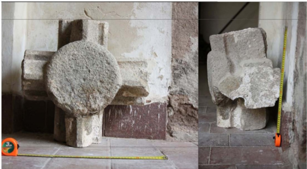
Abb. 2: Der Schlußstein des Gewölbes, 14. Jahrhundert.