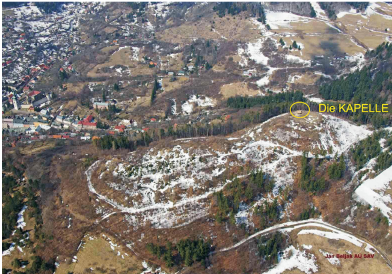
Abb. 1: Die Lage der Lokalität in der Nähe von Stadtkern Banská Štiavnica (Schemnitz). Photo: J. Beljak Fig. 1: The position of the locality near the city center Banská Štiavnica (Schemnitz). Photo: J. Beljak Illustrace 1: Poloha lokality v blízkosti centra mesta Banská Štiavnica (Schemnitz). Foto: J. Beljak