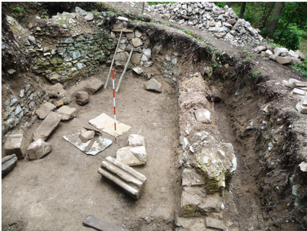
Abb. 3: Die Entdeckung der Burgkapelle mit einem Architekturfragment. Blick von Westen. Photo: J. Labuda

Fig. 3: The discovery of the chapel with an architectural fragment. View from the west. Photo: J. Labuda