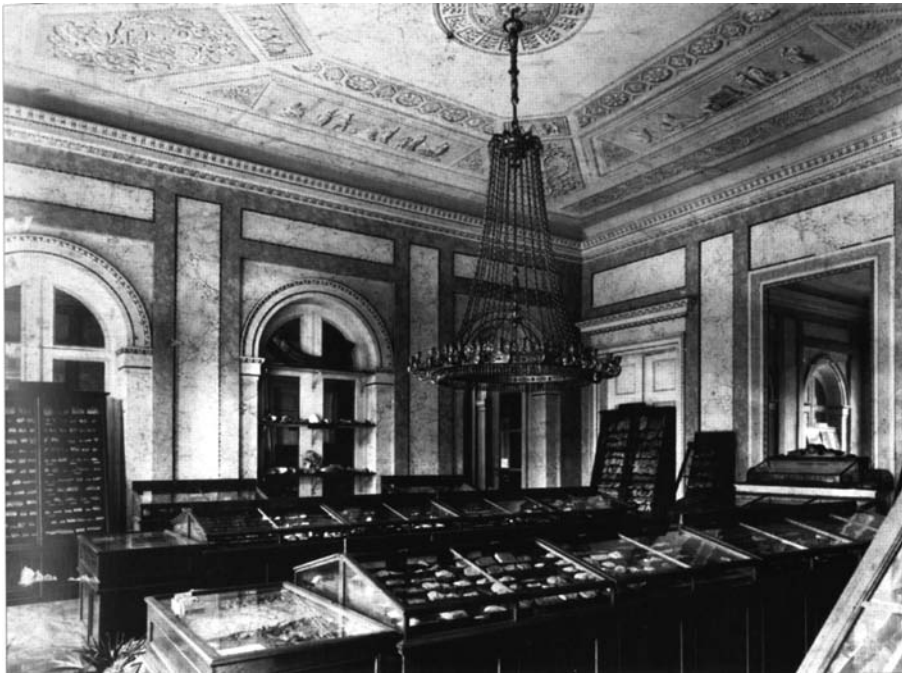
Abb. 3: Ehemalige Sammlungsanstellung im Spiegelsaal des Palais Rasumofsky um 1890 (Bibliothek GBA, Graphische Sammlung).

Der Umfang der makropaläontologischen Typen entspricht 17% der Paläontologischen Ladensammlung. Der Großteil ist inventarisiert und digital erfasst und im „ Catalogue of Palaeontological Types in Austrian Collections “ ( www.oeaw.ac.at/~oetyp/pal-home.htm ) abfragbar. In dieser von der Österreichischen Akademie der Wissenschaften finanzierten und am Naturhistorischen Museum Wien zentral verwalteten Datenbank ist die Geologische Bundesanstalt mit ca. 15.000 Datensätzen vertreten.