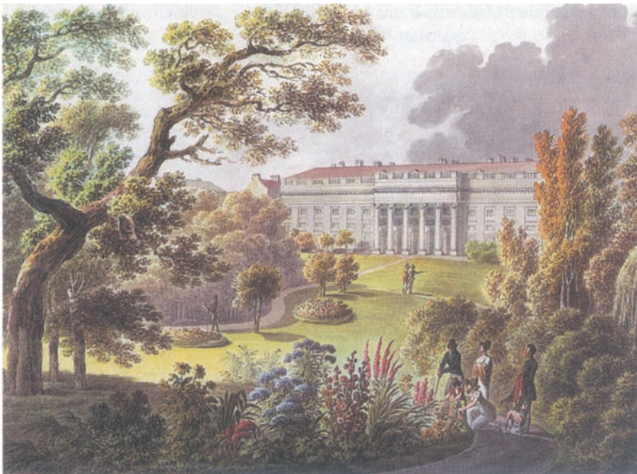
Abb. 1: Palais Rasumofsky um 1850.

1849 wurden diese etwa 40.000 Positionen enthaltenen Sammlungsbestände der neu gegründeten